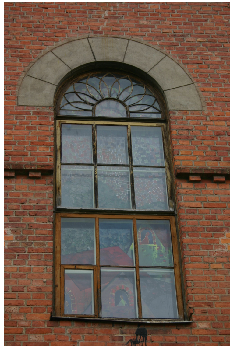
Kalna_19_62010220042001_logs1 Sākotnējs (1866.g.) logs.