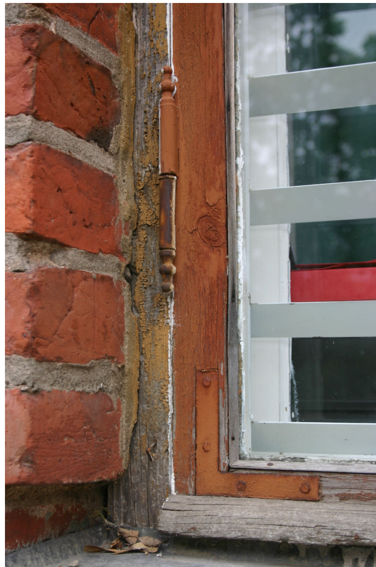
Kalna_19_62010220042001_logs3 Sākotnējs (1866.g.) loga aprīkojums.