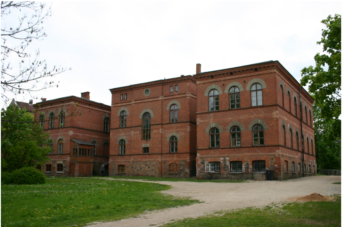
Kalna_19_62010220042001_fasade2 Skats uz ēku no ziemeļaustrumiem.