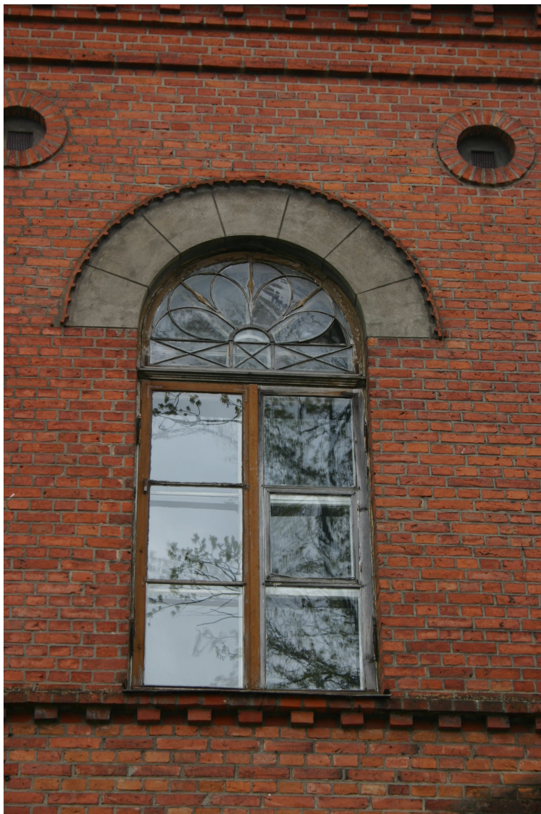
Kalna_19_62010220042001_logs2 Sākotnējs (1866.g.) logs ar oriģinālo aprīkojumu.