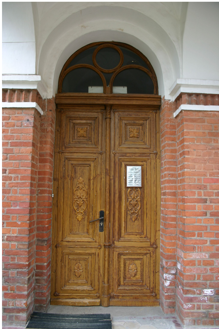
Kalna_19_62010220042001_durvis1 Sākotnējs (1866.g.) durvju komplekts ar oriģinālo aprīkojumu.