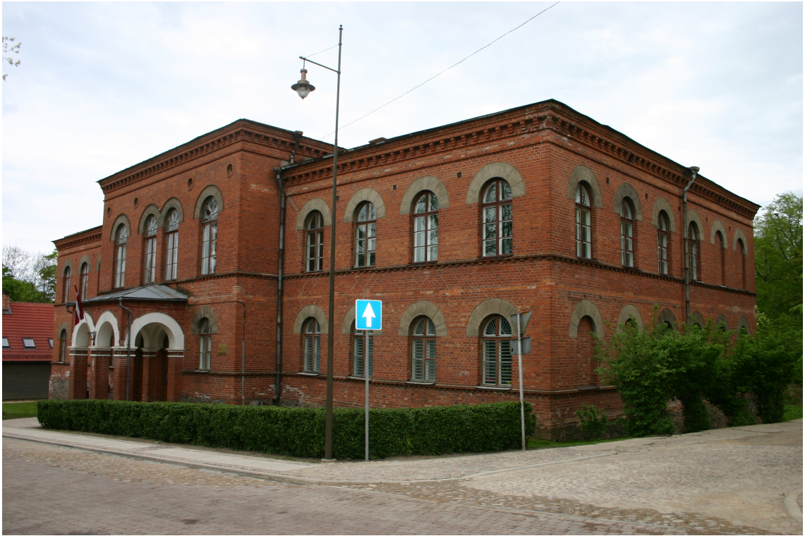
Kalna_19_62010220042001_fasade1 Skats uz ēku no dienvidrietumiem.