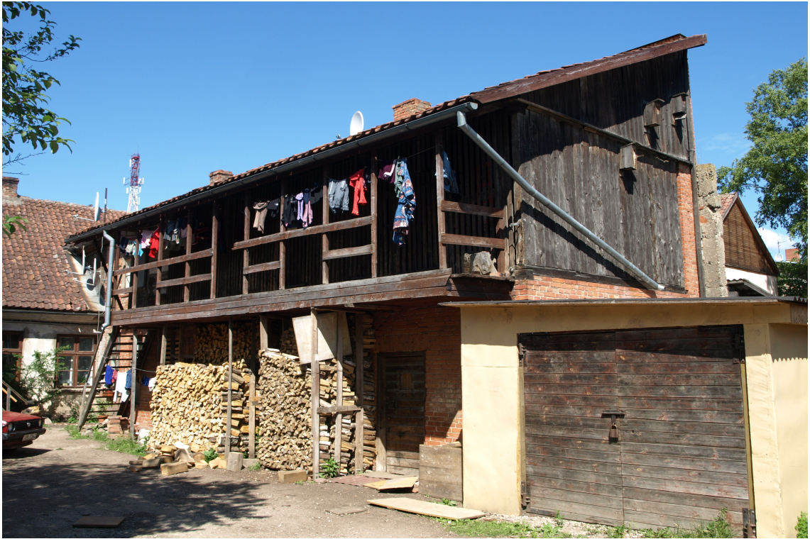
Dzirnavu_8_62010230038002_fasade1 Skats uz ēku no dienvidaustrumiem. Pašreizējā koka galerija – 20.gs.2.puse.