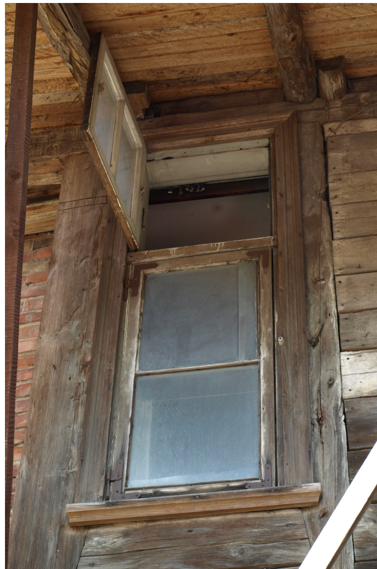
Dzirnavu_8_62010230038002_logs1 Sākotnējs (20.gs.sāk.) logs ar oriģinālo aprīkojumu un apmales, palodze.