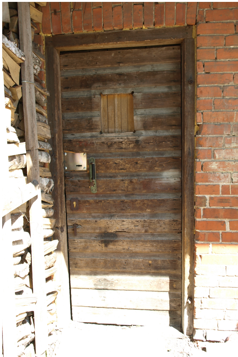
Dzirnavu_8_62010230038002_durvis1 Sākotnējās (20.gs.sāk.) durvis.