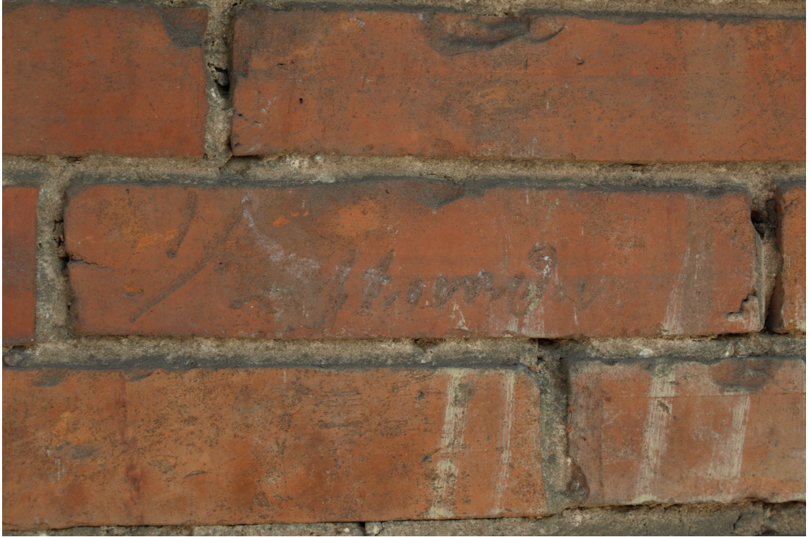
Dzirnavu_8_62010230038002_detala1 Marķēts ķieģelis.