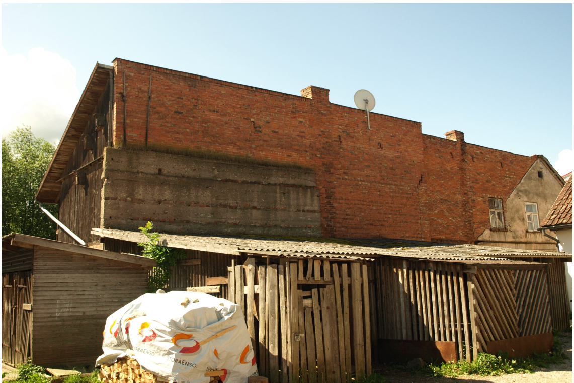
Dzirnavu_8_62010230038002_fasade2 Skats uz ēku no ziemeļaustrumiem.