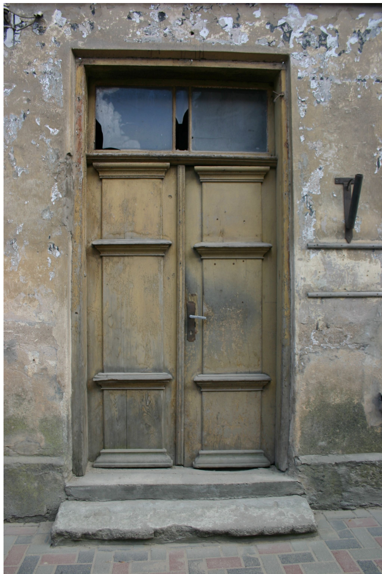
Bazniicas_23_62010060073001_durvis1 Sākotnējs (1870to gadu sāk. - 1879.g.) durvju komplekts ar oriģinālo atslēgas cauruma nosegvairodziņu.