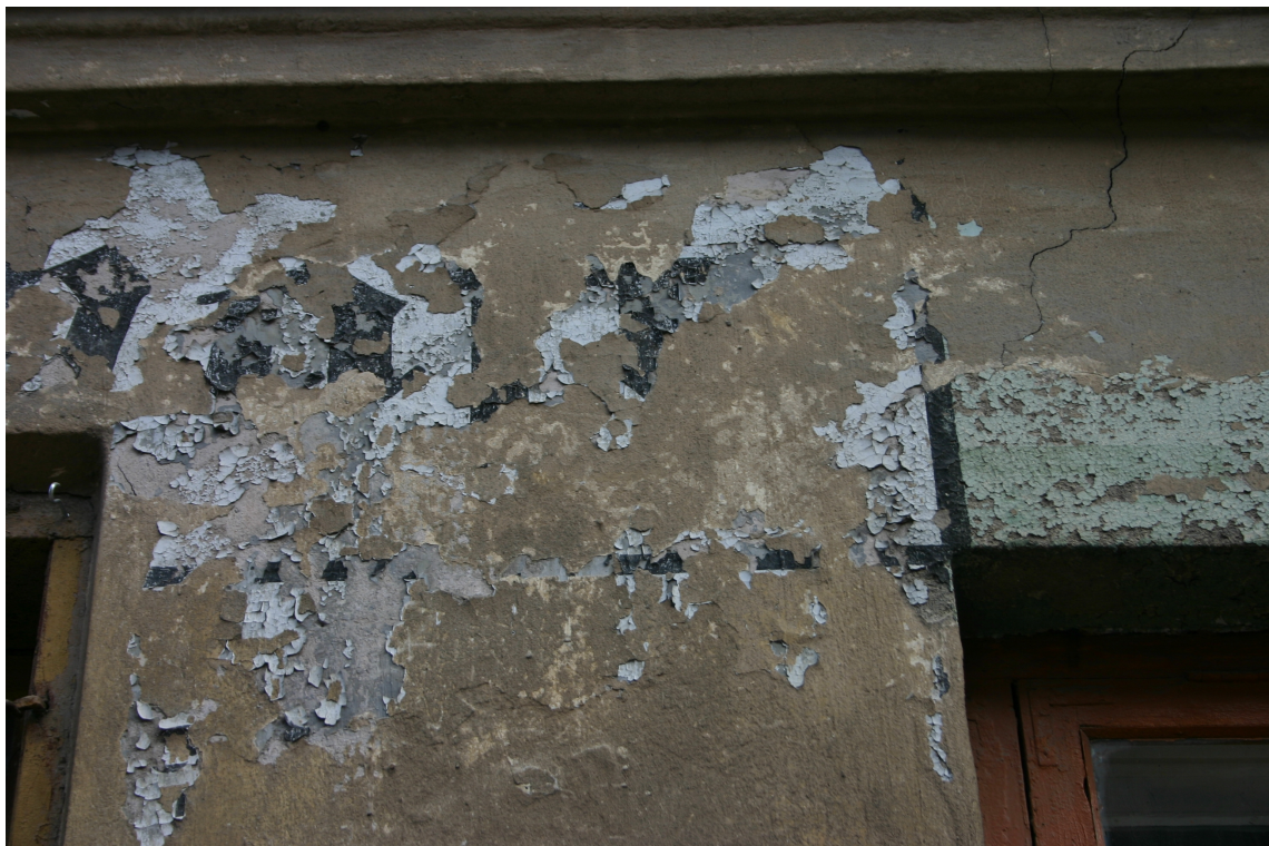
Bazniicas_23_62010060073001_fragments1 Galvenās fasādes fragments ar 20.gs.sāk. fasādes un reklāmas krāsojumu.