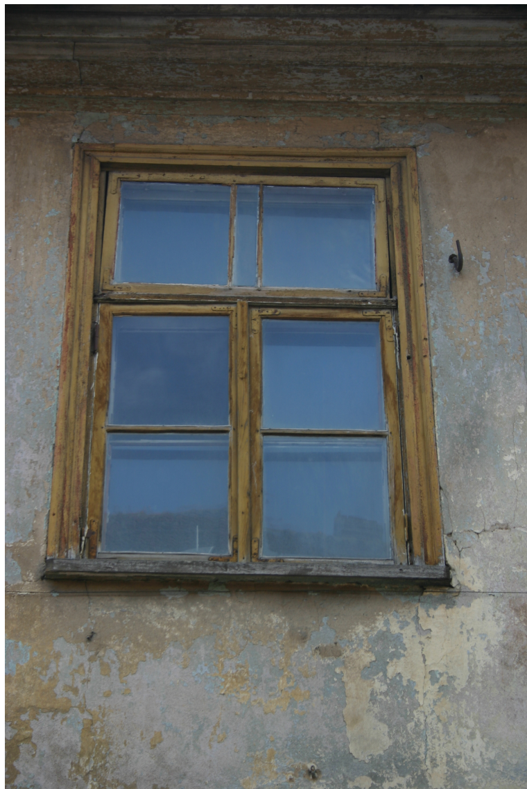
Baznīcas_23_62010060073001_logs2 Sākotnējs (1870to gadu sāk. - 1879.g.) logs ar oriģinālo aprikojumu.