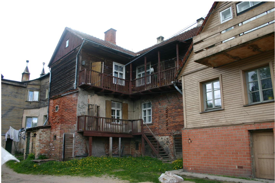
Baznīcas_23_62010060073001_fasade2 Skats uz ēku no austrumiem. Esošās koka galerijas izveidotas 20.gs.2.pusē.