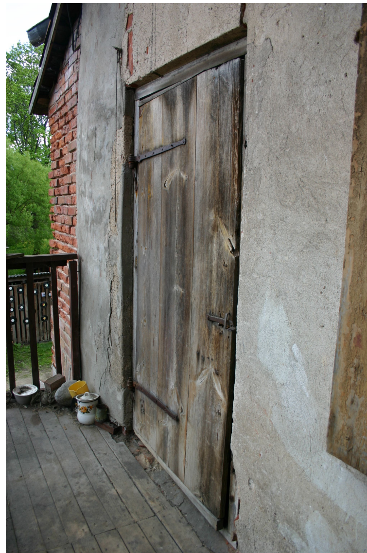
Bazniicas_23_62010060073001_durvis2 Sākotnējās (1870to gadu sāk. - 1879.g.) durvis ar oriģinālo aprīkojumu.