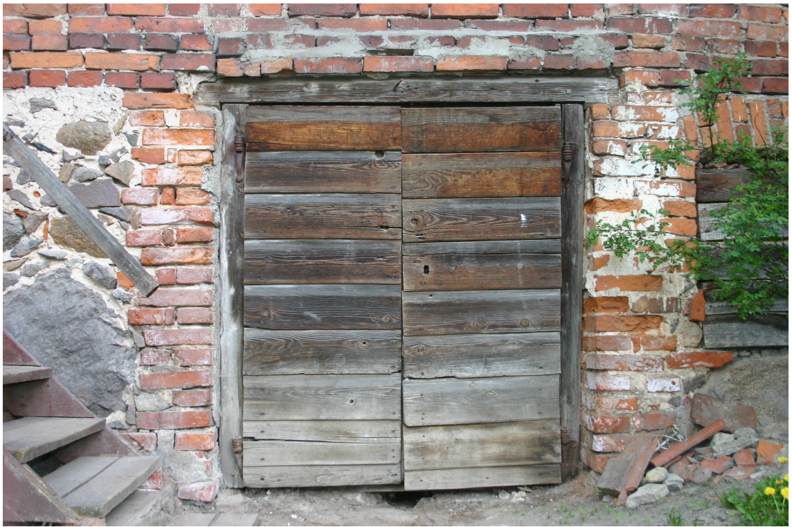
Baznīcas_23_62010060073001_durvis3 Sākotnējās (1870to gadu sāk. - 1879.g.) durvis ar oriģinālo aprīkojumu.