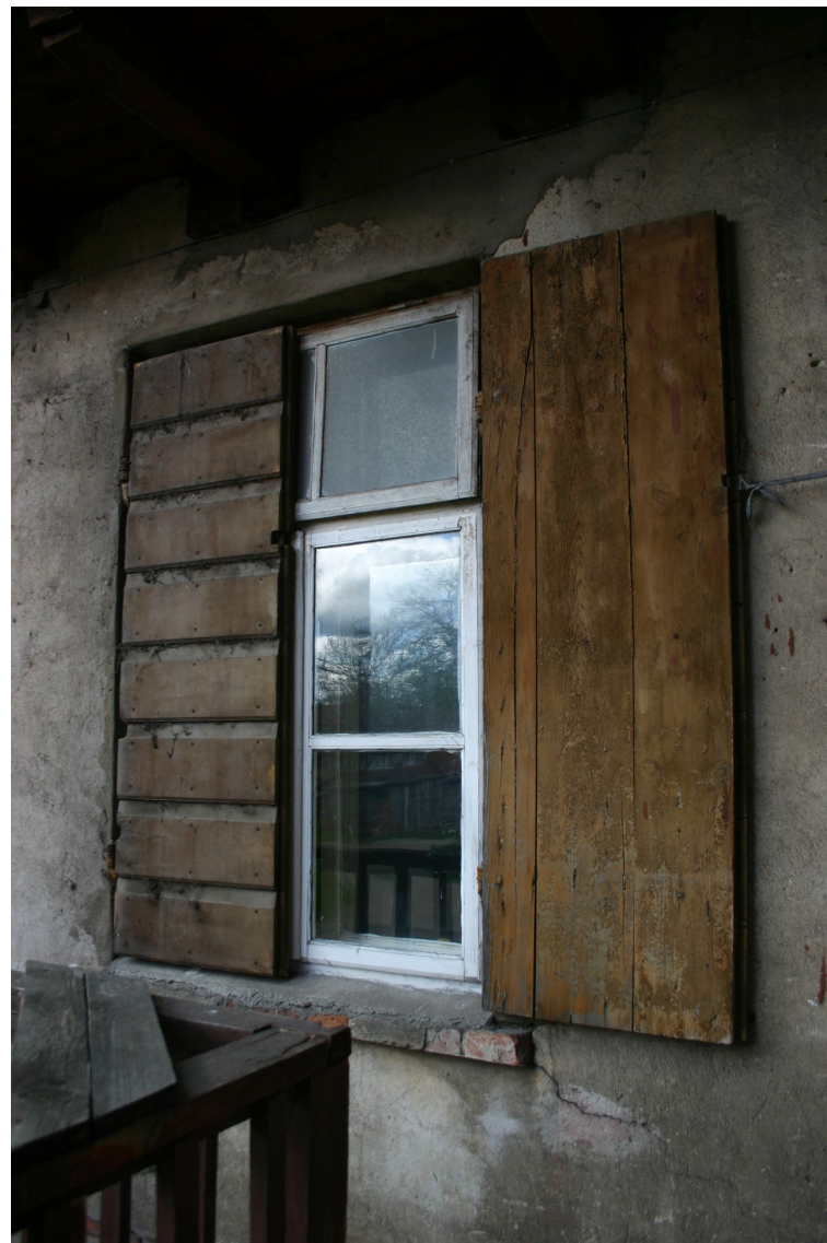
Baznīcas_23_62010060073001_slegi1 Sākotnēji (1870to gadu sāk. - 1879.g.) slēģi ar oriģinālo aprikojumu.