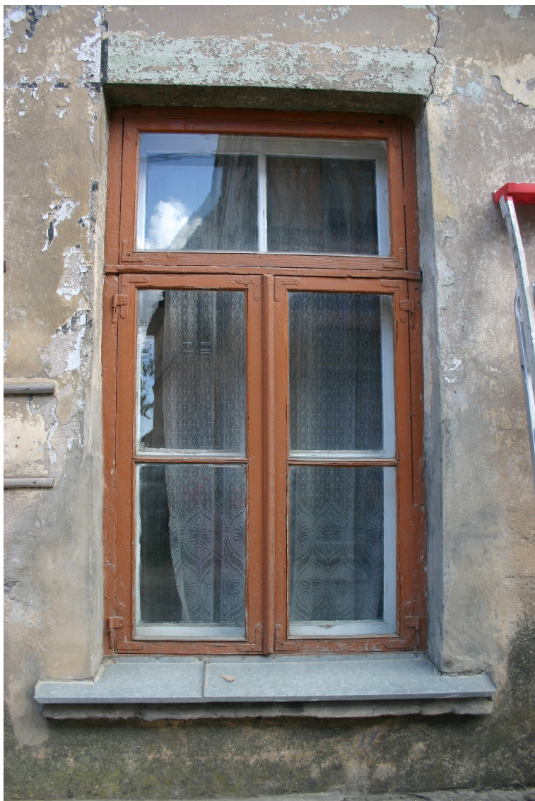
Baznīcas_23_62010060073001_logs1 20.gs.sāk. logs ar oriģinālo aprīkojumu.