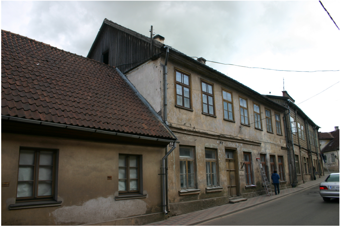
Baznīcas_23_62010060073001_fasade1 Skats uz ēku no ziemeļiem.