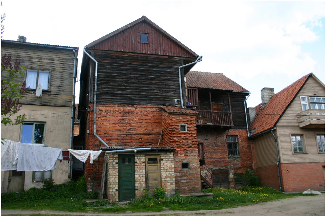
Bazniicas_23_62010060073001_fasade3 Skats uz ēko no dienvidaustrumiem.