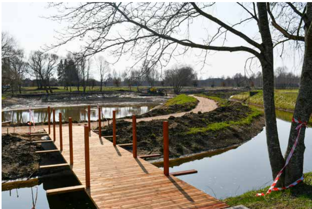
Māras dīķa atjaunošanas darbi rit pilnā sparā. Tos iecerēts pabeigt šogad.

Skrundas pilsētā un pagastā šogad turpināsies Kuldīgas ielas izbūve, Skrundas pilskalna un tam piegulošās teritorijas attīstības projekta izstrāde, kā arī sporta stadiona pie Skrundas pamatskolas projektēšana, pie Ventas upes Skrundā un Raņķos tiks uzstādītas divas pontonu laipas, izveidojot laivošanas maršrutu. Tāpat Skrundas pilsētā plānots izbūvēt apgaismojumu Saldus ielas zaļajā zonā, kā arī atjaunot estrādes tiltiņu. Savukārt Skrundas pagastā tiks īstenoti ceļu atjaunošanas darbi.