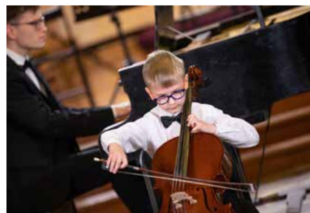
Kuldīgu pieskandina čella skaņas