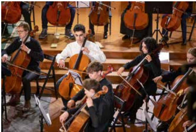
Lielkoncertā Kuldīgas Sv. Katrīnas evaņģēliski luteriskajā baznīcā savas prasmes čella spēlē demonstrēja gan konkursa laureāti, gan arī starptautiskā konkursa žūrija.