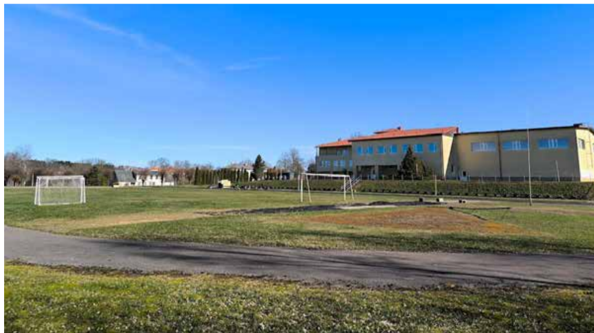
Atjaunos sporta laukumu pie Alsungas Mākslu pamatskolas.

Projekta izmaksas – 216 317 EUR, kuras 100% apmērā tiek segtas no Valsts budžeta un Eiropas Savienības fondu finansējuma.