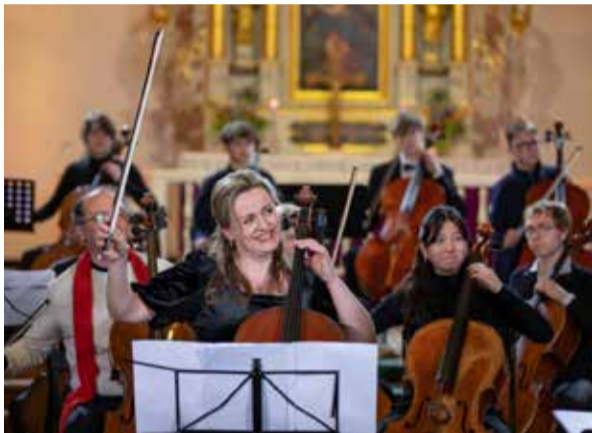
Kuldīgas Sv. Katrīnas evaņģēliski luteriskajā baznīcā uzstājās izcilā latviešu čelliste Kristīne Blaumane.