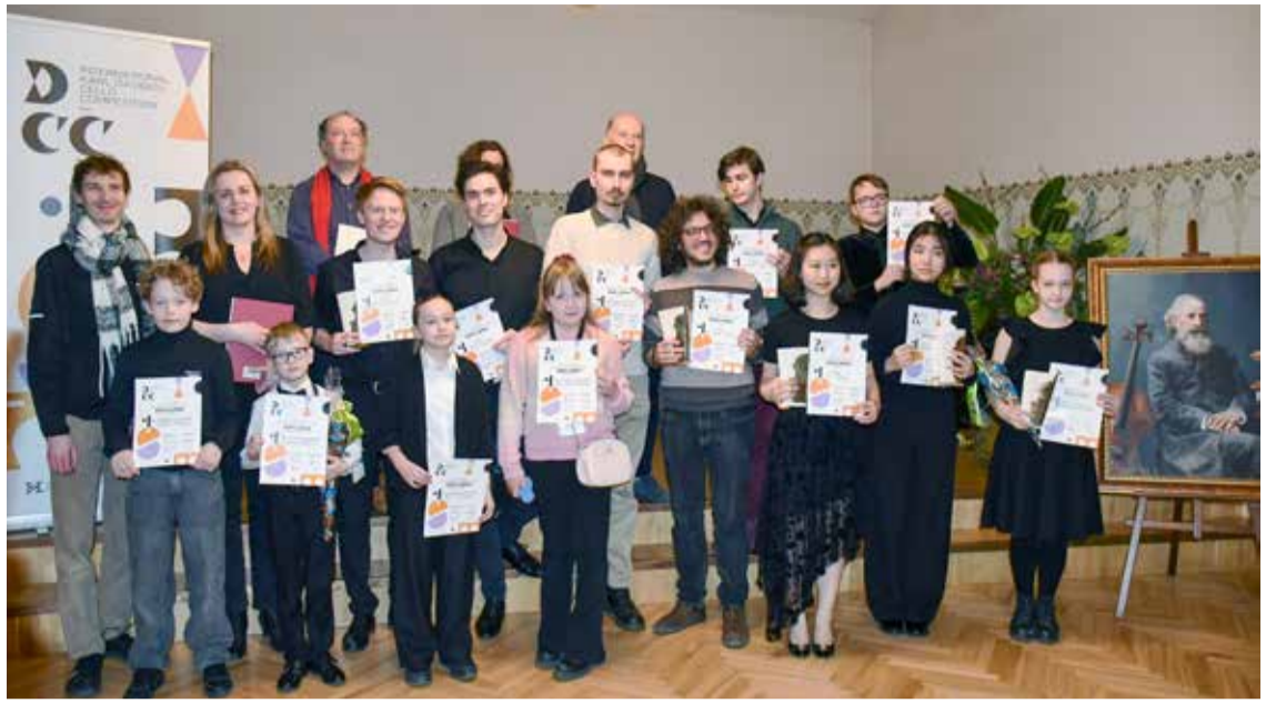
Ernesta Vignera Kuldīgas mūzikas skolā vairāku dienu garumā tika noskaidroti 11. Starptautiskā Kārļa Davidova čellistu konkursa uzvarētāji.

Pēc vairāku gadu pārtraukuma no 16. līdz 22. martam Kuldīgā un Rīgā norisinājās 11. Starptautiskais Kārļa Davidova čellistu konkurss. Čella mūzikas cienītājiem bija iespēja ne tikai baudīt 47 jauno un perspektīvo čellistu sniegumu no 15 valstīm, bet arī apmeklēt čella mūzikas koncertus tepat Kuldīgā.