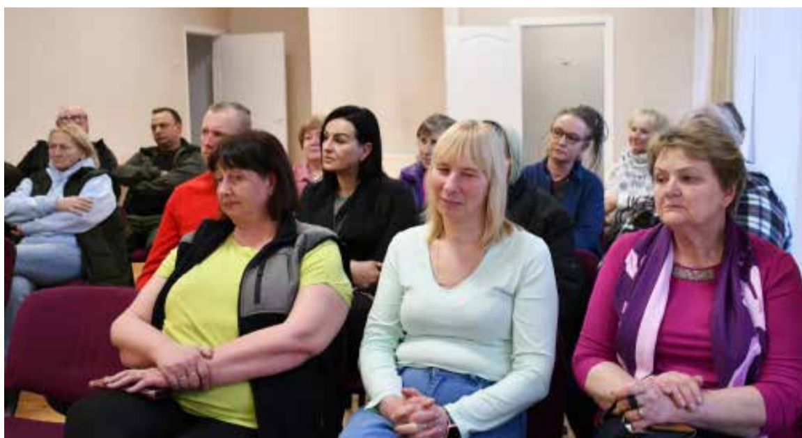
Laidu pagasta iedzīvotājus interesē saimnieciskie jautājumi un priecē muižas attīstība.

Pagasta iedzīvotāji interesējās par lieltgabariņa atkritumu un elektropreču nodošanu. Izpilddirektora