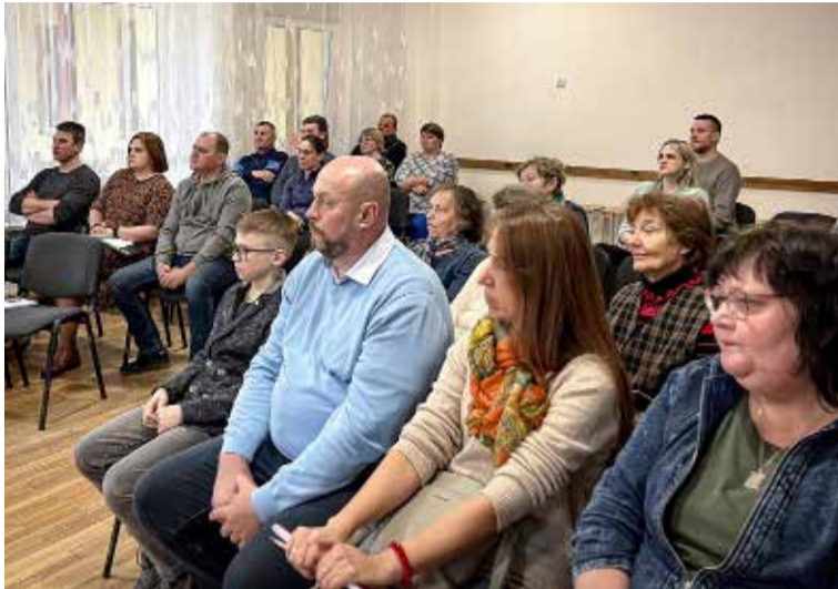
Iedzīvotāju sapulce veicina dialogu starp iedzīvotājiem un pašvaldību, ļaujot kopīgi risināt aktuālus jautājumus.

Ābeļciema iedzīvotāji vaicāja par ūdensvada un kanalizācijas izbūvi. Pašvaldība skaidroja, ka