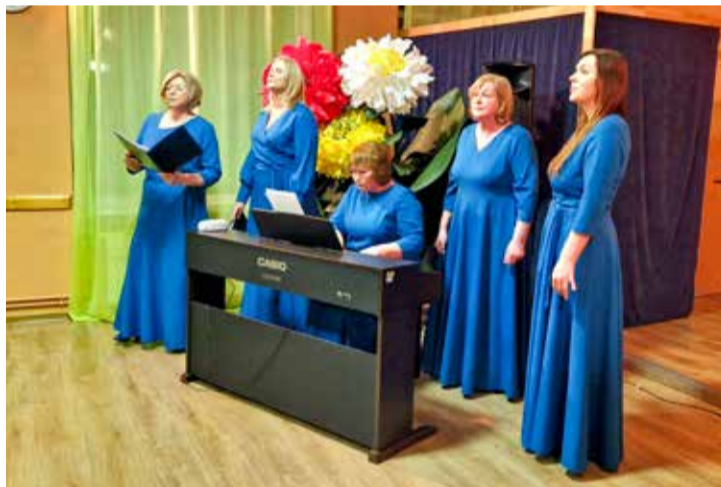
Starptautiskajai sieviešu dienai veltītajā koncertā “Tik dēļ Jums, dāmas!” dzied Nīkrāces vokālais ansamblis “Diantus”.

Sirsniņā un gaišā atmosfērā aizritēja Starptautiskajai sieviešu dienai veltītais koncerts “Tik dēļ Jums, dāmas!”. Koncertā skanēja gan skaistas dzies-