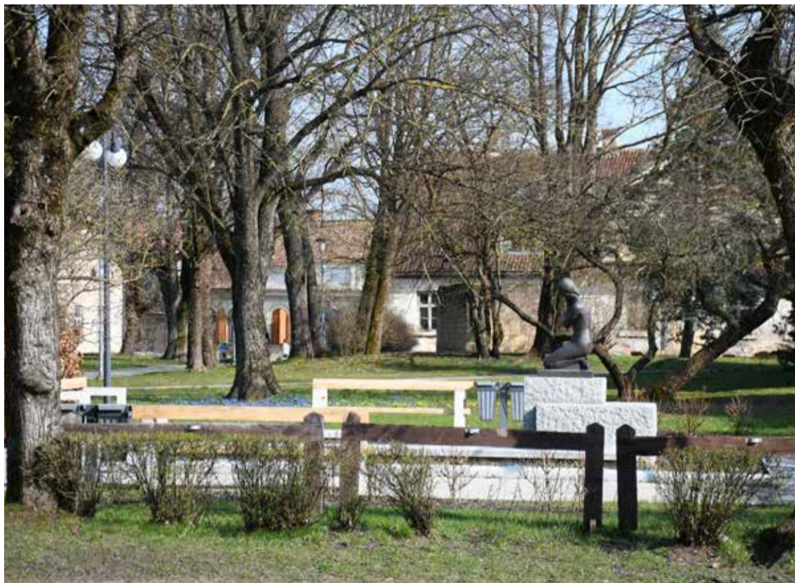
1905. gada parkā Kuldīgā gaidāmas pārmaiņas.

Tikko noslēdzies metu konkurss 1905. gada parka attīstībai Kuldīgas vecpilsētā. Parka teritorijā paredzēts izveidot atpūtas vietas, izbūvēt apgaismojumu, atjaunot segumu, veidot labiekārtojumus. Būvniecības darbus plānots uzsākt 2026. gadā. Projekta kopējās izmaksas tiek plānotas ap 1,2 miljoniem EUR, no kuriem 800 000 EUR ir Eiropas Savienības fondu finansējums.