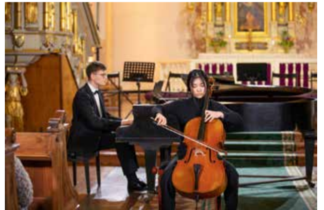
Kuldīgas Sv. Katrīnas evaņģēliski luteriskajā baznīcā uzstājās 11. Starptautiskā Kārļa Davidova čellistu konkursa uzvarētāji.