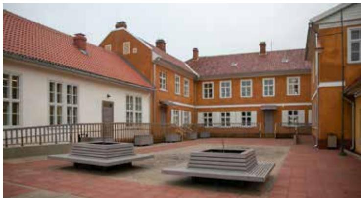
Sociālo pakalpojumu māja Liepājas ielā 14, Kuldīgā.

Šogad tiks uzsākta projekta īstenošana par sabiedrībā balstītu sociālo pakalpojumu sniegšanu pārbūvētajā ēkā Liepājas ielā 14, lai dienas centrā un specializētajās darbnīcās nodrošinātu pakalpojumus pilngadīgām personām ar garīga rakstura traucējumiem un bērniem ar funkcionāliem traucējumiem Kuldīgas novadā. Turpmākiem diviem gadiem projekta kopējās izmaksas ir 506 810 EUR, no kurām Eiropas Savienības fondu finansējums ir 430 788 EUR.