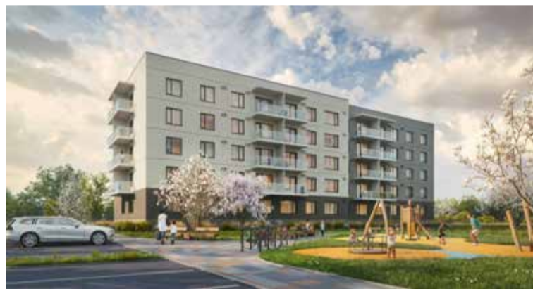
Topošā daudzdzīvokļu māja Lapeļļu ielā 1A, Kuldīgā.

16 metru augstā dzīvojamā māja atradīsies Kuldīgā, Lapeļļu ielā 1A. Tajā būs pieejami gan trīsistabu, gan divistabu un studio tipa dzīvokļi ar balkoniem, kas piemēroti dzīvei ar bērniem. Iedzīvotāju ērtībai tiks nodrošinātas arī autonovietnes un velonovietnes, kā arī atsevišķas noliktavas telpas un tehniskās telpas ēkas pagrabstāvā. Dzīvojamā māja atbildīs teju nulles enerģijas ēkas prasībām, savukārt vides pieejamības nodrošināšanai ēkā paredzēts lifts. Projekts top sadarbībā ar arhitektu biroju SIA “Lauder Architects” un