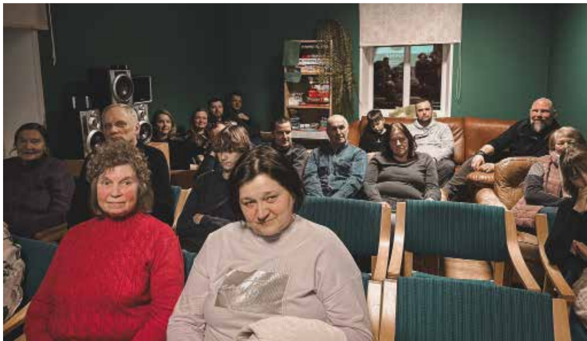
Vārmes pagasta iedzīvotāju sapulcē tika pārrunāti aktuālie jautājumi un izteikti ierosinājumi pagasta attīstībai.

Sapulcē tika spriests par Vārmes skolas apkures sistēmu un iespēju uzstādīt saules paneļus. Pašvaldības vadība skaidroja, ka pašreizējā