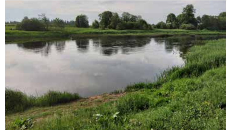
Projektā Raņķos Ventā tiks uzstādīta pontona laipa.

Projekta izmaksas – 54 200 EUR, no kurām Eiropas Savienības fondu finansējums 48 780 EUR.