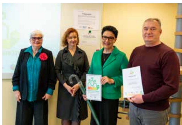
Kļūstam videi draudzīgāki