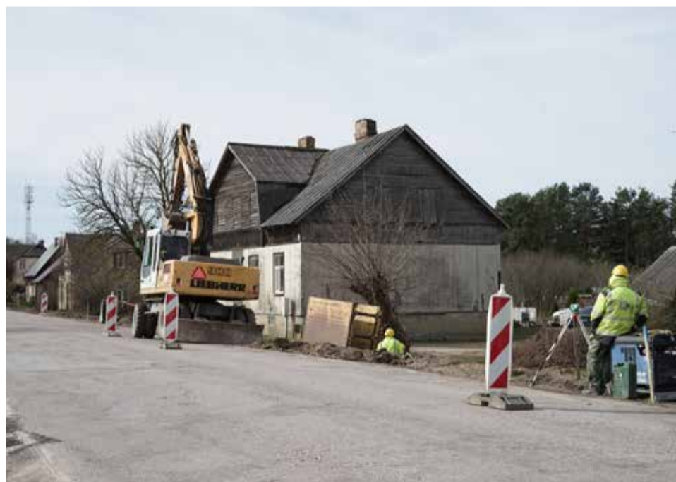
Sākušies Kuldīgas ielas pārbūves darbi Skrundā.