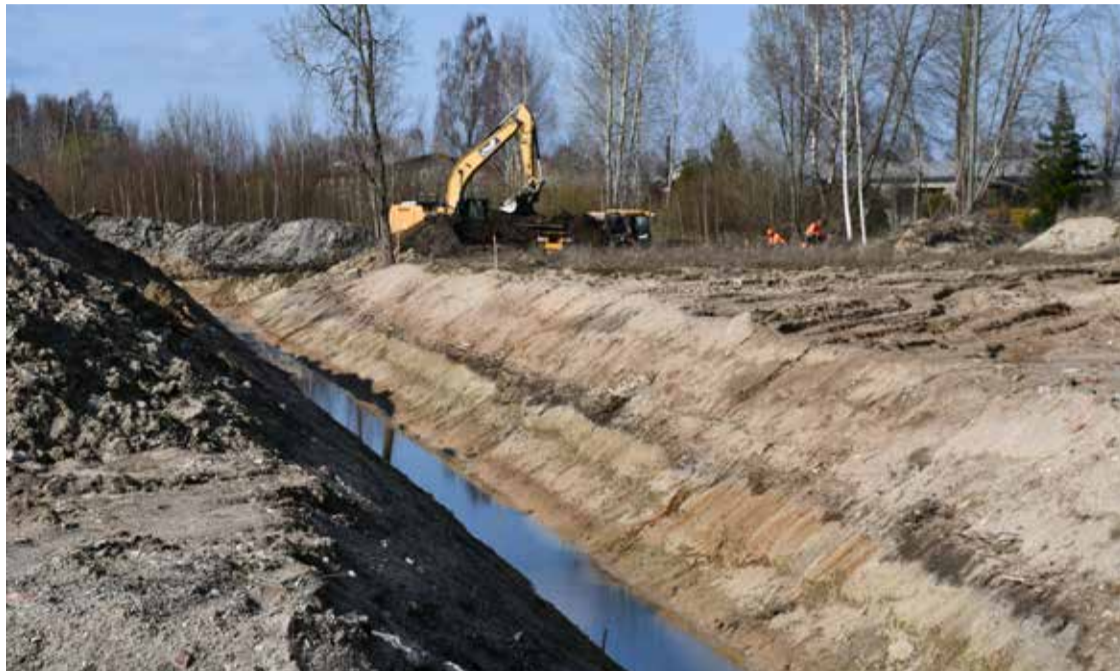
Pavasārī atsākušies Zirņu un Rudzu ielas pārbūves darbi.

Pagājušā gada nogalē Kuldīgas industriālajā teritorijā uzsāka Zirņu un Rudzu ielas pārbūve jeb projekta "Kuldīgas pilsētas dienvidu daļas infrastruktūras sakārtošana uzņēmējdarbības attīstībai 2. kārtā" īstenošana. Projektā tiks veikta Zirņu ielas un Rudzu ielas būvniecība ar cieto segumu 0,95 km garumā, sadzīves kanalizācijas, ūdensvada un lietus kanalizācijas izbūve, apgaismota gājēju un velobraucēju celiņa izbūve, kā arī labiekārtojums ar soliņiem un atkritumu urnām. Projekta faktiskā īstenošana ilgs līdz 2025. gada nogalei. Projekta kopējās izmaksas ir 1 914 856 EUR, no kurām Eiropas Savienības fondu finansējums ir 1 709 874 EUR.