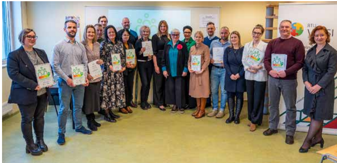
Lepojamies, ka mūsu iestādes kļuvušas videi draudzīgākas, rādot piemēru arī citiem.