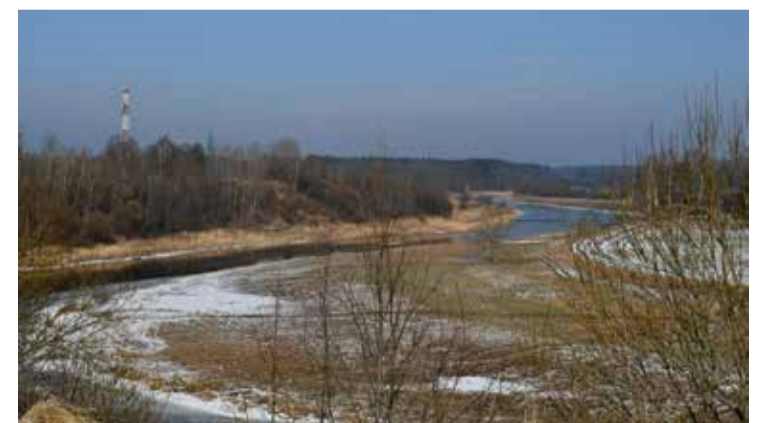
Top jauna pastaigu taka Kuldīgā no Mākslas dienu parka līdz Melnajai Kolkai.

Pastaigu taka sāksies pie Akmens un Kaļķu ielas krustojuma jeb Mākslas dienu parkā un noslēgsies pie Melnās Kolkas jeb Ventas upes stāvkrasta Ventas līkumā, kur jau ir izveidojies atpūtas laukums jeb skatu punkts. Tā tiks izbūvēta, maksimāli pietuvinot dabā jau šobrīd iestaigātajam gājēju takām. Jaunā taka būs 2 metrus plata un 2 kilometrus gara – lielākoties taku veidos nesaistīts minerālmateriāla segums, bet gravā – koka laipa uz pāļiem.