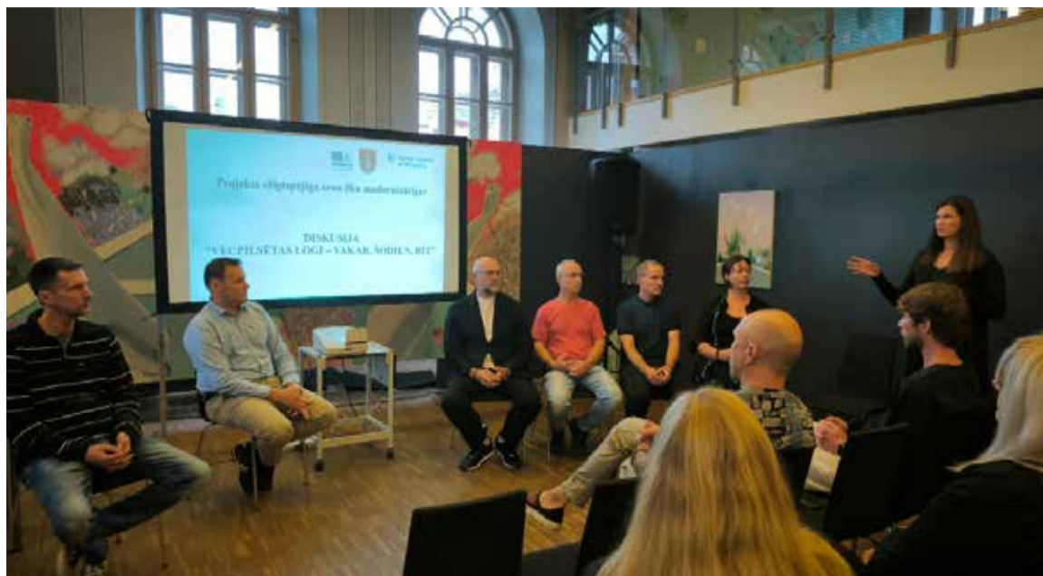
Izglītojošs seminārs un diskusija ēku īpašniekiem un būvniekiem "Vecpilsētas logi – vakar, šodien, rīt".

Pagājušā gada nogalē tika sarīkots izglītojošs seminārs ēku īpašniekiem un būvniekiem, kā arī notika