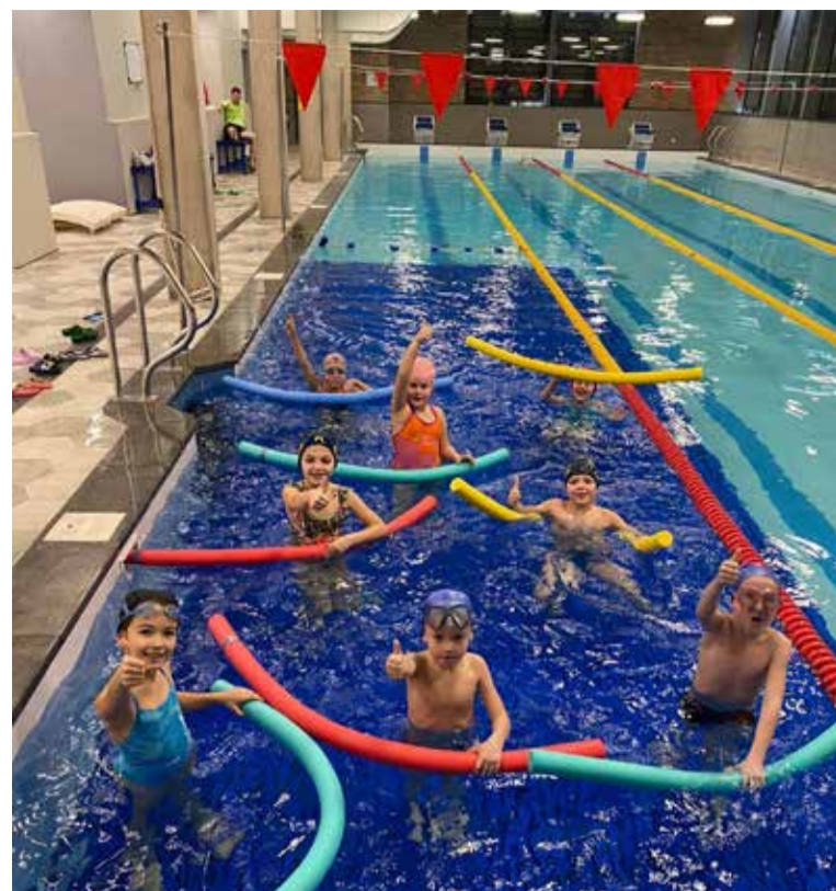
Kuldīgas peldbaseinā peldēt apmācību apgūst skolēni.