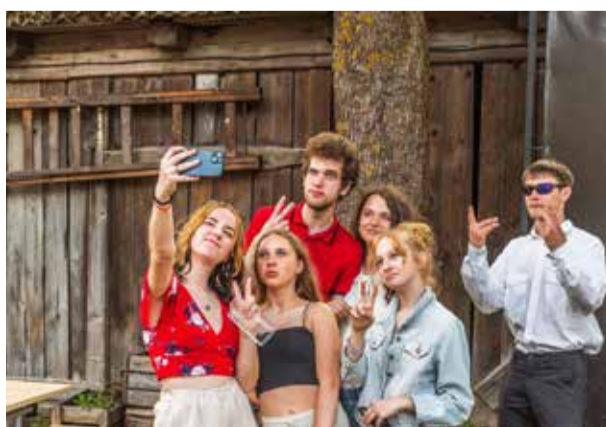
Piesaki gada jaunietī!