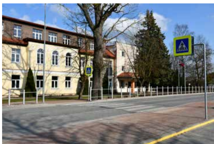
Uzlabojot satiksmes drošību, Jelgavas ielā (pie Indriķa Zeberiņa Kuldīgas pamatskolas) iecerēts pārcelt gājēju pārejū, pazemināt esošo barjeru, izbūvēt pārejas apgaismojumu.

Kuldīgas novadā turpinās nozīmīgu projektu īstenošana, veicinot infrastruktūras un uzņēmējdarbības attīstību – pilsētās un pagastos tiek veikti ielu un ceļu labiekārtošanas darbi, attīstīts tūrisms un nodrošināti veselības veicināšanas pasākumi, kā arī paplašinātas atpūtas un izklaides iespējas, uzlabojot gan novadnieku, gan viesu ērtības un pakalpojumu pieejamību. Kopumā iecerēts īstenot vairāk nekā 15 projektus, galvenokārt ar Eiropas Savienības fondu līdzfinansējumu.