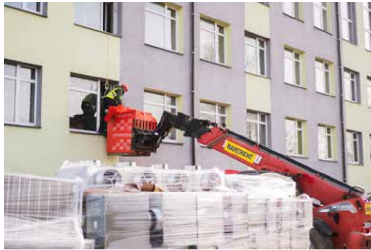
Gaidītas pārmaiņas piedzīvo Skrundas pamatskolas ēka.

Darbi tiek veikti rūpīgi un atbildīgi, lai nodrošinātu gan ēkas ilgmūžību, gan labvēlīgu vidi izglītībai. Tas būs būtisks solis ne tikai skolai, bet arī vietējai kopienai, jo modernizētās