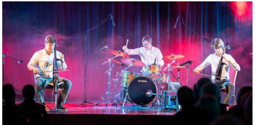
Ar jaudīgu skanējumu Kuldīgas kultūras centrā uzstājās pašmāju eksperimentālā čellu grupa "Chairmen".

Laumas Migovičas teksts un foto, Ievas Benefeldes un Jēkaba Aleksandra Krūmiņa foto