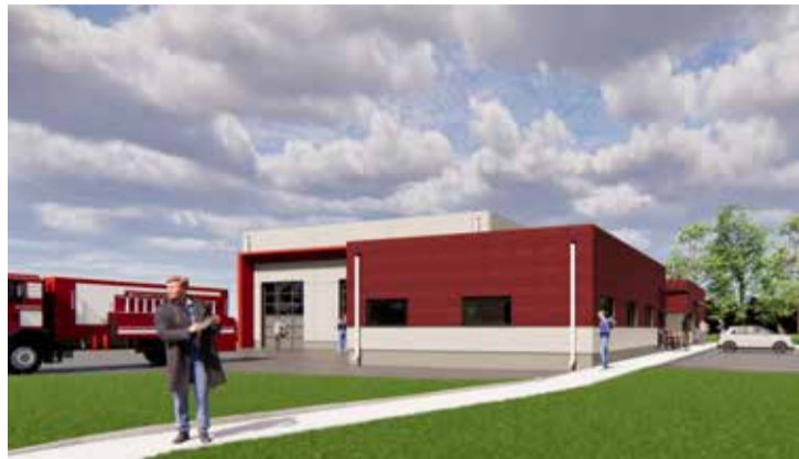
Alsungā, Skolas ielā 24, top jauns, moderns katastrofu pārvaldības centrs.