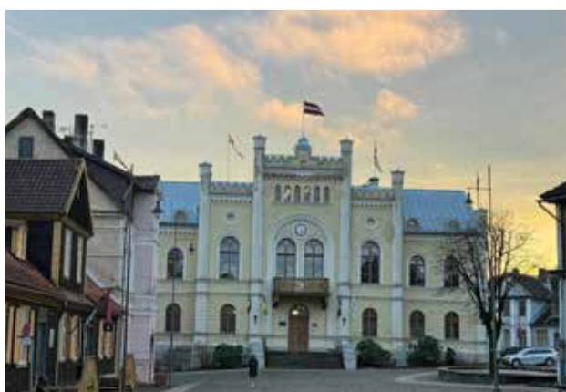
Pieņemts Kuldīgas novada budžets