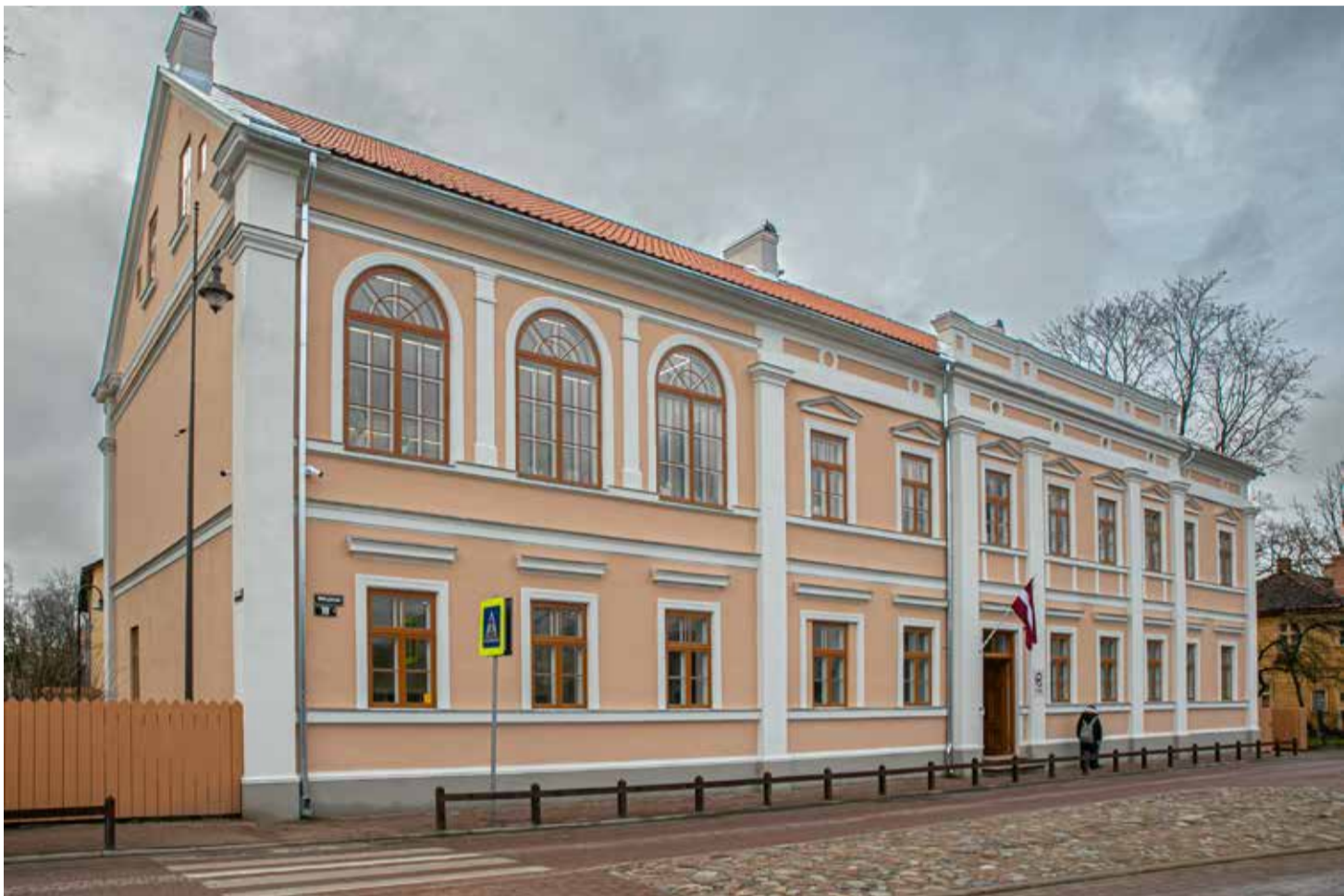
Atjaunotais Kuldīgas novada bērnu un jauniešu centrs 1905. gada iela 10, Kuldīgā.

Centrālā ieeja ēkā saglabāta no 1905. gada ielas puses, bet otra ieeja ēkā izbūvēta jaunajā pagalma piebūvē. Atbilstoši skolas vajadzībām izbūvēts žogs, labiekārtota apkārtējā teritorija un vieta āra mācību nodarbībām. Ēkas iekšpa-