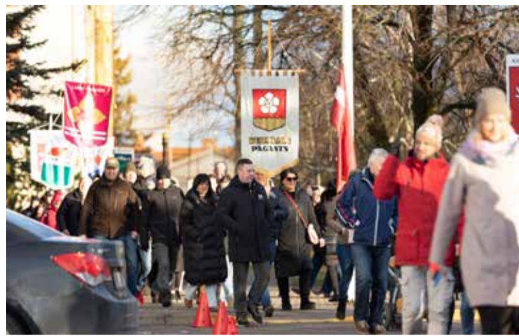
Sacensību svinīgajā atklāšanā pie Kuldīgas vieglatlētikas manēžas sportistu parādes gājieni.