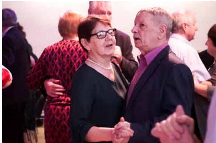
Ap 200 senioru satikās pasākumā “Virpuļo dejā kā pārslas sniegpukenī” Skrundas kultūras namā.

Pasākuma dalībniekus svētku reizē sveica Skrundas pilsētas un pa-