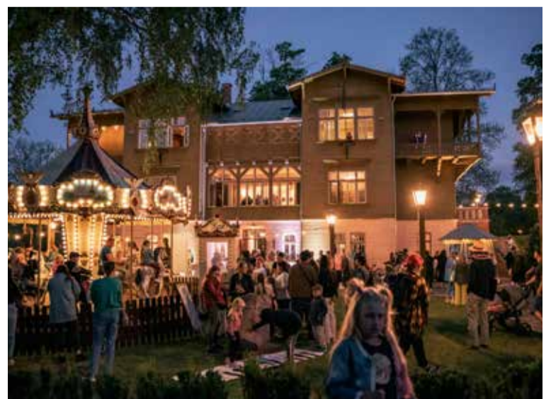
Muzeju nakts pasākums "Nakts atspulgā" 2024. gadā.

Sintija Tovstulaka, Kuldīgas novada muzeja komunikācijas nodaļas vadītāja Lauras Vilertes foto