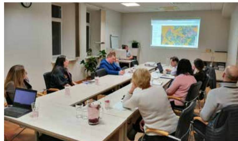
Darba grupas diskusija par “Ķeļu ciema” apkaimes un tai piegulošo teritoriju attīstību.

Atgādinām, ka joprojām ir iespējams iesniegt ierosinājumus