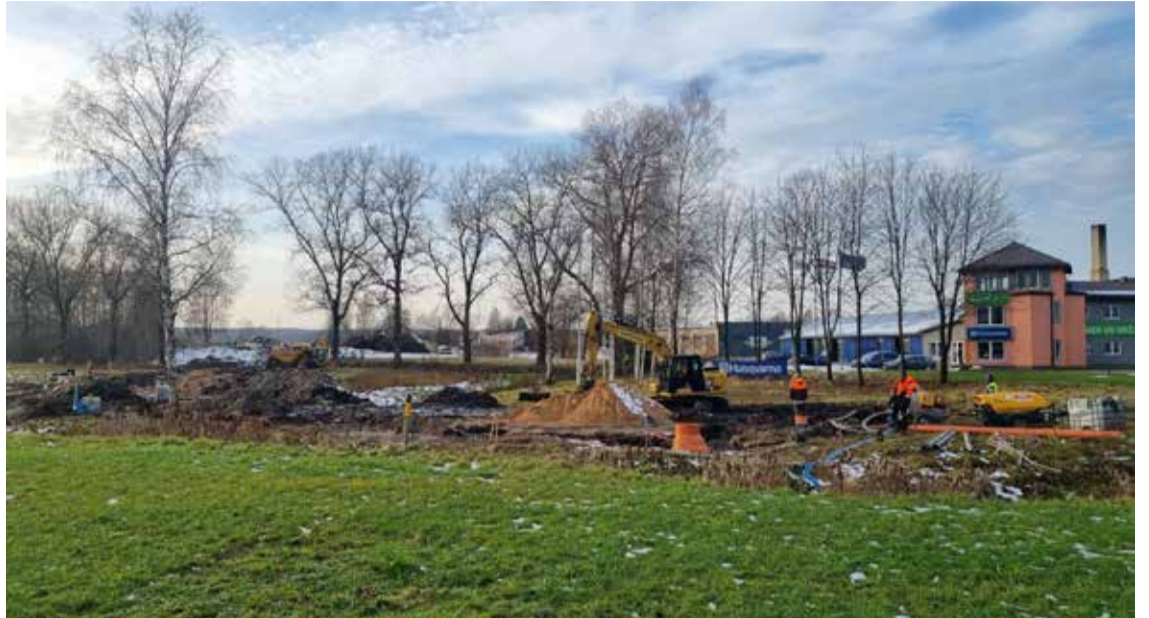
Zirņu un Rudzu ielas izbūve Kuldīgā.