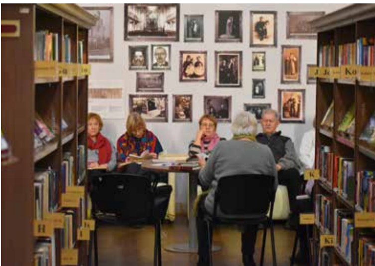
Kuldīgas Galvenā bibliotēka priecājas par plašo lasītāju skaitu un aicina Lasītāju klubam pievienoties jaunus dalībniekus.

Pagājušā gada nogalē kluba dalībnieki veica aptauju par lasīšanas motivāciju, kurā atklājās, ka lasītāji grāmatās meklē gan jaunas zināšanas, gan emocionālu līdzsvaru. Lasīšana palīdz novērst domas no ikdienas rūpēm, iepazīt vēsturi, cilvēku daudzveidību un vienkārši atpūsties. Katrs kluba dalībnieks var izvēlēties grāmatas, kas viņu patiesi interesē, un dalīties ar savām atklāsmēm un pārdomām. Katru