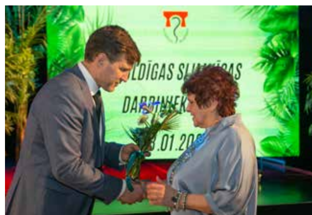
Sveic medicīnas darbiniekus