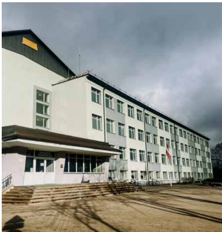
Turpinās Skrundas pamatskolas rekonstrukcijas darbi.

sistēmu Dārza ielas daudzdzīvojamu māju masīvā, Skrundas pamatskolas teritorijā, teritorijā ap Skrundas kultūras namu, O. Kalpaka-Kalēju-Robežu ielās, kā arī Pērkona ielā 2A, Sporta un Liepājas ielā. Pie Ventas upes Skrundā un Raņķos tiks uzstādītas divas pontonu laipas, izveidojot laivošanas maršrutu. Tāpat Skrundas pilsētā plānots izbūvēt apgaismojumu Saldus ielas zaļajā zonā, kā arī atjaunot estrādes tiltiņu. Savukārt Skrundas pagastā tiks īstenoti ceļu remontdarbi.