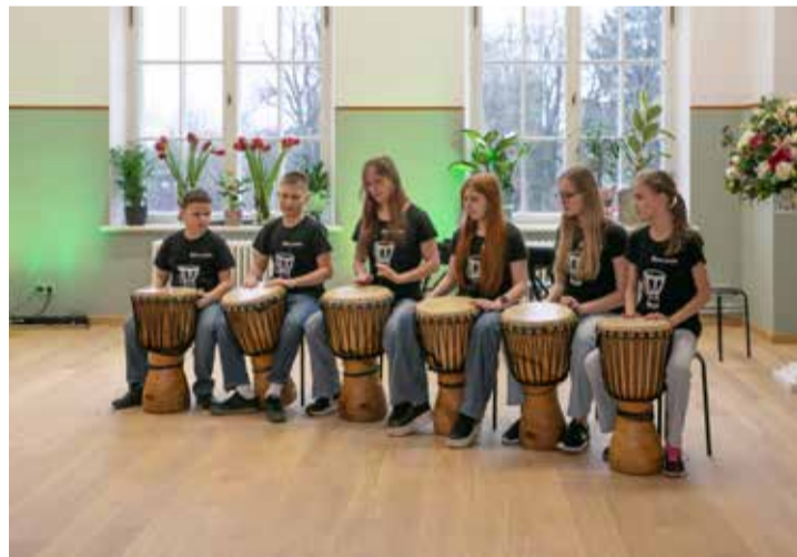
Atklāšanas pasākumā viesus ar muzikālu priekšnesumu sveica Kuldīgas novada bērnu un jauniešu centra ukuleles spēles ansamblis.

galmā ierīkotas trīs autostāvvietas, no kurām viena paredzēta cilvēkiem ar invaliditāti, 20 velosipēdu novietnes, kā arī atpūtas soliņi. Teritorija apzaļumota.