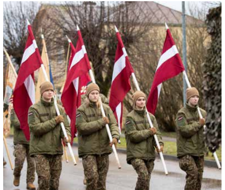
Karoga dienā Skrundā tradicionāli notika gājiens līdz O. Kalpaka piemiņas akmens.

na u.c. Katru gadu kādu elementu pamainām. Šī tradīcija noteikti ir jāturpina, lai jaunieši zina mūsu vēsturi."