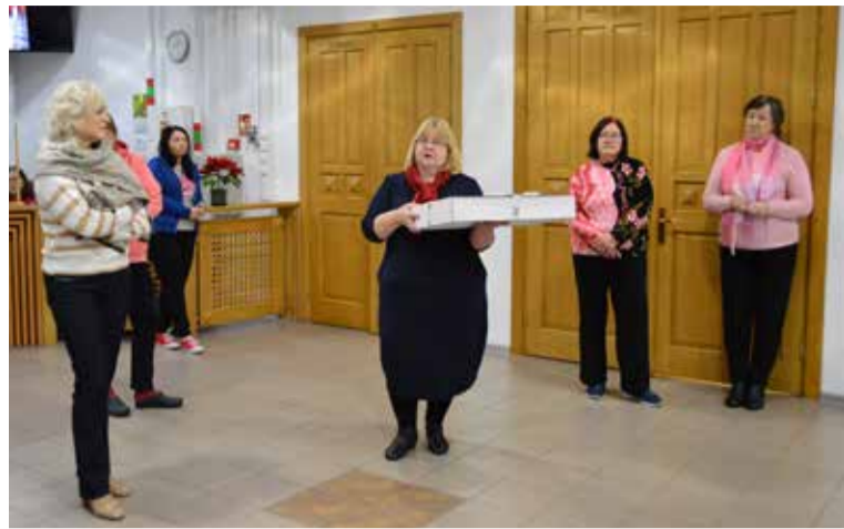
Kuldīgas novada vadība saka paldies Kuldīgas kultūras centra kolektīvam par ikdienas darbu un nerimstošu kultūras dzīves nodrošināšanu.

Šo gadu laikā ēka ir kļuvusi par nozīmīgu kultūras dzīves centru – 2024. gada pirmajā pusgadā bijušas vien 7 dienas, kad tajā nav notikuši mēģinājumi, pasākumi vai kino. Ēkas lielā zāle ar 445 sēdvietām faktiski ir vienīgā vieta Kuldīgas pilsētā, kurā var notikt lielāki kultūras pasākumi – koncerti, izrādes, semināri un korporatīvie pasākumi. Pērn tajā notikuši 135 dažādi maksas un bezmaksas pasākumi, kurus apmeklējuši 25 357 cilvēki, telpas aktīvi izmanto arī pašvaldības iestādes, biedrības un skolas, organizējot tajās koncertus, izlaidumus, skates. Kuldīgas kultū-