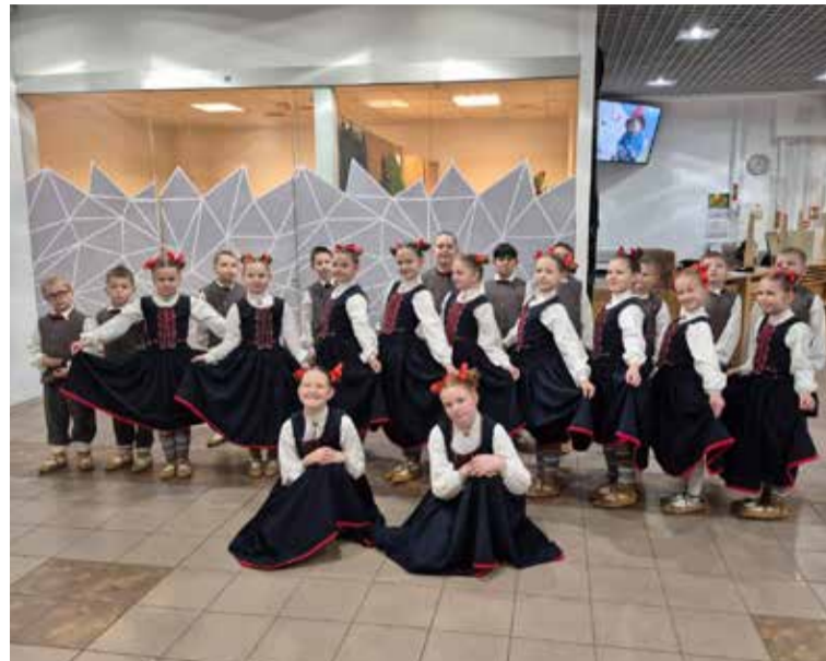
Indriķa Zeberīņa Kuldīgas pamatskolas bērnu deju kolektīva "Kuldīdzēni" 1. - 4. kl. grupa.