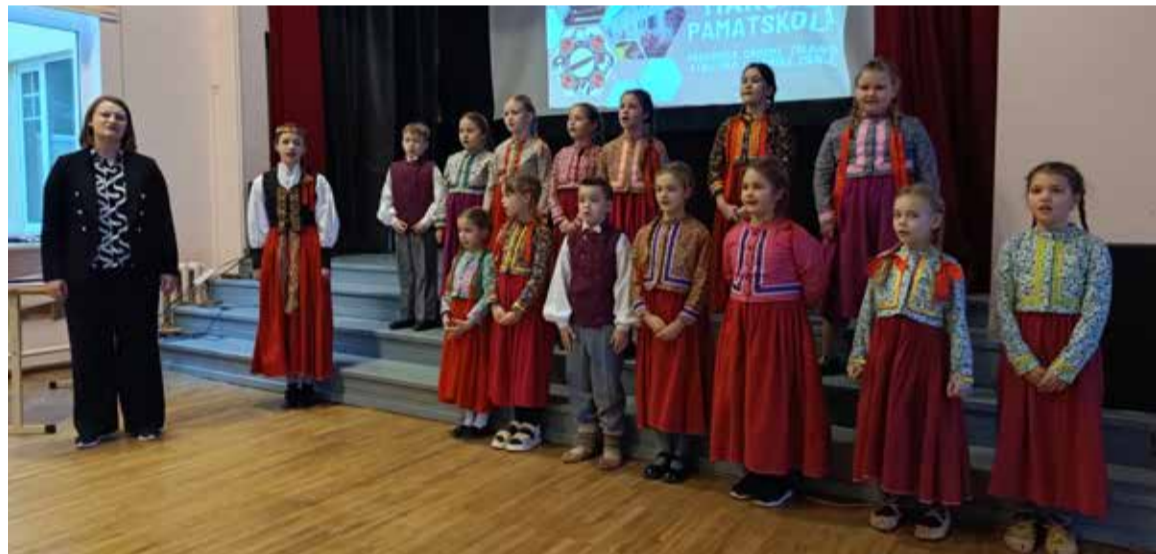
Alsungas Mākslu pamatskolas bērni demonstrē suitu tradicionālo dziedāšanu.

Est-Lat Interreg projektā “Mantojuma ieskausti” no 20. līdz 22. janvārim Alsungā un Kuldīgā notika pieredzes apmaiņas vizīte, kurā piedalījās skolotāji un kultūras mantojuma organizāciju pārstāvji no Setu un Veru apriņķiem Igaunijā, kā arī Ziemeru pamatskolas skolotāji no Alūksnes novada.