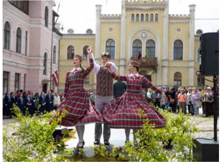
2023. gada 4. maija tautastērpu parāde.