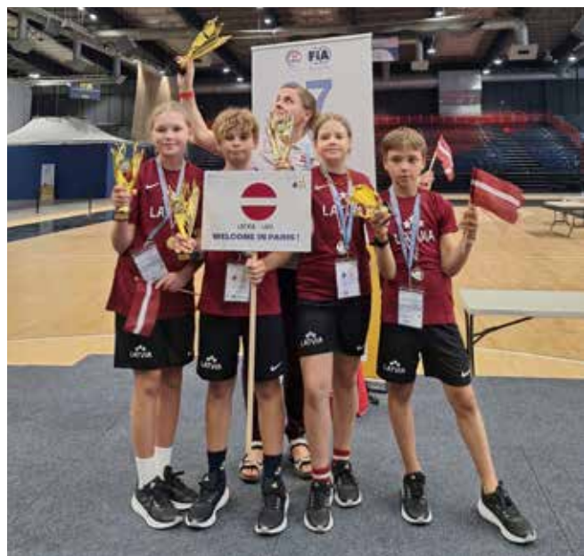
Latvijas jauno satiksmes dalībnieku izlase uzrādīja lieliskus rezultātus visās disciplīnās un izcīnīja zelta godalgas un čempiona titulu.