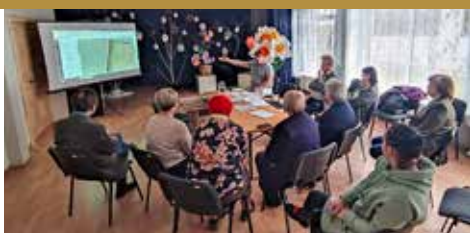
Iesaisties novada teritorijas plānošanā > 4. lpp.