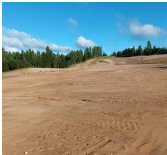
Rekultivētās atradnes "Valsts mežs Ezeri" Rendas pagastā.