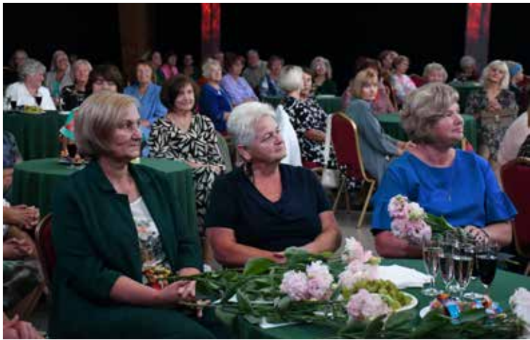
Kuldīgas kultūras centrā sirsnīgā atmosfērā pulcējās novada pensionētie pedagogi.

10. septembrī Kuldīgas kultūras centrā valdīja sirsnīga atmosfēra – šeit uz atkalredzēšanās svētkiem jau 18. gadu pēc kārtas pulcējās Kuldīgas novada pensionētie pedagogi. Šādas tikšanās nu jau ir kļuvušas par ikgadēju mūsu novada tradīciju, kas sirsnīgā gaisotnē ļauj pensionētajiem skolotājiem atkal pabūt kopā, satikt savus kolēģus un dalīties patīkamās atmiņās.