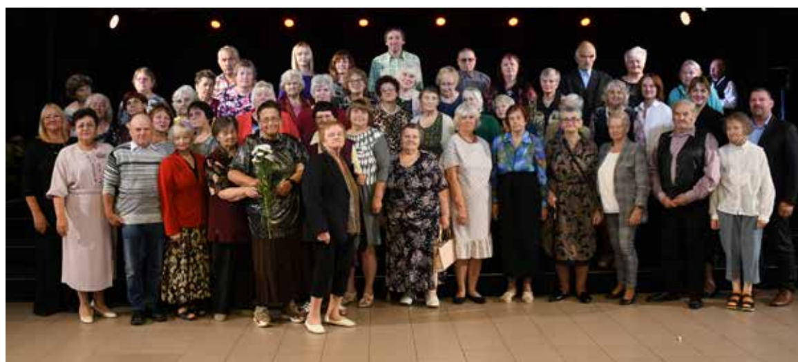
Kuldīgas invalīdu biedrība ar koncertu Kuldīgas kultūras centrā sirsnīgi nosvinējusi 35 gadu jubileju.