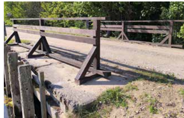
Īvandē veikti Dzirnau – Akmens ceļa tilta koka barjeras atjaunošanas darbi.

Lai uzlabotu iedzīvotāju dzīves kvalitāti, ikdienas pārvietošanās iespējas un drošību, novada pagastos turpinās ceļu infrastruktūras atjaunošana.