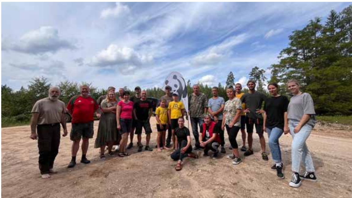
Riežupes tecējuma atjaunošanas pirmās talkas dalībnieki.