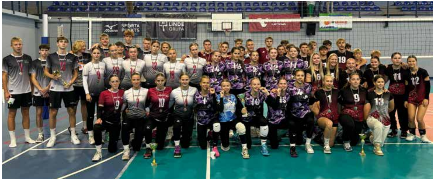
“Kurzemes kauss 2024” U17 grupas uzvarētāju komandas.

Divu dienu garumā, 21. un 22. septembrī, Kuldīgas novada sporta skolas sporta bāzēs norisinājās 59. turnīrs volejbolā “Kurzemes kauss 2024”, kas pulcēja gan lielus, gan mazus volejbolistus no Latvijas un Lietuvas. Šogad turnīrā startēja un par uzvarām cīnījās 50 komandas sešās vecuma grupās.