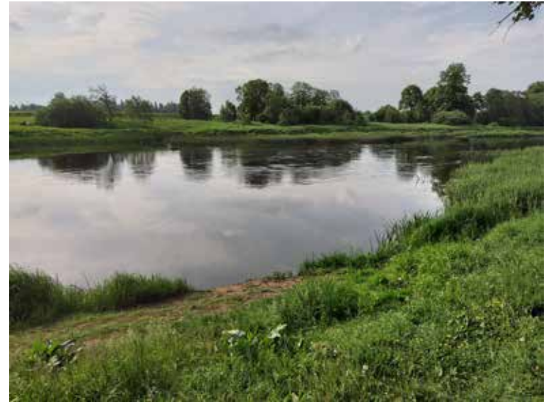
Projektā arī Raņķos Ventā tiks uzstādīta pontona laipa.

inovāciju risinājumus un pieejamības uzlabojumus ūdenstūrisma aktivitātēm. Lai arī Kuldīgas novadā ūdenstūrisma padarītu pieejamāku, pie Ventas upes Skrundā un Raņķos tiks uzstādītas divas pontonu laipas, izveidojot laivošanas maršrutu aptuveni 16 km garumā. Viena no tām būs multifunkcionāla, lai to varētu izmantot peldēšanai, laivošanai, makšķerēšanai, vides izglītībai, kā