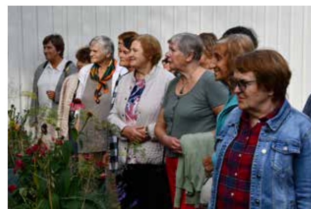
Vizītes noslēgumā ekskursijas dalībnieki apmeklēja sociālo pakalpojumu centru “Tilts” Kuldīgā.