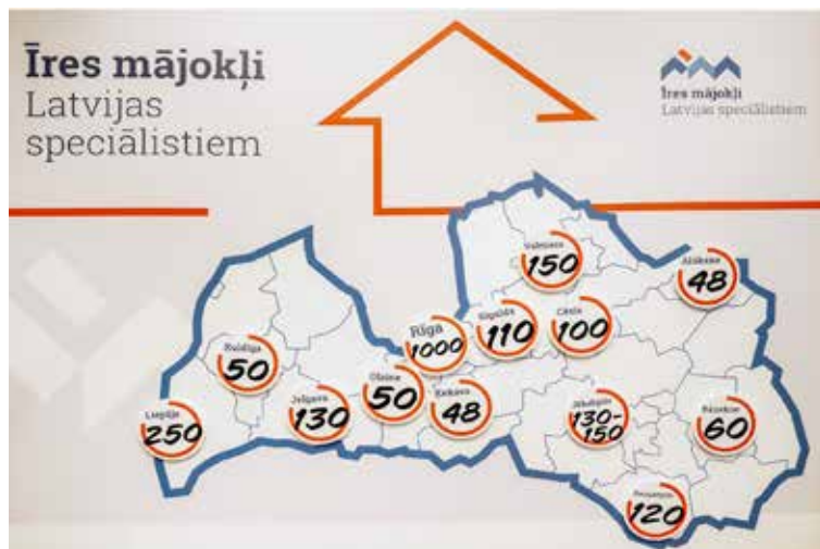
Programma paredz vismaz 1000, bet ne vairāk kā 2266 īres mājokļu izbūvi visā Latvijā.

ielas, komunikācijas, skolas, bērnudārzus, citus objektus. Kuldīgas novads ir lieliska vieta dzīvošanai, mācībām, darbam un atpūtai. Piemērota dzīvesvieta ir svarīgs priekšnoteikums,