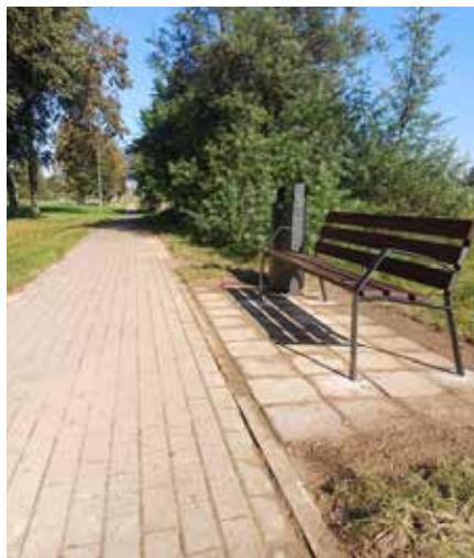
Jaunie soliņi Skrundā, Kuldīgas un Raiņa ielā.