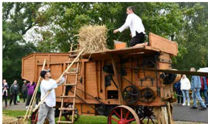
Pasākumā ikvienam bija iespēja iepazīt senos amatus un piedalīties dažādās meistarklasēs, iepirkties gadatirgū un baudīt muzikālus priekšnesumus.