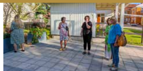
Īstenoti daudzveidīgi projekti > 11. lpp.