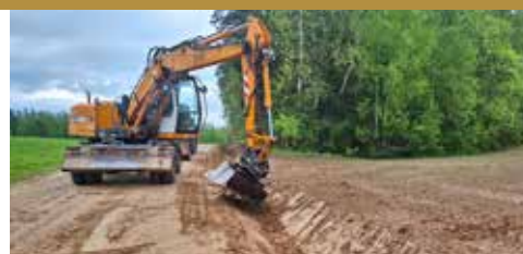
Lauku ceļu remontdarbi pagastos > 5. lpp.