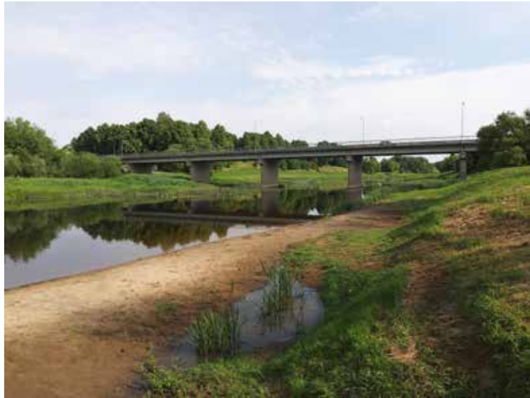
Lai arī Kuldīgas novadā ūdenstūrisma padarītu pieejamāku, Ventas upē Skrundā un Raņķos tiks uzstādītas divas pontonu laipas, izveidojot laivošanas maršrutu aptuveni 16 km garumā.

Mūsdienās strauji mazinās vispārpieņemtais uzskats, ka ūdenstūrisms galvenokārt ir paredzēts tikai