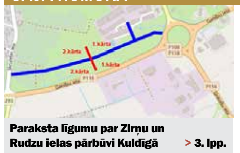
Paraksta līgumu par Zirņu un Rudzu ielas pārbūvi Kuldīgā > 3. lpp.