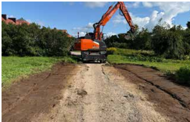
Dārza ielas remontdarbi Nīkrācē.