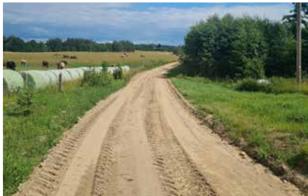
Uzvesta grants un laboti iesēdumi ceļa posmā Ķirškalni – Mazreģi Alsungā.