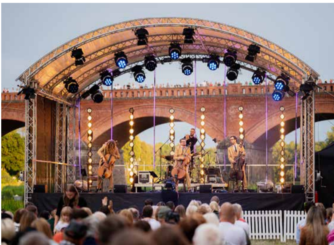
Kuldīgas Vecpilsētas svētkos grupu “Sudden Lights” un “Melo-M” koncertus bija iespēja baudīt īpaši skaistā vietā – ķieģeļu tilta pakājē. “Ventas skatuves” koncertus iedzīvotājiem dāvināja pašvaldība sadarbībā ar uzņēmējiem – SIA “Laimdotas” un SIA “Palleteries” pārstāvēto zīmolu “Top granulas”.

“Svinam Kuldīgu!” – ar šādu moto Kuldīga šogad aicināja uz Vecpilsētas svētkiem. Tie bija pirmie pilsētas svētki kopš Kuldīgas vecpilsētas iekļaušanas UNESCO Pasaules mantojuma sarakstā, tāpēc svinēti ar lielu lepnumu. Pateicībā par iedzīvotāju rūpēm par savām mājām un apkārtējo vidi, cieņu pret vēsturi un visam pāri – ārkārtīgu mīlestību pret savu pilsētu, kuras vērtība nu atzīta pasaules mērogā.