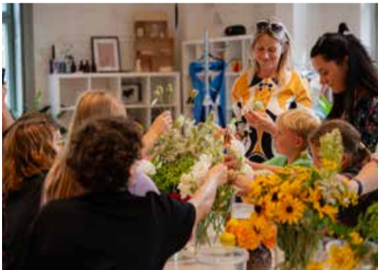
Latvijas Investīciju un attīstības aģentūras Kuldīgas pārstāvniecība parūpējusi par aizraujošu svētku programmu, aicinot uz vietējo uzņēmēju iedvesmas stāstiem un praktiskām meistarklasēm.