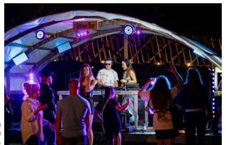
Tornā skatuve, kas atradās blakus jaunajam skatu tornim, Vecpilsētas svētkos pulcēja jauniešu iemīļotos mūziķus un dīdžejus.