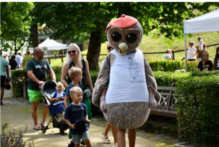
Ar vairāk nekā 20 radošām darbnīcām par koku un meža tēmu pašus mazākos Vecpilsētas svētku svinētājus priecēja "Zaļā pasaka senā pilsētā." Aktivitātes bērniem dāvināja SIA "Mežinieks RS", meža īpašnieku biedrība "Meža konsultants" un "Meža ABC" sadarbības partneri. Pasākuma atbalstītājs – Meža attīstības fonds.