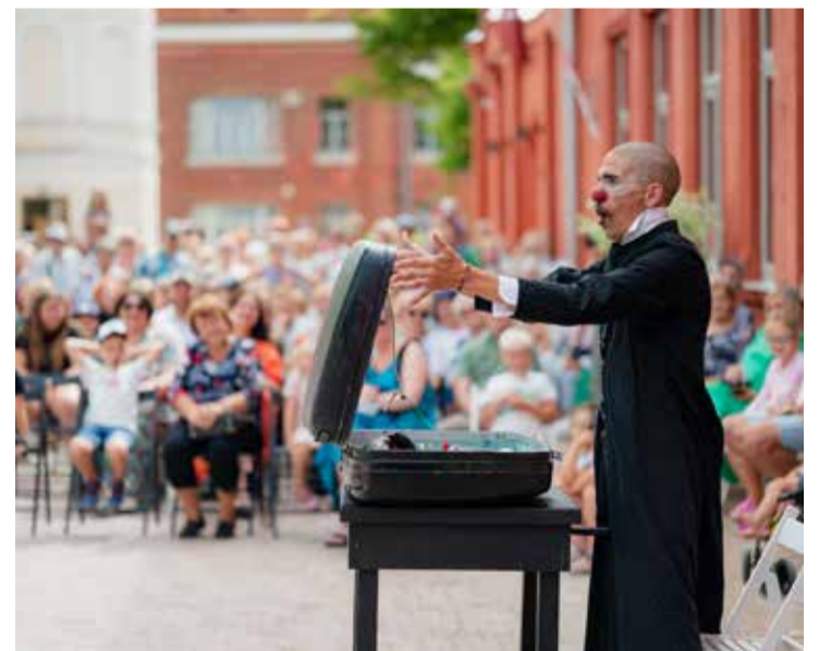
Kuldīdzniekus un pilsētas viesus priecē Rīgas cirks ar klaunādes izrādi "Pachamamo".