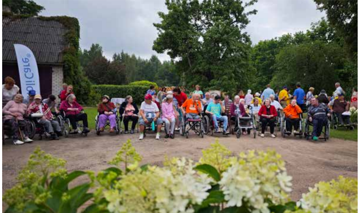
Aprūpes namā "Valtaiķi" uz sadraudzības sporta spēlēm pulcējās aptuveni 70 ilgstošas sociālās aprūpes un sociālās rehabilitācijas pakalpojuma saņēmēji no Kuldīgas, Talsu, Saldus un Dienvidkurzemes novadu sociālās aprūpes iestādēm.

Finansējums sporta spēļu norisei tika piesaistīts ciešā sadarbībā ar biedrībām "Šēra" un "Ventas krasti",