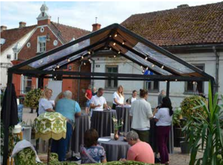
Kā uzlabot gājēju ērtības un drošību? Vai Kuldīgai pietāv lieliekalī? Par šiem un citiem jautājumiem pašvaldības vadība svētkos aicināja iedzīvotājus uz sarunu neformālā gaisotnē.