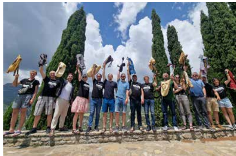
Erasmus+ programmas sadarbības partnerību projekta “Eiropas dūdenieku sadarbības tīkls” dalībnieku tikšanās Spānijā.

riem no Gruzijas un Spānijas), organizētas suitu danču meistarklases Rīgas Danču kluba vadībā un kopas “Suitu dūdenieki” 10 gadu jubilejas pasākums, t.sk., mūzikas albuma prezentācija. Projekta finansējums 5000 EUR.