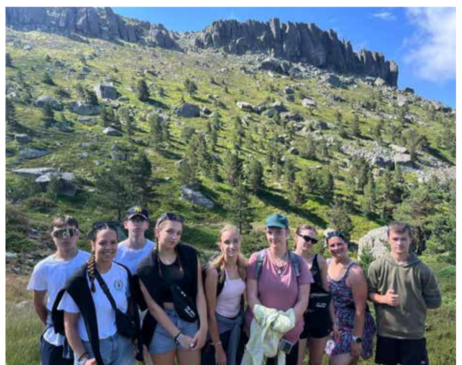
Latviešu komandas dalībnieku pārgājiens pa kalnu takām.