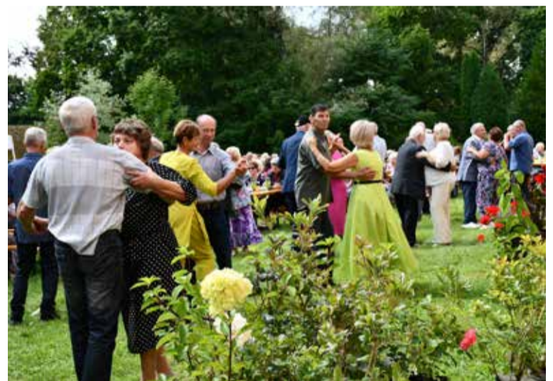
Svētkos seniorus iepriecināja krāšņs koncerts un lustīgas dejas.

kopējā bagātība, jūsu stāsti ir mūsu vēsture. Šodien mēs godinām jūsu dzīves gudrību un zināšanas, kas ir nenovērtējams ieguldījums mūsu kopienas attīstībā. Baudīsim šo dienu un dalīsimies atmiņās, kas ir mūsu pagātne un iedvesma nākotnē. Lai