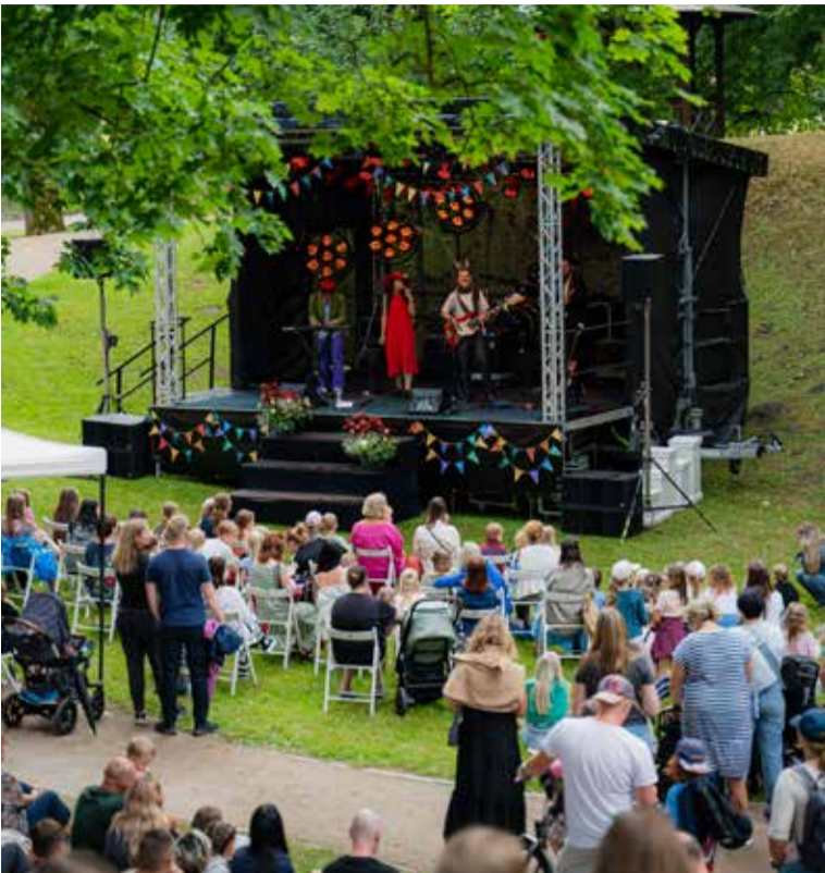
Pilsētas dārzā "Stiga RM" novada bērniem dāvināja bagātīgu kultūras programmu – koncertus, radošo pasaku darbnīcu, burtu spēli, zinātnes teātri, cirka un iluzionista priekšnesumus.