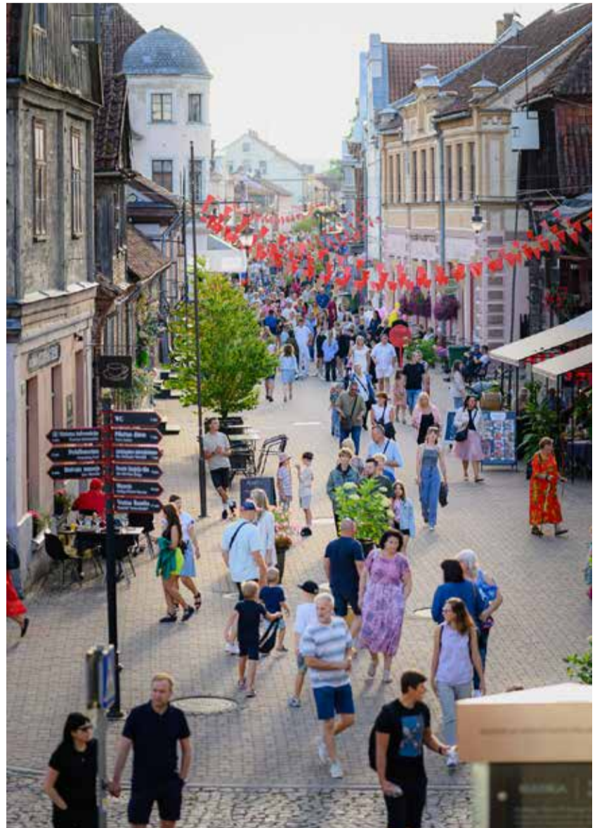
Liepājas iela kļuva par satikšanās un iedvesmas vietu – šeit darbojās dažādas pop up kafejnīcas.

Pašu kuldīdznieku radīti, svētki tika pavadīti ar kolosālām emocijām, ļaužu piepildītām ieliņām un pagalmiem, patīkamu satikšanos, tirgotāju kņadu, neaizmirstamu mūziku, laikmetīgās dejas un cirka priekšnesumiem, iespēju piedalīties dārzā svētkos, restaurācijas darbnīcās, veidot lielformāta gleznu un līdzdarboties mākslas performancēs, izzināt seno amatu prasmes un doties ekskursijās pa vecpilsētu.