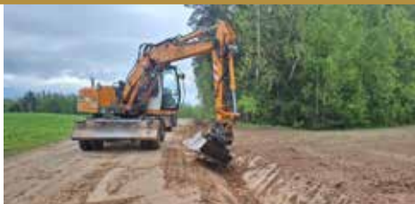
Uzlabo ceļus pagastos > 5. lpp.