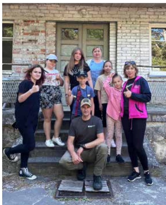
Kuldīgā dzīvojošie ukraiņu bērni un vecāki, kuri devās līdzīgi uz vasaras nometni Pāvilstā.

Palīdzot ukraiņu bērniem interesantākā veidā apgūt latviešu valodu un saturīgi pavadīt brīvo laiku, paralēli iepazīstot latviešu tradīcijas, norisinājušās vairākas nometnes.