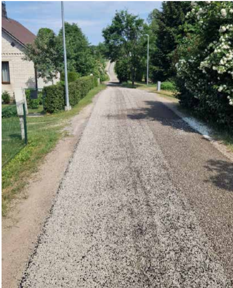
Alsungā Liepu ielai uzklāta dubultā virsma.

Ceļu uzturēšanas un remonta darbi veikti arī Laidu pagastā. Grants seguma remonts noticis ceļa posmiem Sermīte-Irbenieki, Baižas-Jaunās mājas, Kalēji-Biezaiši,