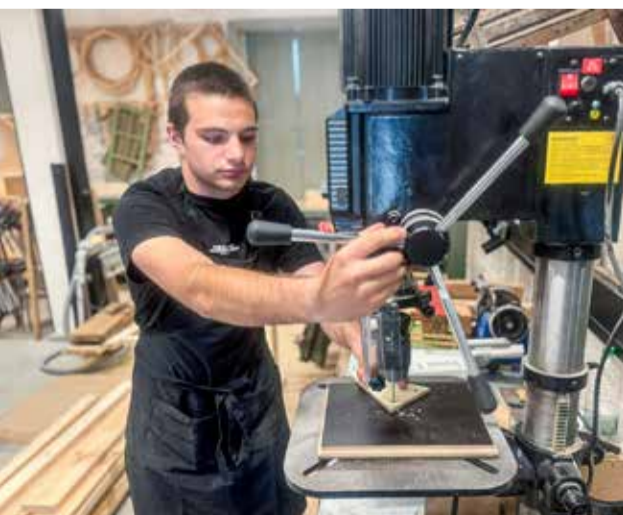
Adatu fabrikas kokapstrādes darbnīcā top svētku dekori – koka karodziņi.