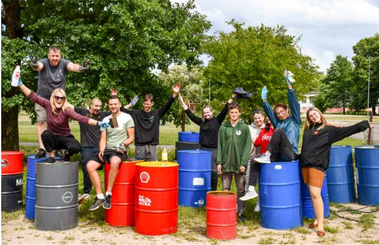
Kuldīdznieki pošas Vecpilsētas svētkiem un vienotības kopīgā talkā.

iedvesmas stāstiem un meistarklasēm. Savukārt Bārs "Didro" aicinās uz 18. gadsimta sarunām, kur satiksies dzejnieki, filozofi, mūziķi un ekonomisti, lai runātu par mūžam jauno tēmu – mūsu mantojumu.