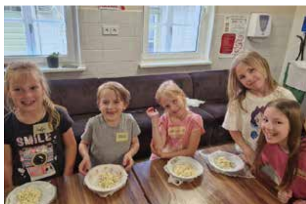
Nometnē ukraiņu bērniem bija iespēja pašiem pagatavot Jāņu sieru.

4. jūnijā Kuldīgas novadā dzīvojošie ukraiņu bērni devās labdarības organizācijas “Tabitas sirds” rīkotajā un Sabiedrības integrācijas fonda (SIF) finansētajā vasaras nometnē