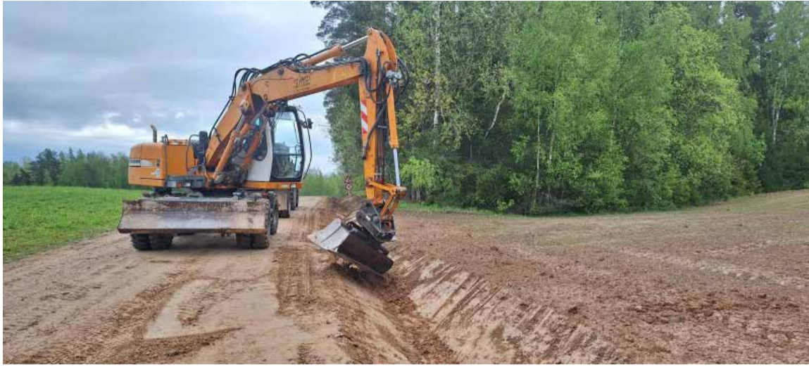
Turlavā tiek veikta grants ceļu apauguma noņemšana un grāvju rakšana.