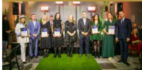
Pasaki paldies uzņēmējiem – “Uzņēmēju gada balva 2024” > 3. lpp.