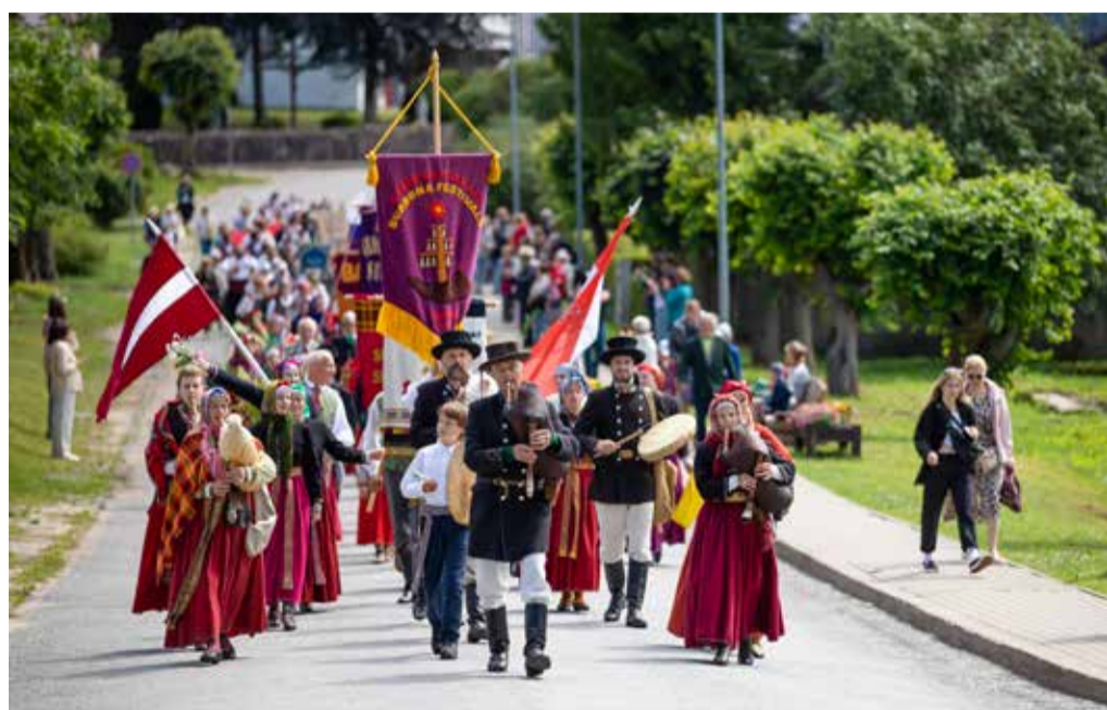
6. starptautiskā burdona festivāla svētku gājiens.