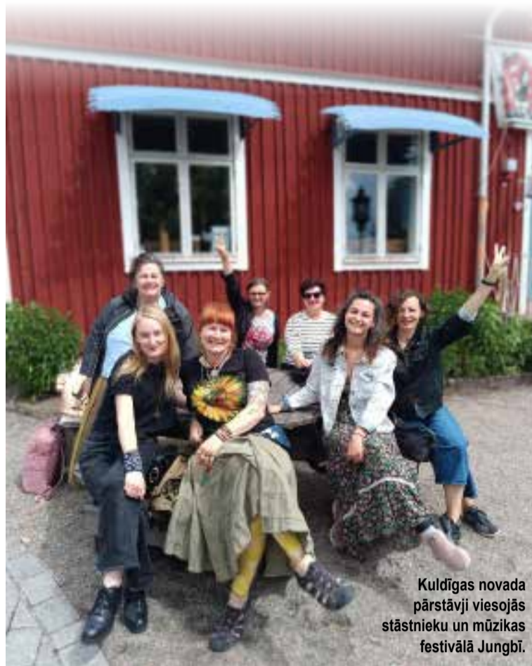
Kuldīgas novada pārstāvji viesojās stāstnieku un mūzikas festivālā Jungbī.

Eiropas Savienības finansēts. Paustie viedokļi un uzskati atspoguļo autora(-u) personīgos uzskatus un ne vienmēr sakrīt ar Eiropas Savienības vai Eiropas Izglītības un kultūras izpildāģentūras (EACEA) viedokli. Ne Eiropas Savienība, ne EACEA nenes atbildību par paustajiem uzskatiem.