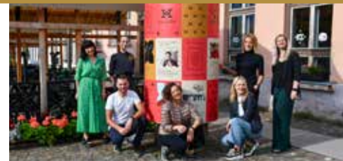
Kuldīga gatavojas Vecpilsētas svētkiem > 8.-9. lpp.