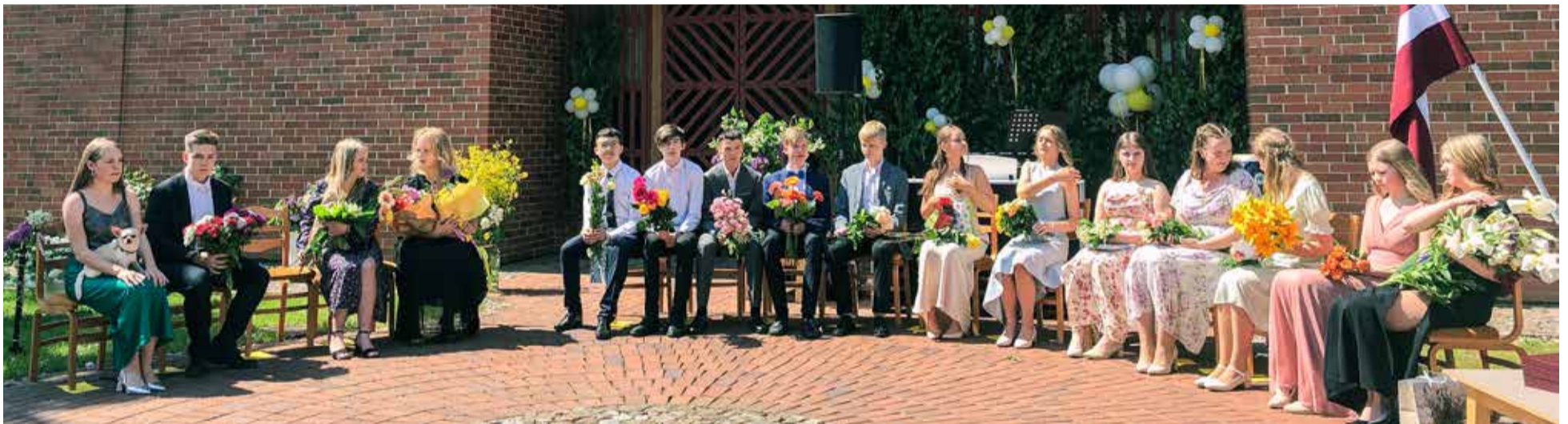
E. Vīgnera Kuldīgas mūzikas skolā nosvinēts skolas 72. izlaidums.