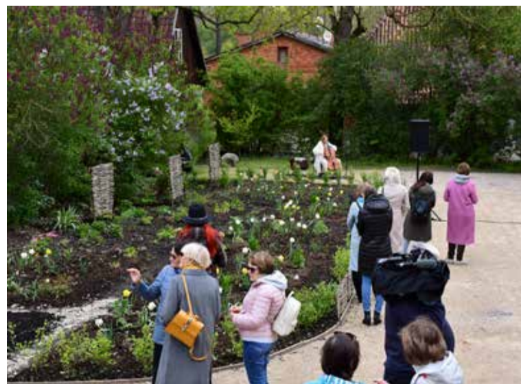
Vecpilsētas dārza atklāšanas svētki Kuldīgas Restaurācijas centra pagalmā.

Priekšdārziņu uzturēšanas tradīcijas vecpilsētā atdzīvināt palīdzējusi