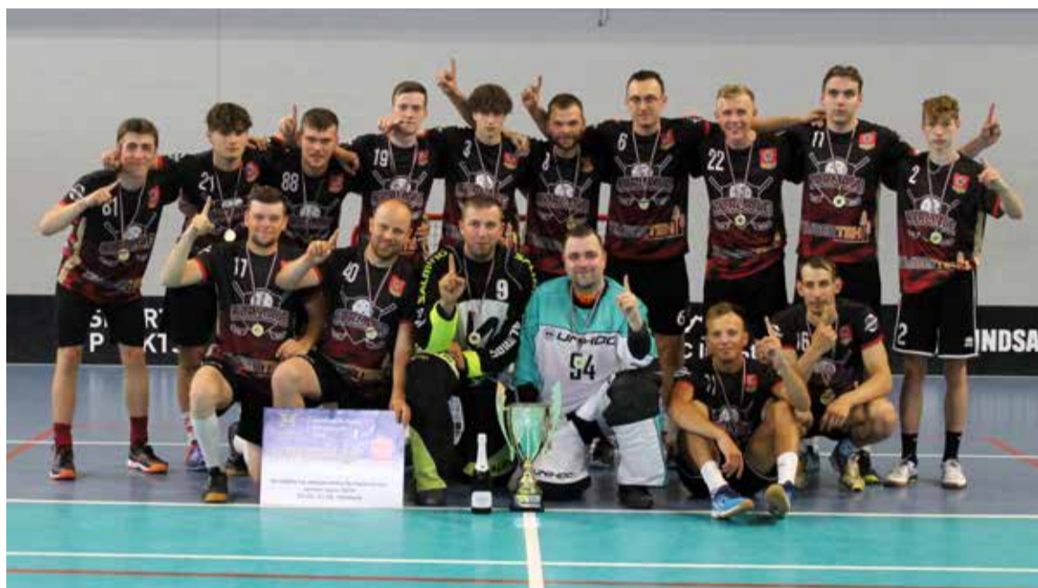
Kuldīgas novada florbola čempionāta uzvarētāji – komanda "Kurmāle".