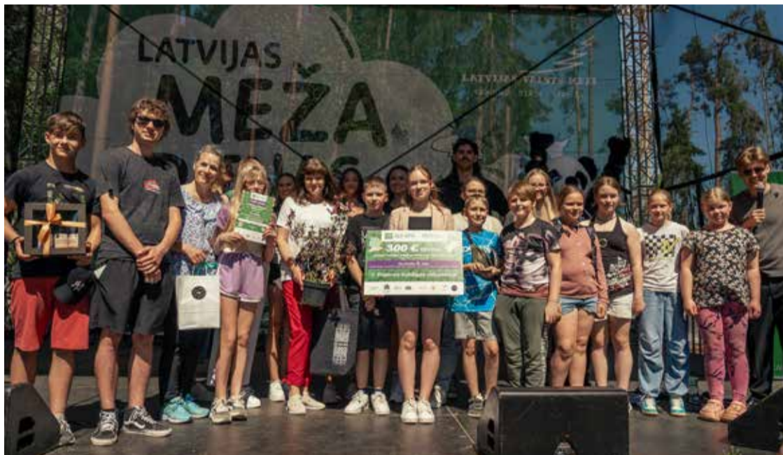
Latvijas Meža dienās V. Plūdoņa Kuldīgas vidusskola saņēma 300 EUR par savu ieguldījumu vides saglabāšanā.

V. Plūdoņa Kuldīgas vidusskola ieguvusi 2. vietu SIA “Zaļā josta” rīkotajā izlietoto bateriju vākšanas konkursā “Tīrai Latvijai”, savācot 1288,4 kg bateriju. Šis panākums apliecina skolas apņemšanos veicināt vides aizsardzību un ilgtspējīgu attīstību.