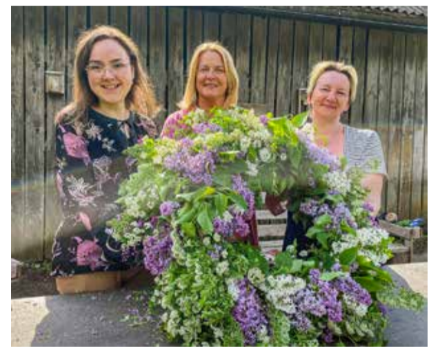
Lēnu pils sētā Ventas vārda dienai par godu tika pīts vainags, kuru palaida pa straumi upē, pēcāk pils dārzā kopīgi tika spēlētas lielformāta spēles.