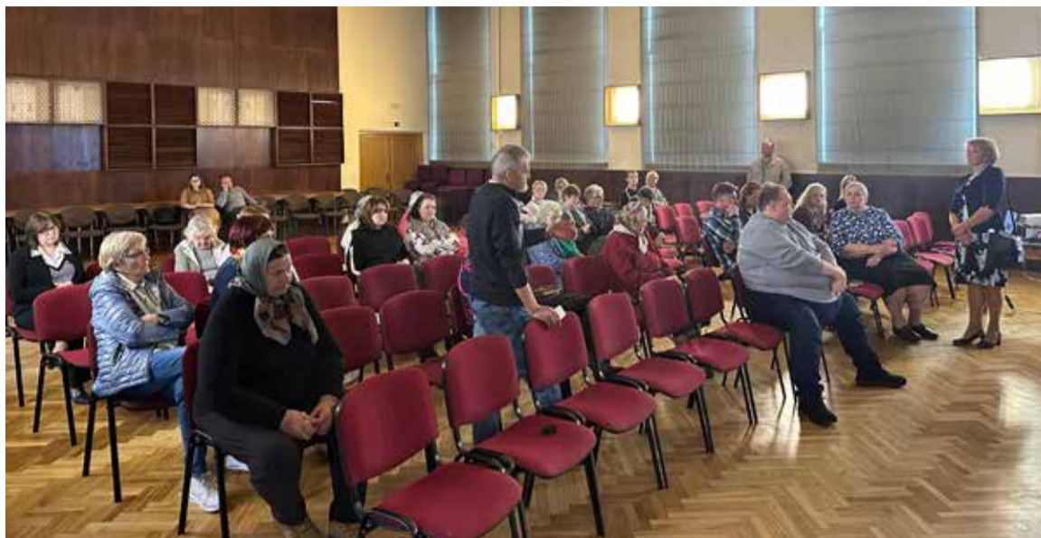
Ēdoles pagasta iedzīvotāji pārrunāja vēja parku attīstību un pagasta pārvaldes darbību.