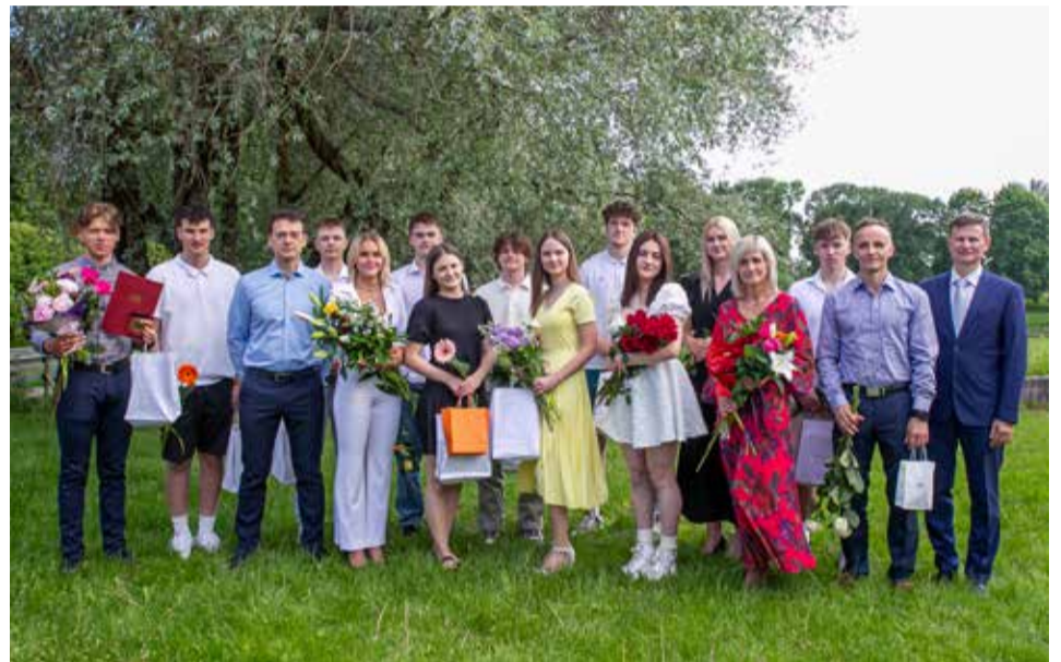
Kuldīgas novada sporta skolas V30 (vidusskolas) grupas absolventi kopā ar treneriem.