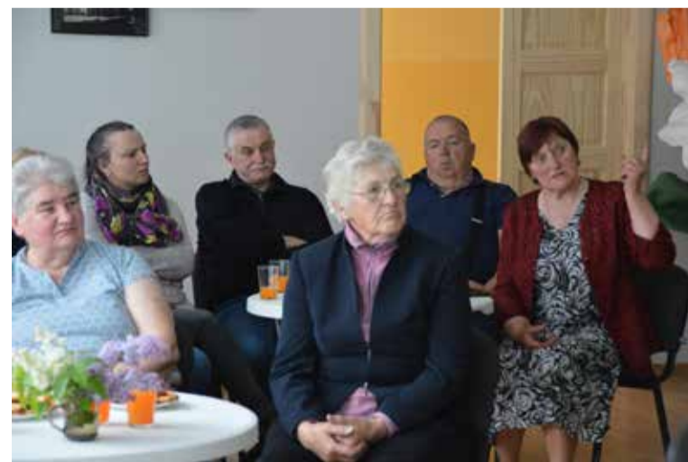
Raņķu pagasta sapulcē runāja par atkritumu nodošanas iespējām, jauna autobusa maršruta izveidi, gaidāmajiem pasākumiem un iedzīvotāju iesaisti pagasta izaugsmē.

Šī gada ieceres – dubultā seguma uzlikšana un Smilgu ceļa rekonstrukcija viena kilometra garumā. Ar konkursa “Darīsim paši!” atbalstu notiks Sudmalnieku birzs atjaunošanas darbi. 3. augustā būs nakts noskaņu koncerts “Sapņu atspulgs Ventas ūdens lāsē”.