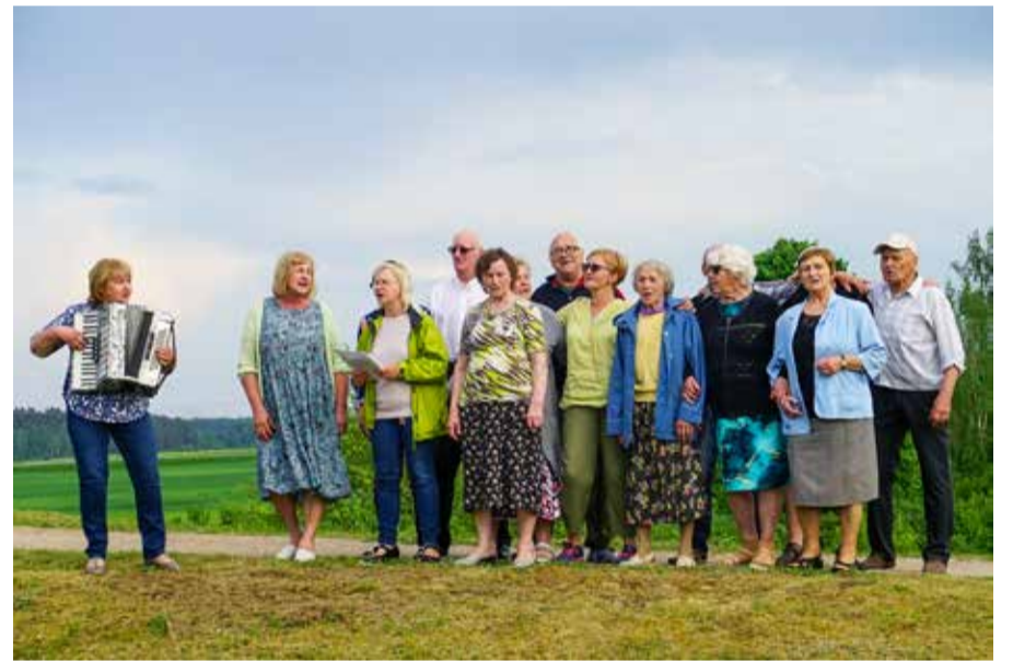
Skrundā pie baskāju takas piknika apmeklētājus ar dziesmām priecēja jauktais senioru koris "Skrunda".

20. maijā, kad vārda dienu svin Venta, ikviens Kuldīgas novada iedzīvotājs tika aicināts piedalīties zibakcijā – piknikā upes krastā.