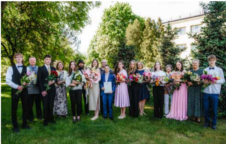
Skrundas mūzikas skolas absolventi 2023./2024. mācību gadā.