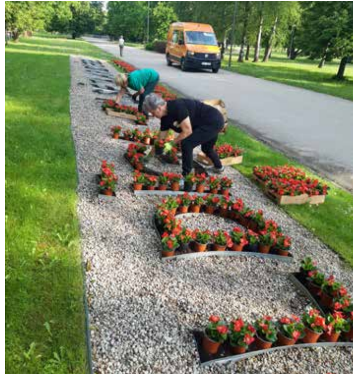
SIA “Kuldīgas komunālie pakalpojumi” zaļumsaimniecības daļas darbinieki pilsētas estrādes dobēs stāda ziedus, kas priecēs kuldīdzniekus un viesus visu vasaru.