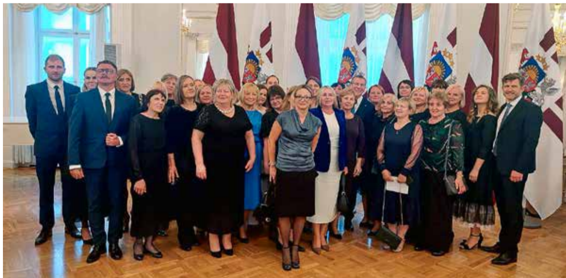
Kuldīgas slimnīcas māsas un māsu palīgi viesojas Rīgas pilī svētku koncertā un tiekas ar Latvijas Valsts prezidentu Edgaru Rinkēviču.

Šī gada 4. maijā uz Rīgas pili devās kups skaits Kuldīgas slimnīcas māsu, kuras saņēma ielūgumu uz svētku koncertu no Latvijas Valsts prezidenta Edgara Rinkēviča. Savukārt 12. maijs bija Starptautiskā māsu diena, kurā sveicienus profesionālajos svētkos saņēma ne tikai māsas, bet arī māsu palīgi.