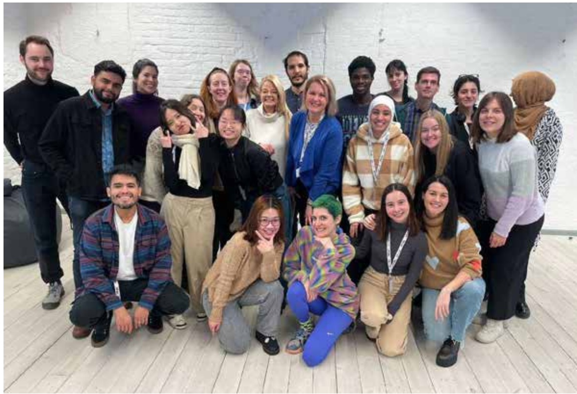
Starptautiskās maģistra līmeņa studiju programmas "Pakalpojumu dizaina stratēģijas un inovācijas" studenti mācību procesā.