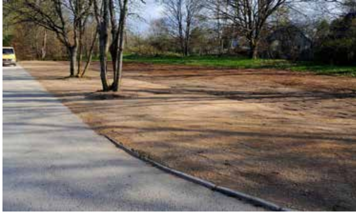
Izveidotas papildus 32 vietas transportlīdzekļu novietošanai pie Kuldīgas skatu torņa.

Tāpat izmaiņas tiek veiktas Krasta ielā virzienā no Vecā tilta brauktuves labajā malā un Stendes ielā virzienā no Vecā tilta kreisajā malā, kur tiks uzstādītas apstāšanās aizlieguma ceļa zīmes (Nr. 326). Šobrīd automašīnas nereti tiek pavirši novietotas abās ielas malās, radot bīstamas situācijas, kā arī kavējot iespēju vietējiem iedzīvotājiem piekļūt savam īpašumam.