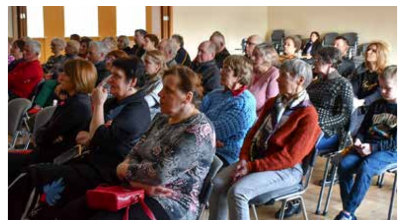
Alsungas iedzīvotāji sapulcē pārrunā iespēju komunālos pakalpojumus saņemt no pašvaldības iestādēm.