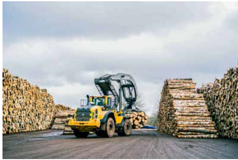
Bērza saplākšņa rūpnīca "Stiga RM" Kuldīgā.

Uzlabojot un automatizējot ražošanas procesus, tiek nodrošināti arī