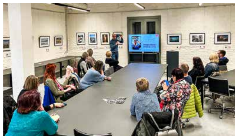
Kuldīgas Digitālo inovāciju centrā pašvaldības darbiniekiem tika organizētas apmācības, kā pielietot ikdienas darbā mākslīgo intelektu.

Aicinām jūs pievienoties mūsu iniciatīvai un izprast mākslīgā intelekta potenciālu. KDIC ir atvērts visiem, kuri vēlas uzlabot savas prasmes un paplašināt zināšanas, lai nākotnē strādātu gudrāk un efektīvāk. Tā ir iespēja ne tikai ietaupīt resursus, bet arī radīt jaunas iespējas ikvienam, kurš gatavs mācīties un augt kopā ar mums. Mākslīgais intelekts ir šeit, lai palīdzētu jums skatīties uz pasauli plašāk. Un Kuldīga ir vieta, kur šīs zināšanas top dzīvesveids.