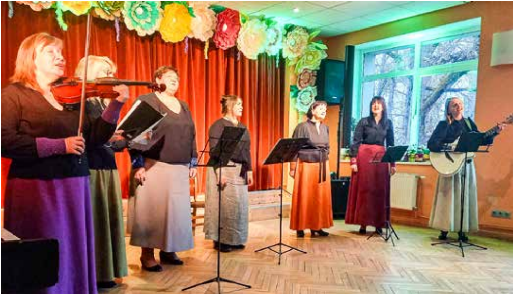
Padures vokāli instrumentālais ansamblis "Harmonija".