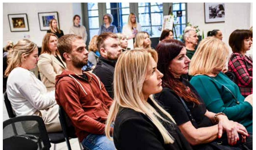
Uzņēmēji tika iepazīstināti ar aktualitātēm novadā, digitalizācijas un inovāciju iespējām, krīzes komunikāciju un pārmaiņu vadību uzņēmumu ikdienā, kā arī atbalsta programmām saimnieciskās darbības veicējiem.

Dalībniekiem bija iespēja iepazīties ar atbalsta programmām un finansējuma iespējām digitalizācijas procesu ieviešanai, kā arī uz klausīt