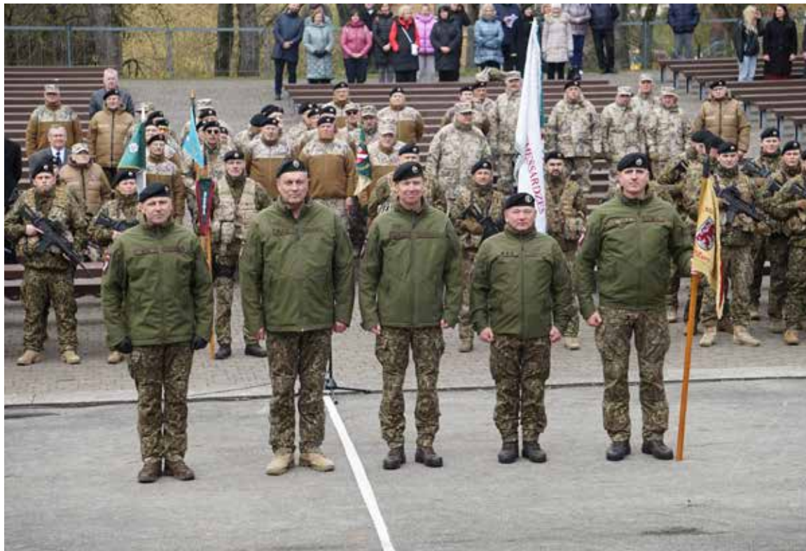
Komandieru maiņas pasākumā piedalījās sadarbības partneri un aicinātie viesi, kā arī Zemessardzes 4. Kurzemes brigādes vienības un militārā tehnika.