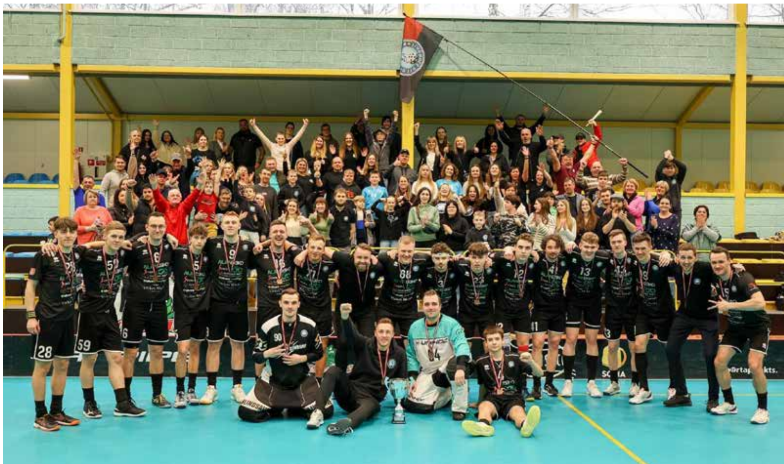
Florbola klubs "Kuldīga NSS/Linde Grupa" ar faniem Lielvārdē pēc izcīnītās bronzas medaļas.

Savukārt 2. līgas komanda "FK Vārme" par bronzu cīnījās ar "Rēzekne/BTA". Cīņu par 2. līgas bronzu veiksmīgāk sāka rēzeknieši, kas pirmā perioda laikā ieguva vērā ņemamu pārsvaru – 3:0. Taču tālāk spēle turpinājās par labu vārmeniekiem, kas otrās trešdaļas pirmajā minūtē pretinieku pārsvaru samazināja līdz minimumam – 2:3. Spēles 51. minūtē rezultāts bija jau – 5:5. Dažas neveiksmes, un rēzekniešiem ar četrus sekunžu intervālu izdevās