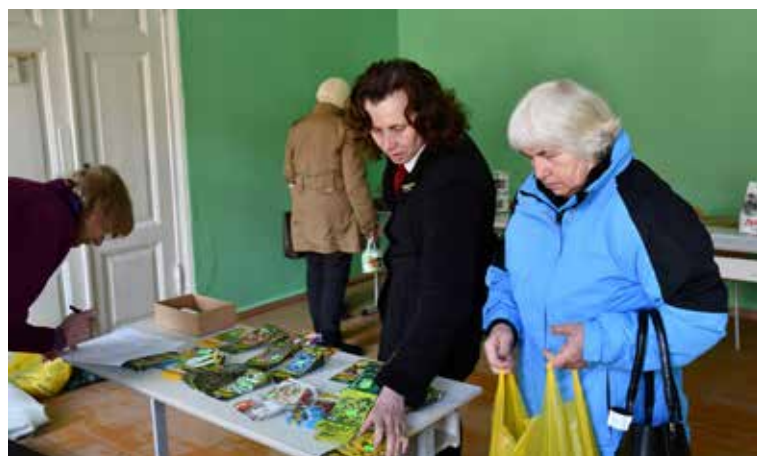
Seniori labprāt izmanto iespēju saņemt dārza kopšanai nepieciešamo, lai papildinātu savu saimes galdam.

Ruta Orlova, biedrības “Kuldīgas senioru skola” vadītāja