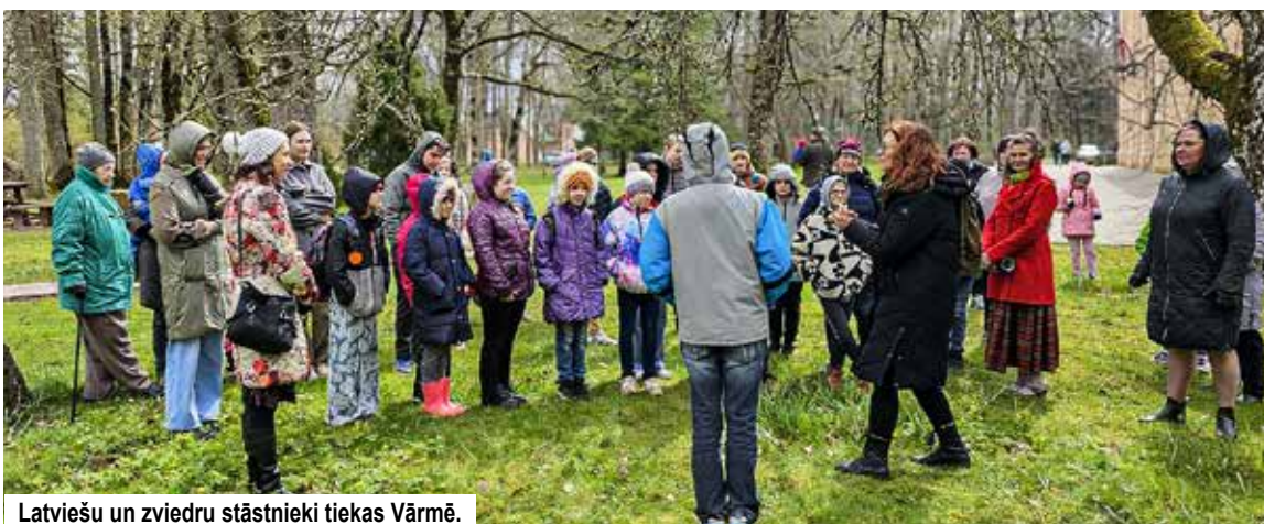
Latviešu un zviedru stāstnieki tiek Vārmē.

Aprīļa beigās Kuldīgas novadā notika stāstnieku festivāls "Ziv zup", kurā satikās labākie Latvijas stāstnieki un kolēģi no Zviedrijas stāstnieku organizācijas "The Land of Legends".