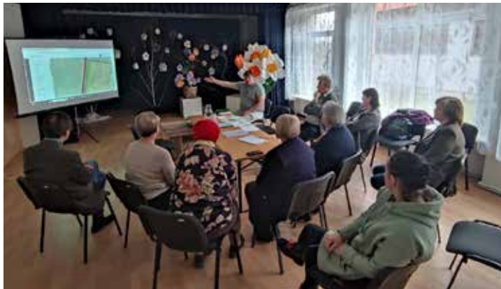
20. martā notika noslēdzošā darba grupas sanāksme Raņķos.

Tajās tika diskutēti par spēkā esošo teritorijas plānojumu nosacījumiem un ierobežojumiem pilsētā, ciematos un lauku teritorijās esošo zemes vienību izmantošanai un attīstībai. Aktuālākās diskusiju tēmas iedzīvotājiem bija ražošanas teritoriju novietojums ciematos, ar tūrisma jomu saistītā apbūve, uzņēmējdarbības attīstība, kā arī novada teritorijā plānotie vēja elektrosta-