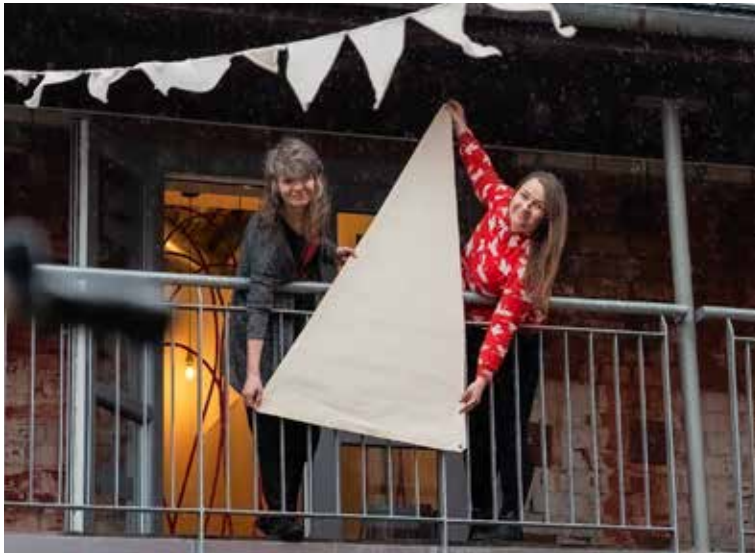
9. maijā tiek organizēta buru akcija, kurā aicināts iesaistīties ikviens. Kopumā izgatavotas 100 buras, kas kalpos kā simboliska piederības zīme Eiropas kultūras galvaspilsētai 2027. gadā.

9. maijā, Eiropas dienā, plkst. 18.00 ikviens aicināts pacelt šīs buras, tā apliecinot, ka ir daļa no Eiropas kultūras galvaspilsētas procesa. Šajā laikā aicinām buru apdarinātājus Liepājā, Dienvidkur-