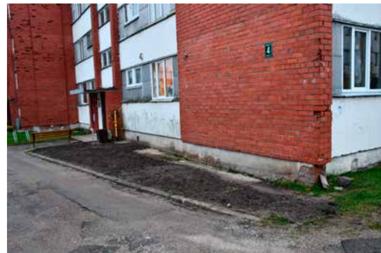
Rudbāržu pagasta daudzdzīvokļu dzīvojamajā mājā Jubilejas ielā 4 veikti notekūdeņu sistēmas un lietuvu ūdens novadīšanas sistēmas remontdarbi.

Darbus veica SIA "Skrundas komunālā saimniecība". Kopējās izmaksas 3500 EUR.