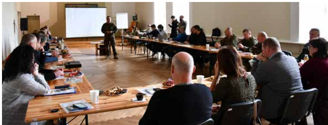
Skrudas kultūras nama telpās norisinājās Zemessardzes 4. Kurzemes brigādes 45. kaujas nodrošinājuma bataljona organizētas Civiltās aizsardzības komisijas pārstāvju mācības.

Lektori no Aizsardzības ministrijas, Nacionālo bruņoto spēku apvienotā štāba un Valsts ugunsdzēsības un glābšanas dienesta sniedza