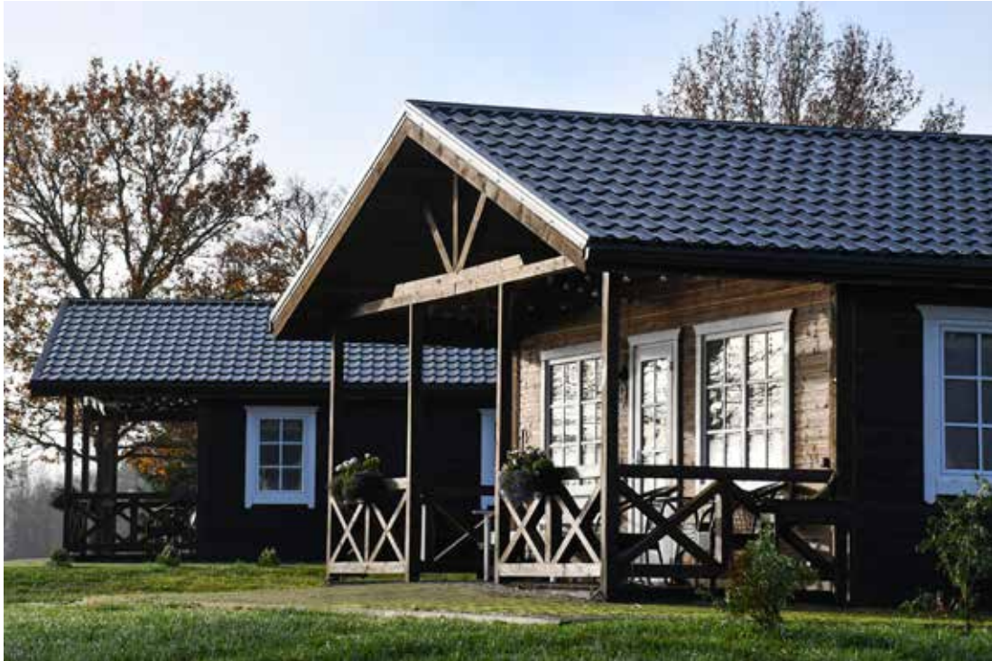
"Ezermaļos" ir vairākas viesu mājiņas un vieta telšu celšanai Zvirgzdu ezera krastā.

Konkursa "Kuldīgas novada uzņēmēju un amatnieku gada balva 2022" žūrija sākusī apciemot konkursam pieteiktos uzņēmējus un amatniekus, lai popularizētu un iepazītu viņu darbu.