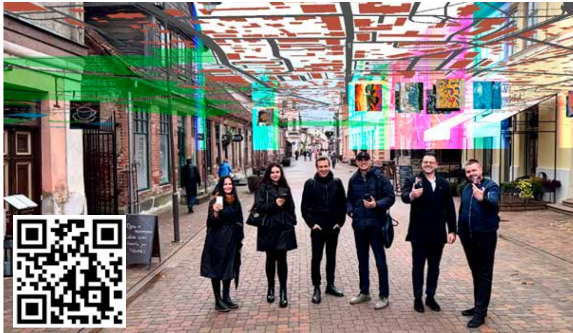
Fotofiksācija no paplašinātās realitātes mobilās lietotnes SAN ar dažādu jomu digitālās vides atbalsītājiem. Lietotnē ietverta virtuāla Kuldīgas karte ar 22 brīvdabas mākslas galerijas sienu gleznojumiem.