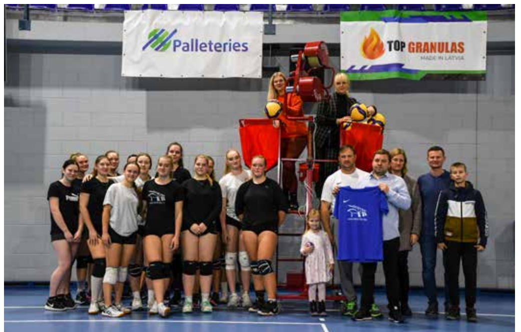
Kuldīgas novada sporta skolai jauna serves mašīna, kuru palīdzēja iegādāties uzņēmums SIA "Palleteries".