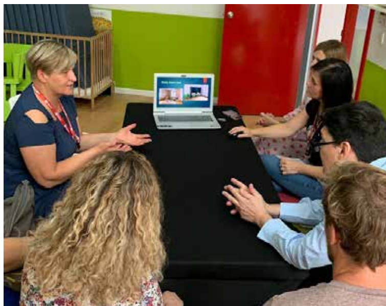
Ciemojoties bilingvālajā bērnudārzā Quinta Avenida.

ros posmos: pirmsskolas izglītība, pamatizglītība, obligātā vidējā izglītība un vidējā izglītība (bakalaura grāds).