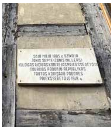
Kuldīgā, Baznīcas ielā 10 atrodas piemiņas plāksne Taurijas Padomju Republikas Tautas komisāru padomes priekšsēdētājam Jānim Šeptem.

latviešu valodā (Liepājas iela 31, Kuldīga);