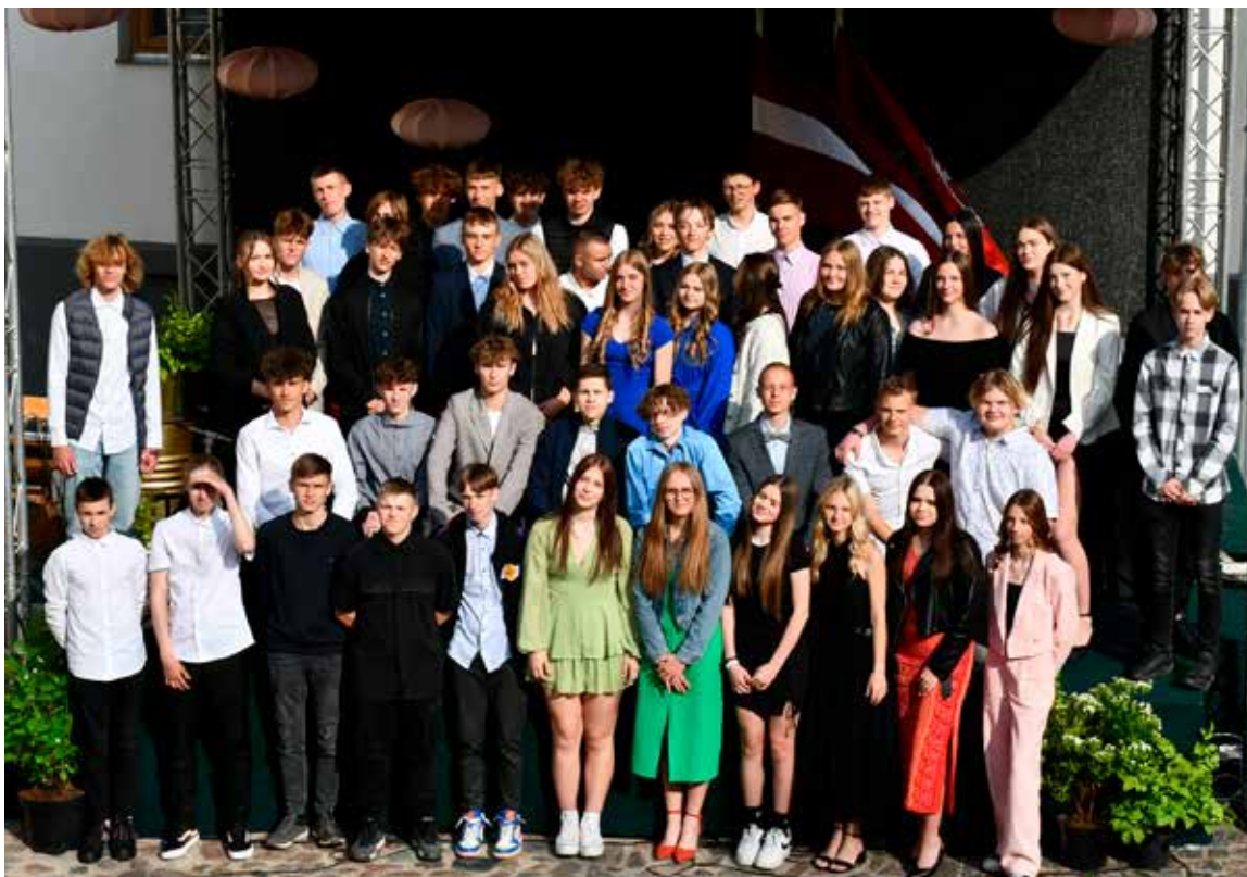
Kuldīgas novada sporta skolas izlaidumā V20 (pamatskolas) grupā apliecības saņēma 58 jaunie sportisti septiņos sporta veidos.