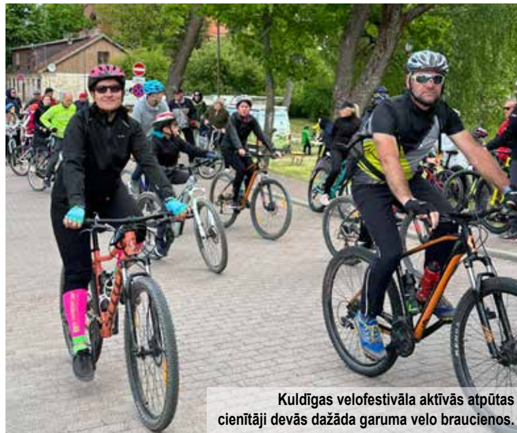
Kuldīgas velofestivāla aktīvās atpūtas cienītāji devās dažāda garuma velo braucienos.