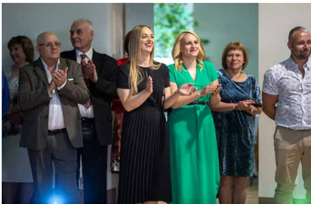
Zāles atklāšanā klāt bija arī skolas skolotāji, skolēni un absolventi.