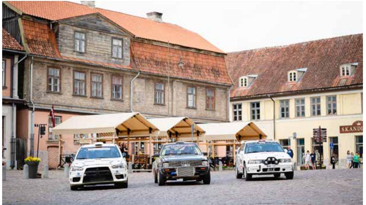
Gatavojoties FIA Eiropas rallija čempionāta posmam “Tet Rally Liepāja”, maija izskaņā Kuldīgā tika filmēts īpašs video sveiciens rallija dalībniekiem un skatītājiem.

Tet Rally Liepāja apmeklētājiem atgādina, ka rallija norišu vērošanai būs nepieciešama aproce, ar kuru varēsiet piekļūt izveidotajiem skatpunktiem. Šādu aproci, uzrādot ieejas biļeti, varēsiet saņemt Tet Rally Liepāja biļešu maiņas punktos, kuri būs izvietoti netālu no ātrumposmu norises vietām. Precīza informācija par biļešu maiņas punktu atrašanās vietām un to darba laikiem tiks precizēta neilgi pirms FIA Eiropas rallija čempionāta Latvijas posma norises Tet Rally mājaslapā, kā arī sociālajos tīklos.