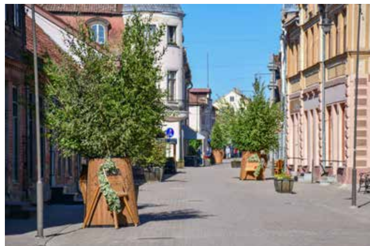
Liepājas ielā tiks novietoti jau tradicionālie alus kausi ar bērzu meijām, kas šogad būs papildināti ar līgo dziesmu ilustrācijām.

ANDA MENDRIĶE, Kuldīgas novada vides dizainere