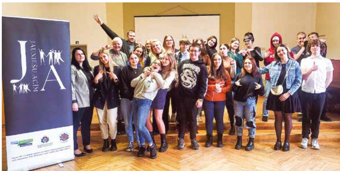
Kuldīgas novada jaunieši piedalās diskusijā “Dzīve jauniešu acīm” Skrundā.