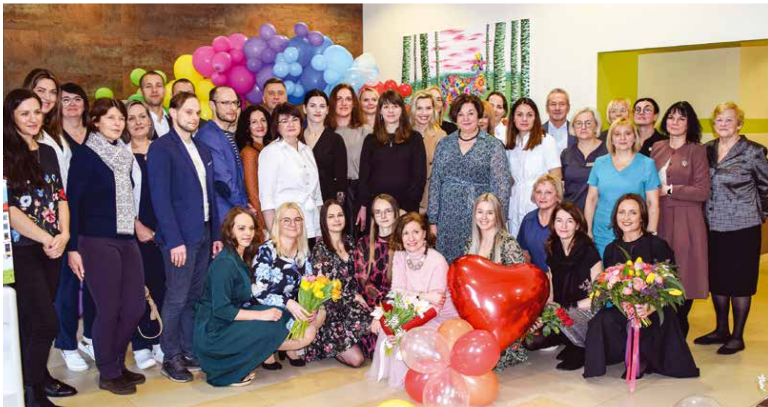
Kuldīgas slimnīcas rehabilitācijas nodaļas desmitā gada diena tika atzīmēta kopā ar nodaļas sākotnējiem veidotājiem, slimnīcas vadību un kolēģiem.

Pacientiem pieejamas fizikālās medicīnas un rehabilitācijas ārsta konsultācijas, fizioterapeita, ergoterapeita, audiologopēda konsultā-