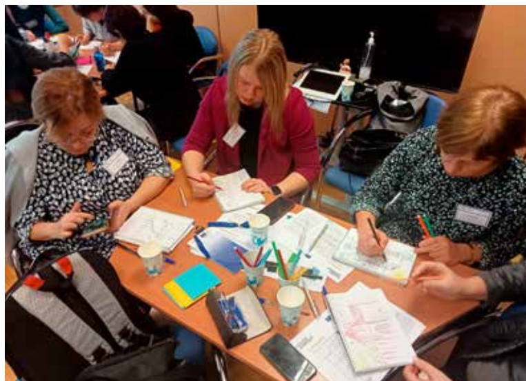
Indriķa Zeberīņa Kuldīgas pamatskolas skolotājas piedalījās Erasmus+ projekta INCLUDL SCHOOLS otrajā seminārā Madridē.

No 23. līdz 27. janvārim pieci pedagogi no Indriķa Zeberīņa Kuldīgas pamatskolas devās uz Madridi un piedalījās Erasmus+ projekta INCLUDL SCHOOLS otrajā seminārā, kurā projekta koordinatori – nevalstiskā organizācija COCEMFE (Confederacion Espanola de Personas con Discapacidad Fisica y Organica) - iepazīstināja un apmācīja dalībniekus lietot divas iekļaujošas izglītības mācību metodes – UDL (Universal Design of Learning) un SL (Service Learning).