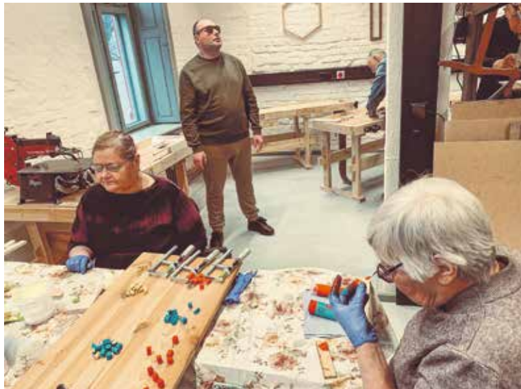
Latvijas Neredzīgo biedrības rehabilitācijas centra Jūrmalas filiāles biedri kokapstrādes darbnīcā izgatavojuši savu prototipu galda spēlei “Rīču-raču”.

Adatu fabrikas kokapstrādes darbnīcā savu prototipu galda spēlei “Rīču-raču” izveidojuši Latvijas Neredzīgo biedrības rehabilitācijas centra (LNB) Jūrmalas filiāles biedri. Populārā galda spēle pielāgota, lai to varētu spēlēt vājredzīgi un neredzīgi cilvēki. Arī viss veidošanas process nodots pašu neredzīgo rokās.