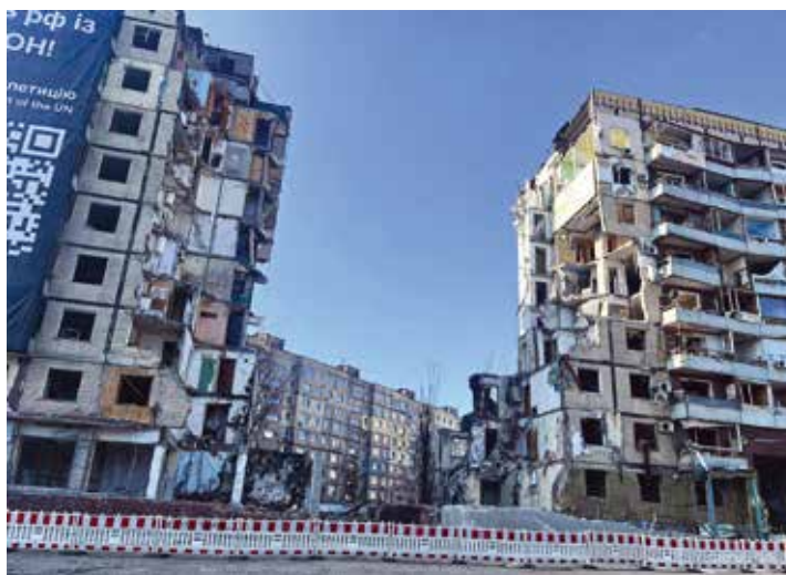
Ukrainas pilsētā Dņipro tika piedzīvota trauksmes sirēna.

30 bērni un jaunieši no nelabvēlīgām ģimenēm. Viņiem sarūpētas Kuldīgas pašvaldības dāvaniņas un saldumi, ko palīdzēja sagādāt kuldīdznieki un brīvprātīgie.