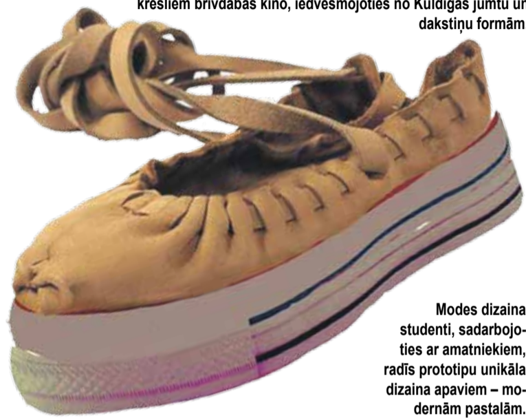
Modes dizaina studenti, sadarbojoties ar amatniekiem, radīja prototipu unikāla dizaina apaviem – modernām postalām.

tam nākotne būs ne tikai Latvijā, bet arī pasaulē.”