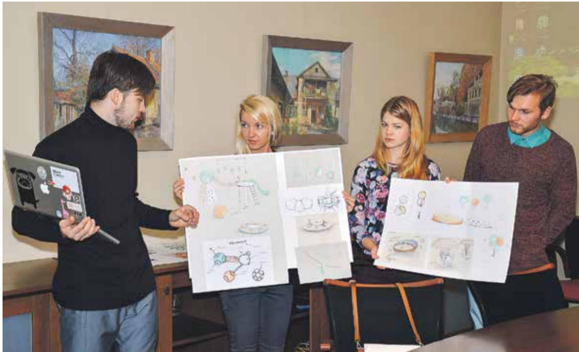
LMA funkcionālā dizaina studenti izstrādāja un prezentēja idejas bērnu rotaļu laukumam, par iedvesmu ņemot 60. gadu ikonu – burbulkrēslu.

Kamēr Kuldīga ir virzībā uz Latvijas Mākslas akadēmijas (LMA) filiāles atvēršanu, pilsēta iesaistās dažādos radošajos notikumos. Oktobrī tādi bijuši trīs.