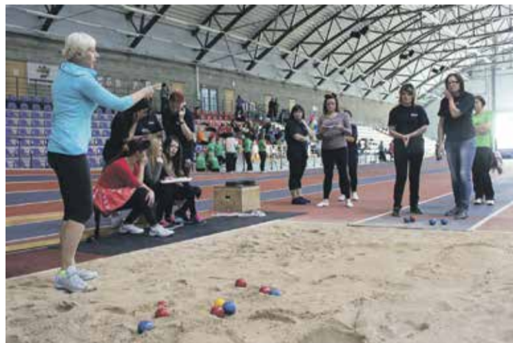
Tiesneses Daces Šteinbergas vadībā roku spēlē „Petanque” iemēģina ēdolniece.

Pasākuma organizēšanā aktīvi iesaistījās novada sporta skolotāju metodiskā apvienība.