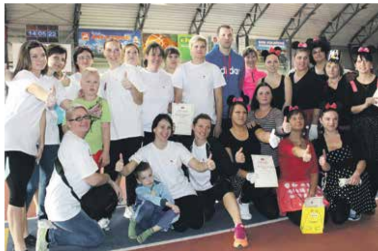
Tautas bumbas uzvarētāji – Pelču speciālās internātpamatskolas-attīstības centra komanda un labākā priekšnesuma autori PII „Bitīte”-attīstības centra komanda „Minnijas”.

LILITA MAČTAMA, izglītības nodaļas speciāliste