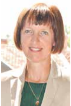
INGA BĒRZIŅA, Kuldīgas novada Domes priekšsē- dētāja

Šonedēļ piespraudu sarkanbaltsarkano lentīti pie mēteļa atloka, sācies novembris – mēnesis, kuru mēdzam saukt par patriotisma mēnesi un kurā svinam Latvijas dzimšanas dienu. Lielveikalos pie kasēm parādījušās sirsniņas Latvijas karoga krāsās, un ielās sākam sastapt cilvēkus ar pacilātības sajūtu sejā, lepnus par to, ka esam un varam dzīvot savā valstī. Pēc pāris nedēļām svinēsim Latvijas neatkarības proklamēšanas 96. gadadienu.