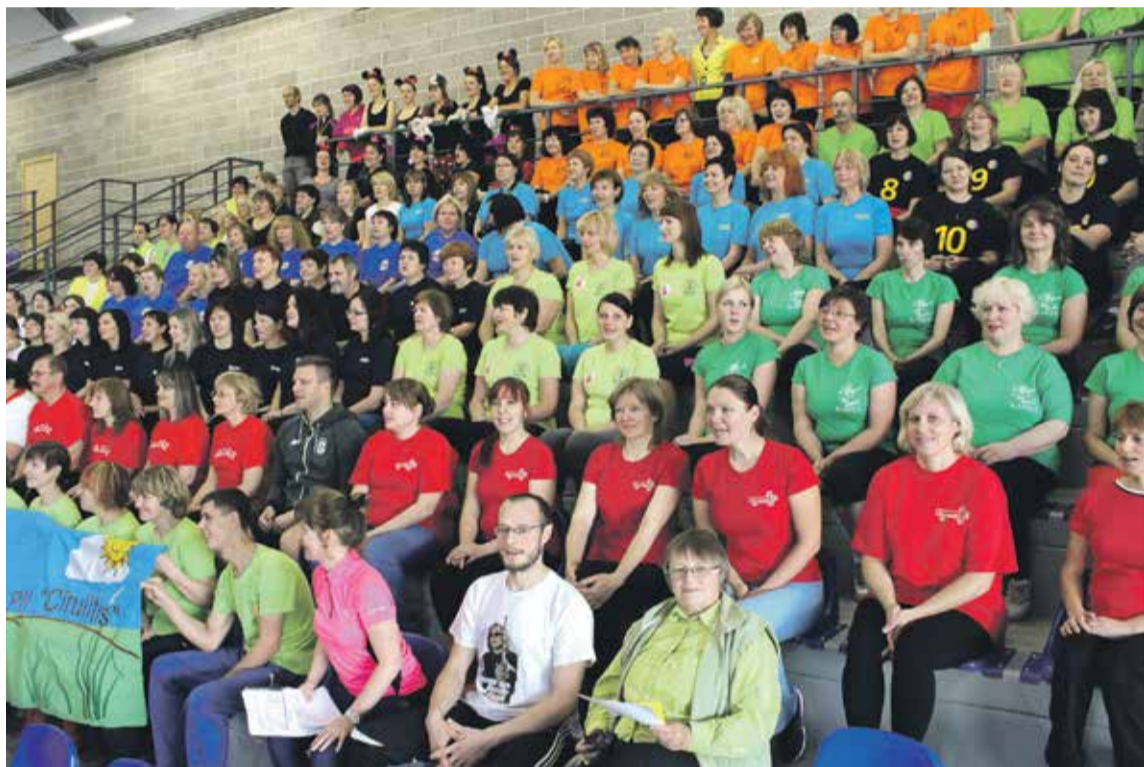
Šogad dažādās sportiskās aktivitātēs no 15 novada izglītības iestādēm iesaistījās 183 pedagogi.

Dalībnieki varēja arī savas spējas izmēģināt dažādās aktivitātēs, pie-