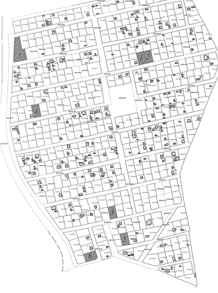
Nekustamo īpašumu atrašanās plāns d/b "KURZEMĪTE"

Izsoles noteikumos un informāciju par nekustamo īpašumu var saņemt Kuldīgas novada pašvaldības informācijas centrā Baznīcas ielā 1, Kuldīgā, Kuldīgas novadā, pa tālruni 63350143 vai e-pastā: dome@kuldiga.lv .