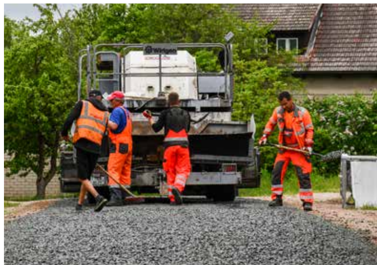
Strādnieki veic dubultās virsmas apstrādi Vijolišu ielā Pārventā. Šovasar kopumā apstrādās ielas gandrīz 3 kilometru garumā.

Kopš 2018. gada jau veikta vairāku grantēto ielu posmu divkārtu virsmas