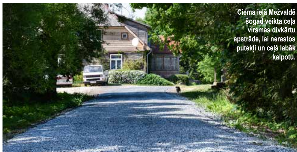
Ciema ielā Mežvaldē šogad veikta ceļa virsmas divkārtu apstrāde, lai nerastos putekļi un ceļš labāk kalpotu.