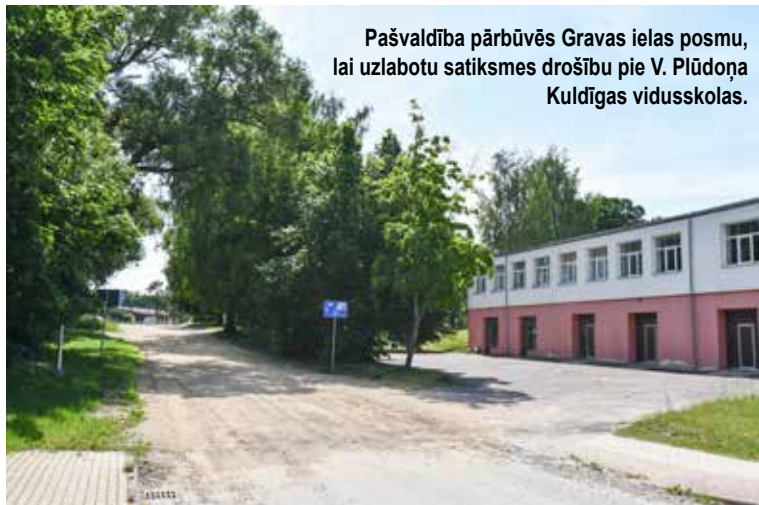
Pašvaldība pārbūvēs Gravas ielas posmu, lai uzlabotu satiksmes drošību pie V. Plūdoņa Kuldīgas vidusskolas.