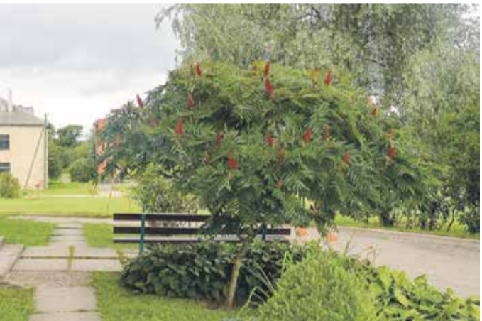
Kabiles pagasta daudzdzīvokļu mājas “Kalniņi” iedzīvotājiem ir patīkami kavēties uz soliņa, jo var priecāties par sakopto teritoriju ap māju.