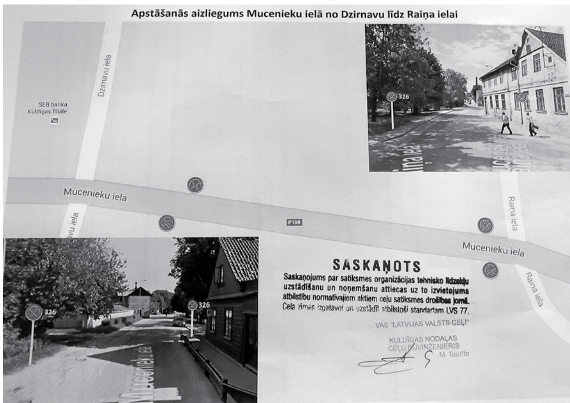
Uzstādītas ceļa zīmes ar apstāšanās aizliegumu Mucenieku ielā no Dzirnau ielas līdz Raina ielai.