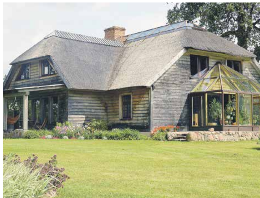
Ēdoles pagasta zemnieku saimniecības “Pūjalgi” saimnieks Miks Duburs rūpes par savu saimniecību uzticējies Izei Lorencei, kas rūpējas par plašo teritoriju, kurā iekoptas vairākas atpūtas zonas un daudzveidīga