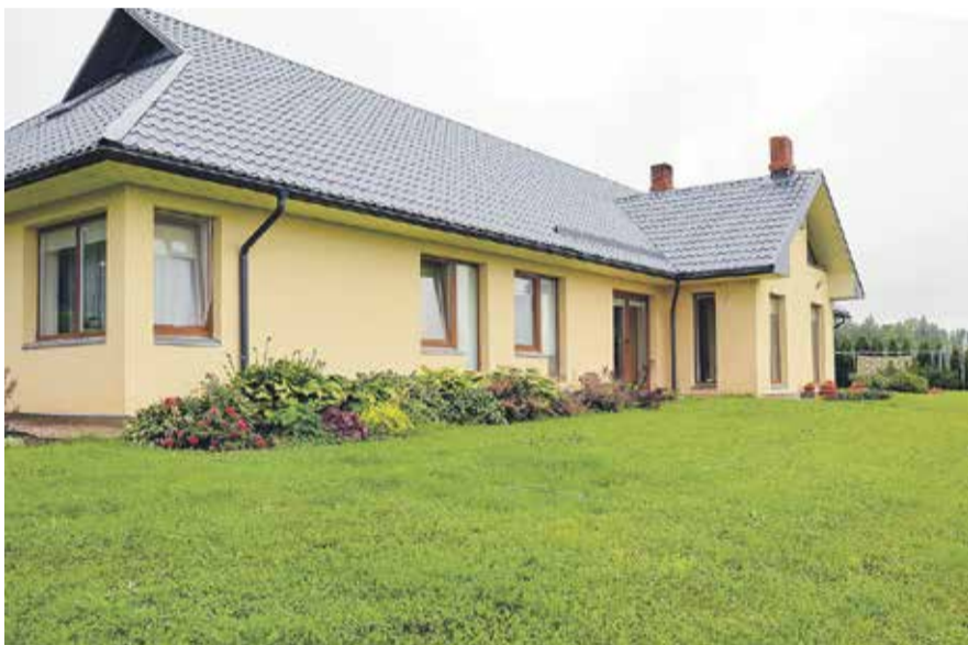
Pelču pagasta "Ziedoņi", Voiku ģimene piedalās piemājas saimniecību grupā.