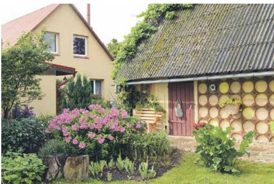
Snēpeles pagasta "Griezes", Irēna Taube piedalās piemājas saimniecību grupā.