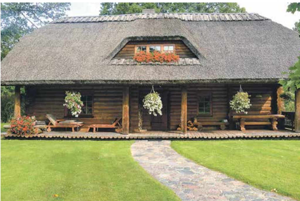
Tālbergu ģimene no Rumbas pagasta “Vēveriem” savu īpašumu rūpīgi kopj un lolo. Ģimene nominēta piemājas saimniecību kategorijā.