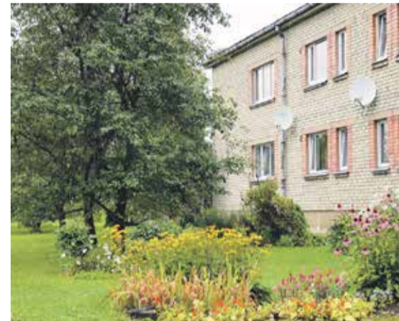
Pelču pagasta daudzdzīvokļu mājas “Raidstacija 3” iedzīvotājiem ir patīkami kavēties uz soliņa, jo lepojas ar skaisti ziedošajām puķu dobēm un iekopto teritoriju.