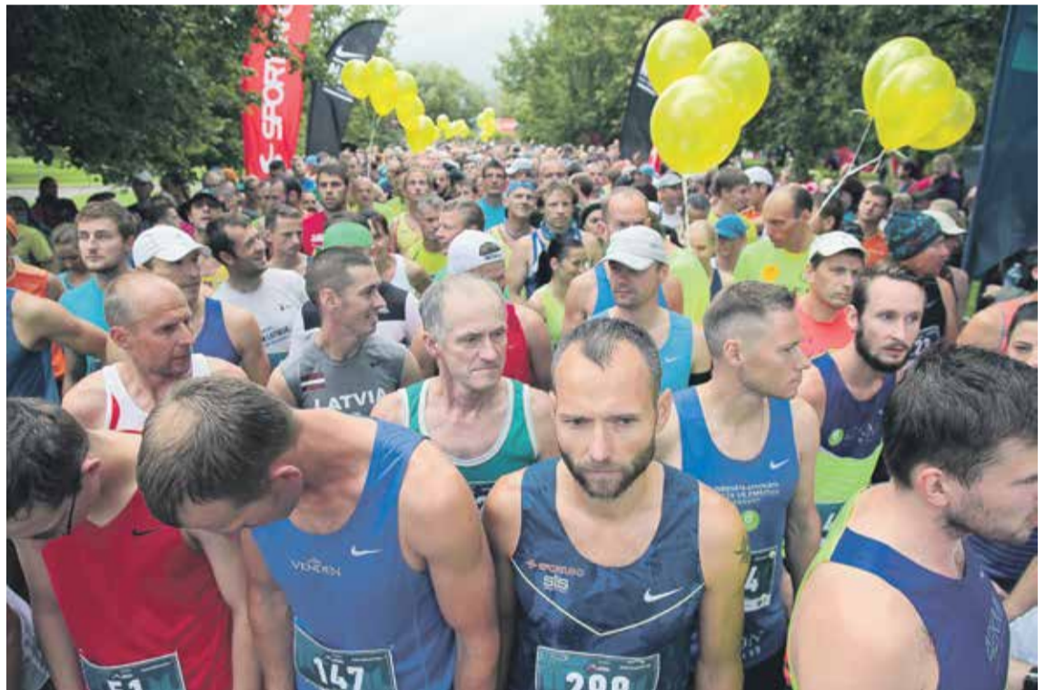
Uz pusmaratona starta pulcējās 439 skrējēji.

Šis Kuldīgas pusmaratons bija nedaudz savādāks kā citus gadus. Iepriekš visu distanču starti tika doti vienā laikā, bet šogad pusmaratonisti startēja pirmie – jau pulksten 10.00, un tikai pēc tam pārējo distanču dalībnieki. To atzinīgi novērtējuši gan dalībnieki, gan organizatori, jo starti