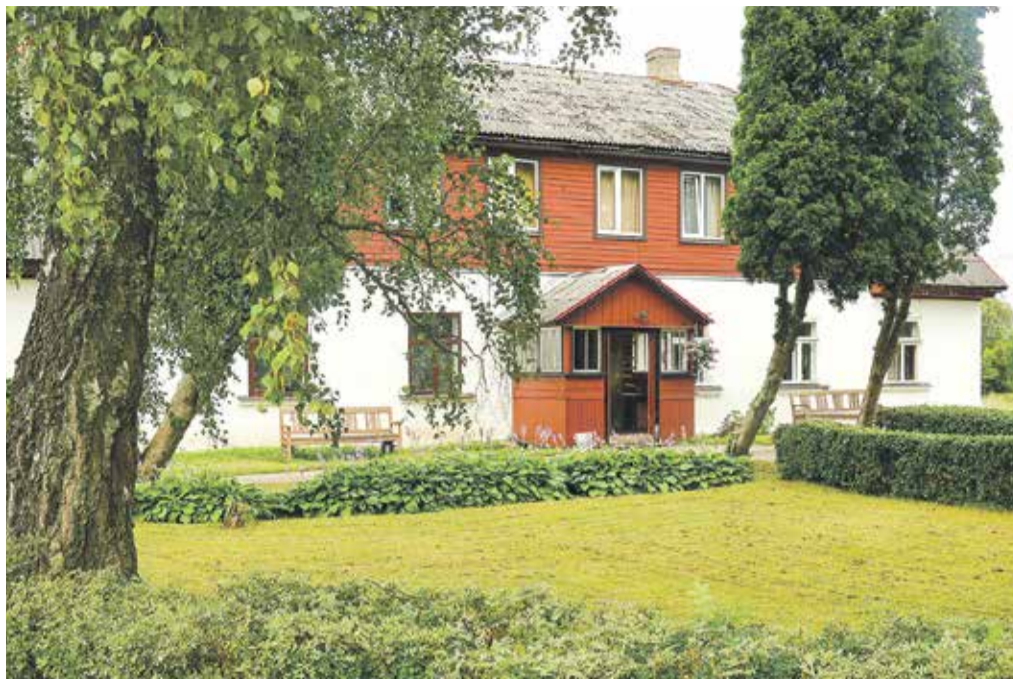
Žūrija atzinīgi novērtēja Padures pagasta daudzdzīvokļu mājas "Krāči" iedzīvotāju iniciatīvu kopt teritoriju ap sevi.