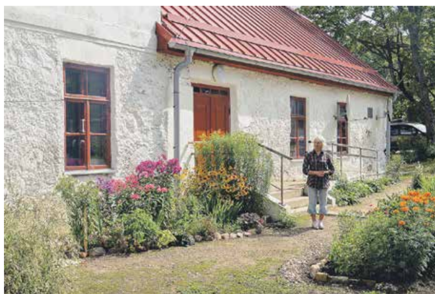
Ap Ēdoles pagasta daudzdzīvokļu māju "Gobas" iekoptas krāšņās puķu dobes un skaisti pļauts mauriņš.