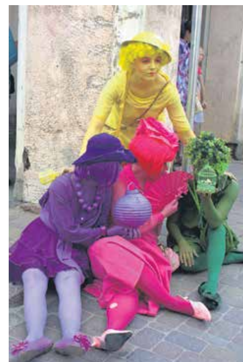
Lielu interesi skatītājiem raisīja kļūsošais ielu teātris „Hitt Hussitt” no Islandes ar izrādi „Līdz varavīksnes galam”. Izrādes dalībnieki lēni un netraucēti pārvietojās pa Rātslaukumu un Liepājas ielu, radot kustīgas varavīksnes iespaidu.