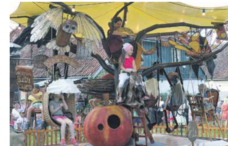
Lielu prieku bērniem raisīja Beļģijas grupas „Cie des Quatre Saisons” piedāvātā instalācija – izrāde „Ceļojošais koks”, kuru varēja pielīdzināt mobilam karuselim un kurā dalībnieki līdz 12 gadu vecumam varēja arī pavizināties.