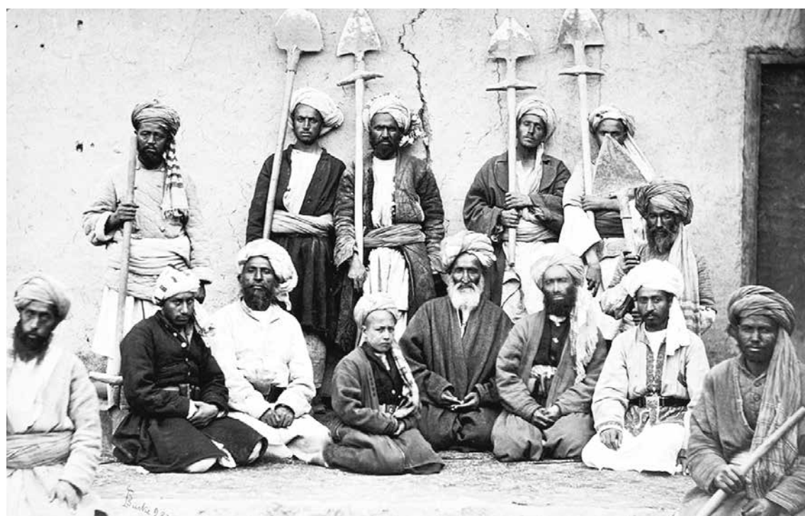
ISSP meistardarbnīcas sniegs viens no pasaulē atzītākajiem fotogrāfiem Saimons Norfolks, kurš savos darbos pēta kara ietekmi uz cilvēci.

Tā kā iepriekšējos gados novērota liela vietējo iedzīvotāju interese par vasaras skolas norisi, šogad pirmo reizi plānota īpaša darbnīca Pelču un tuvākās apkaimes jauniešiem bez iepriekšējas pieredzes fotogrāfijā. Jaunieši varēs piedalīties vasaras skolas programmā un