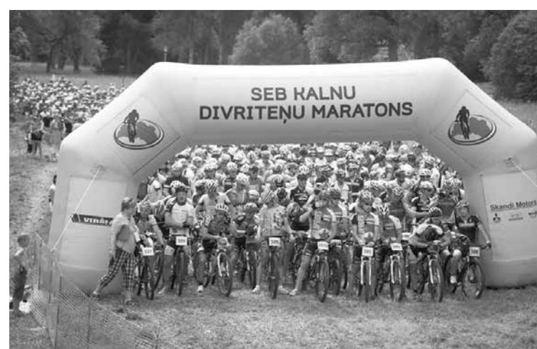
Kuldīgā atgriežas kalnu divriteņu sacensības – SEB MTB maratona 5. posms, kas pulcēs ap 2000 dalībnieku.

Masveidīgā „Virši – A” brauciena sākums paredzēts 13.30. Šajā 40 km distancē varētu startēt ap 1600 dalībnieku. Trase būs nedaudz vienkāršāka nekā „Skandi motors” braucienā, tomēr arī šeit riteņbraucējus sagaida virkne interesantu posmu. Kopā ar „Virši – A” braucējiem distancē dosies arī „Mammadaba” veselības brauciena dalībnieki, kuri varēs pavadīt dienu aktīvā atpūtā, baudot skaisto Kuldīgas apkārtni. Visi mazie kuldīdznieki un pilsē-