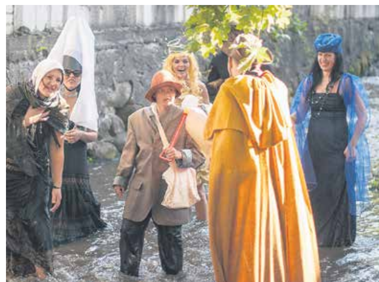
Pa vecpilsētas namu ieskauto Aleksūpīti ūdens karnevālā šogad piedalījās 6 komandas ar dažādu dalībnieku skaitu katrā. Spilgtākā un interesantākā bija „Sprīdītis” ar daudziem pasakas tēliem.