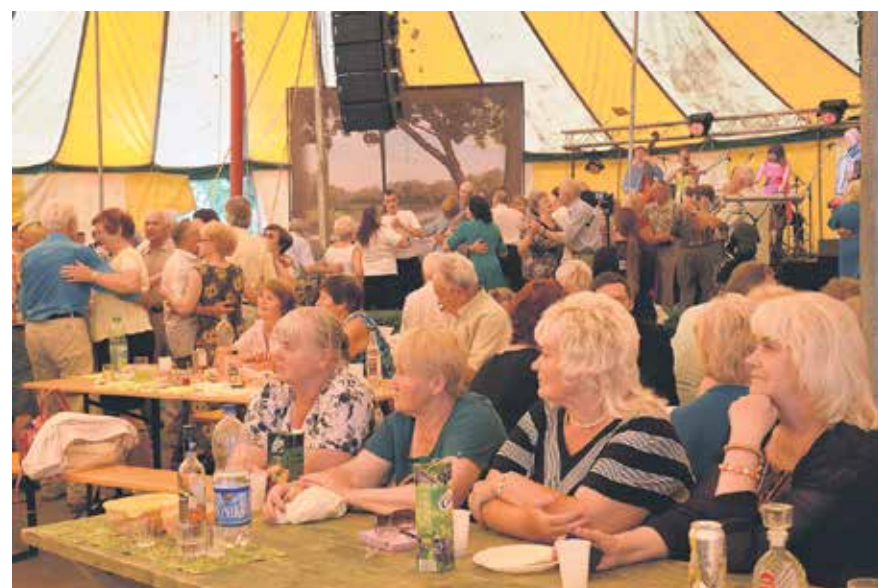
Ar lustīgu mūziku un dančiem 1905. gada parka Dārza svētku teltī bija pulcējušies vairāki simti senioru.