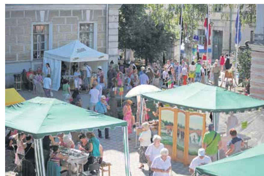
„Zelju” piestātne pulcēja cilvēkus uz SPA mācību salonu, kārvīna un saldumu meistardarbnīcām, radošām darbnīcām pieaugušajiem un bērniem, kā arī koka izstrādājumu tirdzniecību, mēbeļu, galdnieku un automehāniķu paraugdemonstrējumiem.