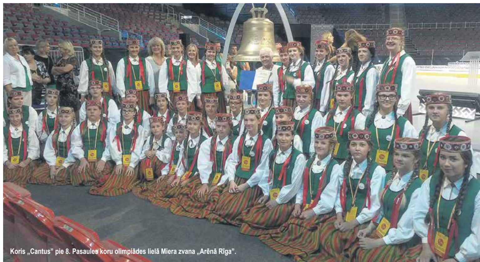
Koris „Cantus” pie 8. Pasaules koku olimpiādes lielā Miera zvana „Arēnā Rīgā”.