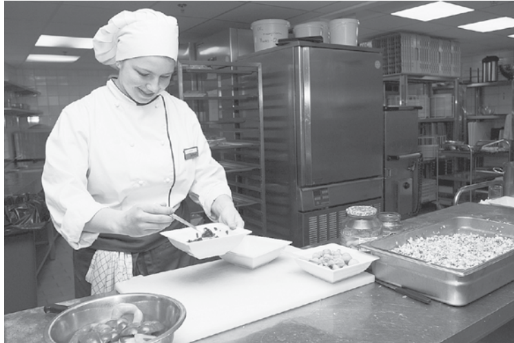
Profesionālās izglītības iestādes piedāvā jauniešiem iegūt izglītību bez maksas.

Profesionālās izglītības iestādes, kas iesaistījušās ESF projektā, 32