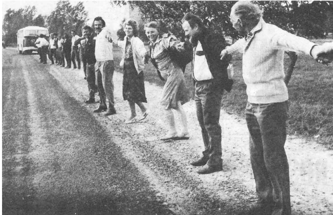
1989. gadā vairāk nekā miljons cilvēku sādēvās rokās, veidojot 600 km garu ķēdi cauri Baltijas valstīm.

Plašāka informācija pie Kuldīgas Galvenās bibliotēkas Automatizācijas un informācijas resursu apstrādes nodaļas speciālistes Initas Fogeles, tālr. 63350247, e-pasts: Inita.Fogele@kuldiga.lv .