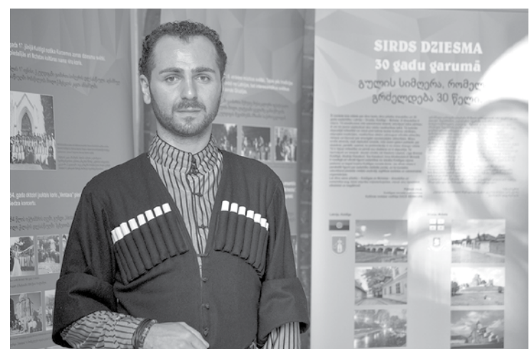
Gruzijas vīru ansambļa „Mcheta” dalībnieki izstādes atklāšanā.