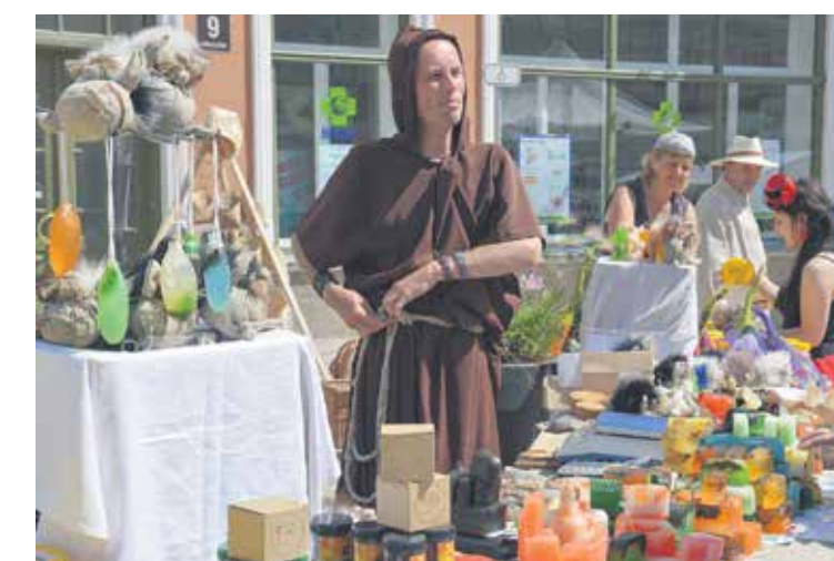
Sestdien visu dienu Liepājas ielu pārpludināja Amatnieku tirgus lustes. Ar dažādiem rokdarbiem, kārumiem, kalumiem un darinājumiem tirgotāji bija ieradušies ne tikai no novada, bet arī kaimiņu pilsētām un valstīm.