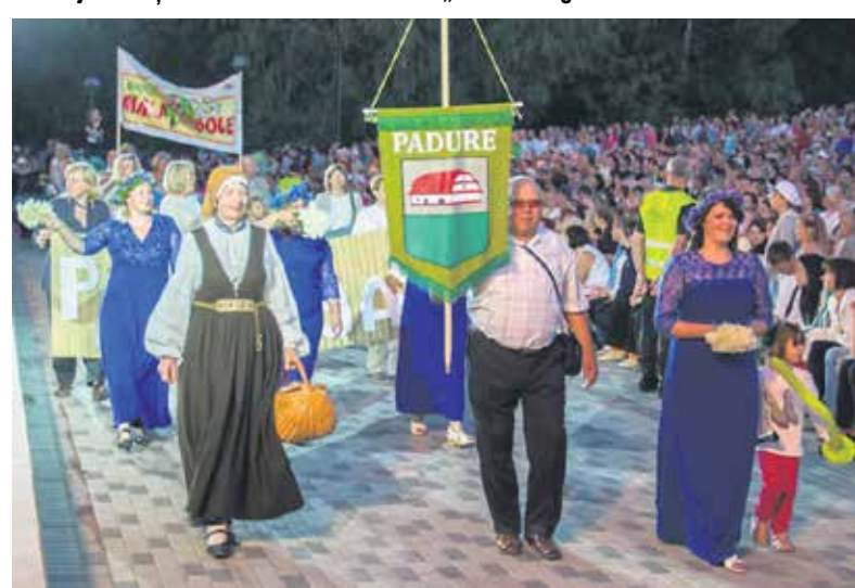
Ar apbrīnojamu entuziasmu kuldīdznieki katru gadu pošas tradicionālajam „Dzīru” gājienam. Arī šogad gājienā varēja redzēt kuldīdznieku un viesu izdomu un radošumu. Gājienā piedalījās lieli un mazi, jauni un veci dalībnieki.