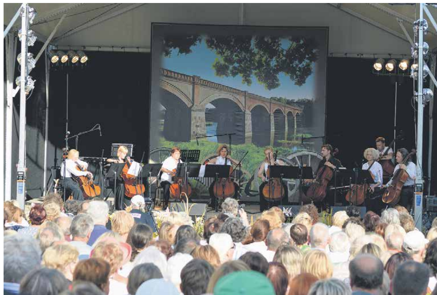
Kuldīgas „Dzīres” noslēdza Latvijas Nacionālā simfoniskā orķestra mūzikas grupas koncerts „Čellu Dream Team Kuldīgā”, izpildot pasaules un latviešu klasiskās mūzikas pērlis.