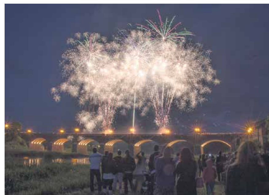
Atklājot 19. „Dzīres Kuldīgā”, izskanēja Valda Zilvera un dzejnieka Jāņa Petera speciālveltījums Ventas tiltam 140. jubilejā un grandiozs svētku salūts.