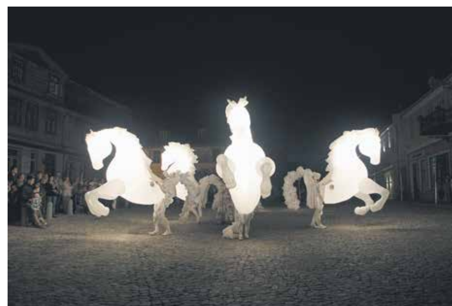
Grupas „Des Quidams” izrāde „Zirgi” atstāja neaizmirstamu iespaidu ne tikai svētku atklāšanā Ventmalā, bet arī Rātslaukumā. Grupa savā darbībā izmantoja transformējamus tēlus, kuru pamatā bija specifisks dizains.