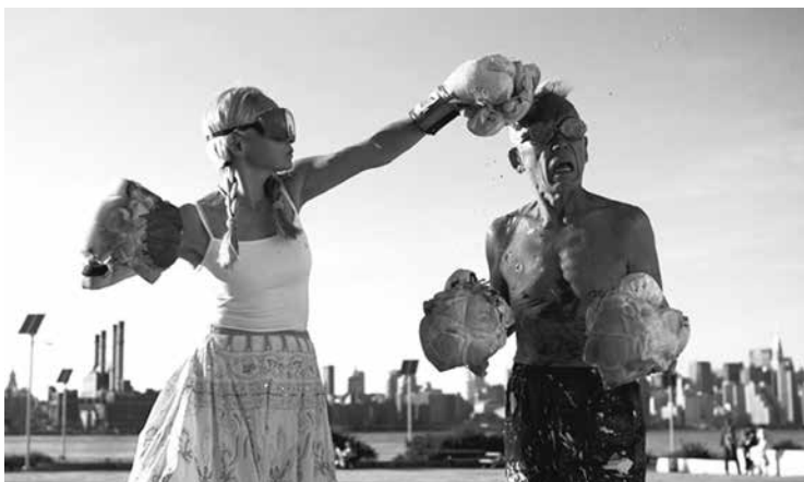
Kadrs no filmas „Skaistule un bokseris”.