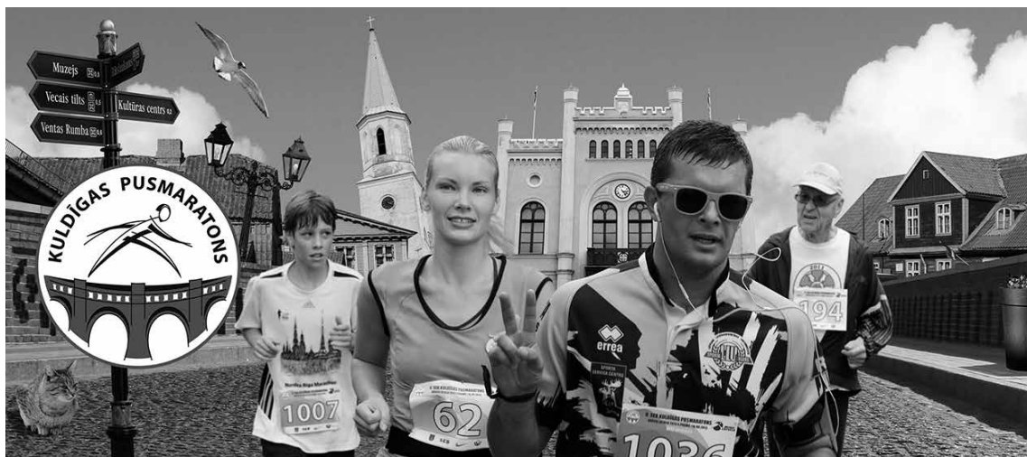
9. augustā notiks 9. Kuldīgas pusmaratons.

Pieteikšanās Kuldīgas pusmaratonam: www.kuldigas-pusmaratons.lv , www.skrienlatvija.lv , www.sportlat.lv , kā arī Kuldīgas Vieglatlētikas manēžā (tāl. 27842624, 63321942).