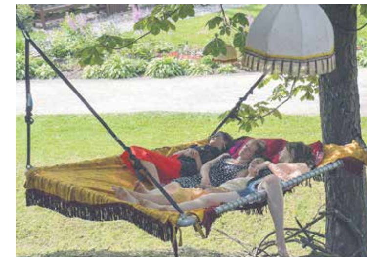
Izmantojot Pilsētas dārza kokus, Francijas grupas „Du O des Branches” dalībnieki ar savdabīgu noskaņu mūziku četru stundu garumā veidoja nostalgisku meditatīvu izrādi „Koku duets”.