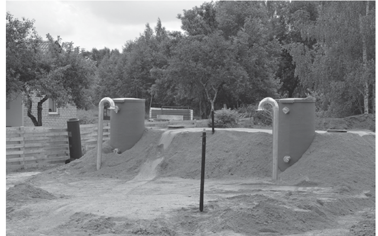
Priedaines ciema jaunā sūkņu stacija.

Kurmāles pagasta Priedaines ciemā aktīvi norit ūdenssaimniecības būvniecības darbi, kurus plānots pabeigt 31. jūlijā.