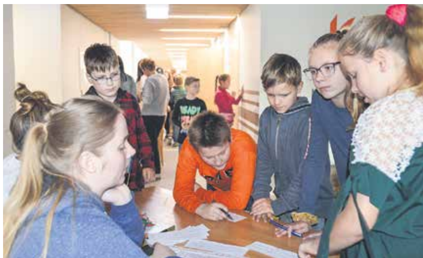
Pēc pasaku ceļa izveides klases piedalījās radošajās aktivitātēs – vēroja pasakas animāciju, salika pasakas teksta fragmentus pareizā secībā, ievietoja pasakas tekstā trūkstošos patskaņus un vārdus, izteiksmīgi lasīja pasaku un apguva vecvārdus.