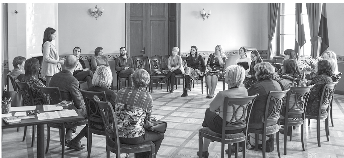
Kuldīgas novada Domē notika pieredzes apmaiņa-diskusija par līdzdalības veicināšanu un mūsdienīgu atbalstu aktīvajiem iedzīvotājiem. Diskusijas laikā tika izteiktas idejas veiksmīgai novada attīstībai.