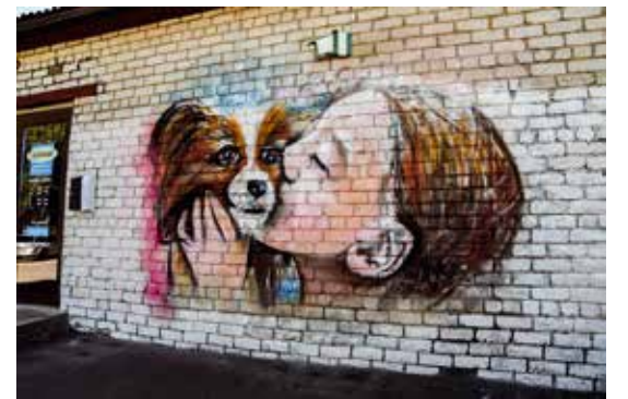
Guntis Obodņikovs uz Kuldīgas dzīvnieku patversmes “Mīļās ķepiņas” ēkas sienas attēloja sirsniņu ainu ar meitenīti un suni.