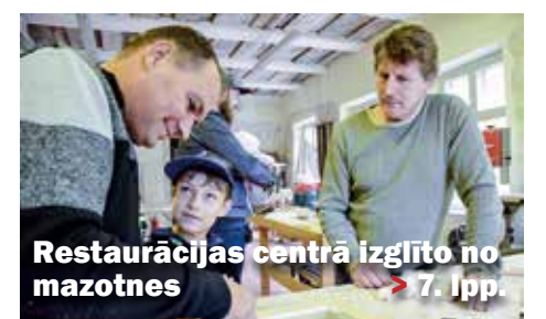
Restaurācijas centrā izglīto no mazotnes