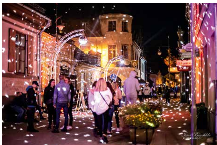
12. septembra naktī sestā mākslu kaleidoskopa “UGUNS (un) NAKTS” norises laikā Liepājas iela pārvērtās līdz nepazīšanai un iemirdzējās vēl neredzētās krāsās.