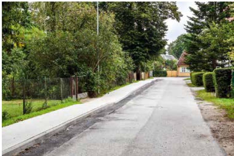
Dārza ielā uzbūvēta ietve, kas uzlabo gājēju drošību.

Pēc SIA "JOE" izstrādāta būvprojekta būvdarbus veica SIA "A-Land" par 34 000 EUR.