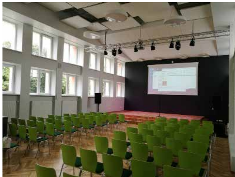
V. Plūdoņa Kuldīgas vidusskolas skolēni un skolotāji ieguvuši multifunkcionālu zāli un mācību kabinetus, ko pilnvērtīgi izmantos visa mācību gada garumā.