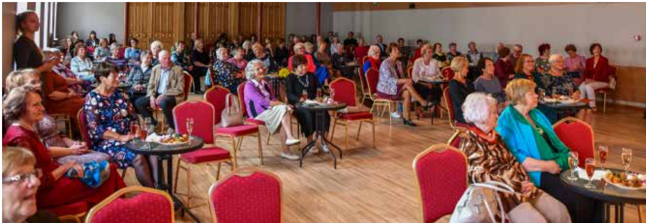
Kuldīgas kultūras centrā kopabūšanas prieku ar skaistu koncertu baudīja novada pensionētie pedagogi. Pašvaldības vadītāja pateicās viņiem par ieguldīto darbu skolēnu izglītošanā un audzināšanā.

KĀRLIS KOMAROVSKIS, sabiedrisko attiecību speciālists