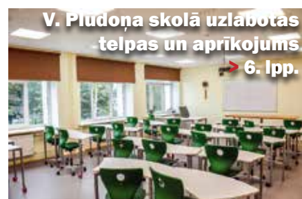
V. Pludona skolā uzlabotas telpas un aprīkojums