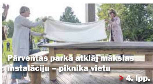
Pārventas parkā atklāj mākslas instalāciju – piknika vietu