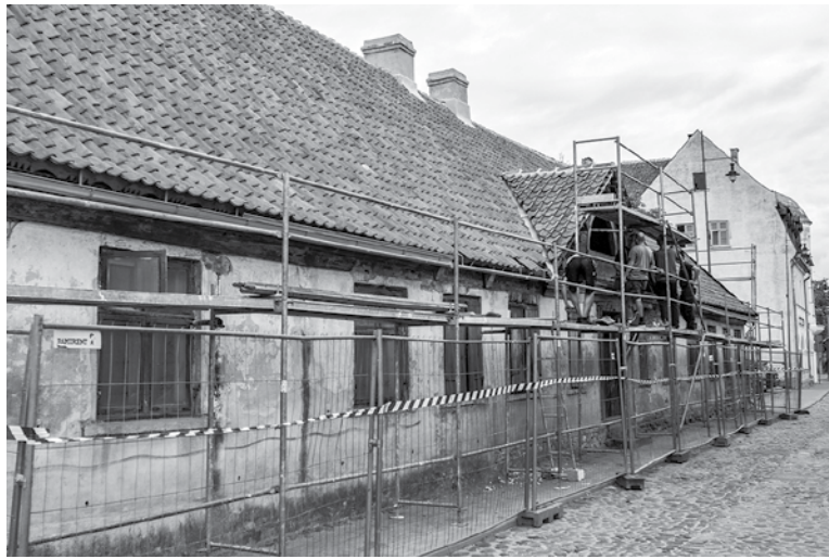
Aptuveni 200 gadus vecai ēkai starptautiskas restaurācijas darbnīcas ietvaros restaurēja frontonu, jumta dzegas un vējdēļus.

Ar senām metodēm un rokas instrumentiem, kas ir seno darbarīku kopijas, atjaunoja pusloka frontona logu ar liektiem spraišļiem, iestikloja to, restaurēja ēkas frontonu, jumta dzegas, vējdēļus, atjaunoja vēsturiskos apšuvuma dēļus, noņemot periodam neatbilstošos dēļus,