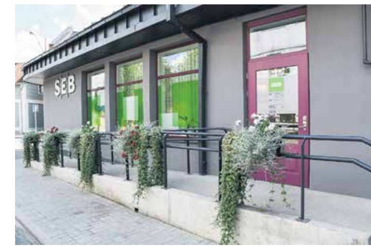
SEB bankas Kuldīgas filiāle tikai nesen pārcēlusies uz telpām Pilsētas laukumā 5. Pie ieejas izveidoti nokareni gaisa dārzi.