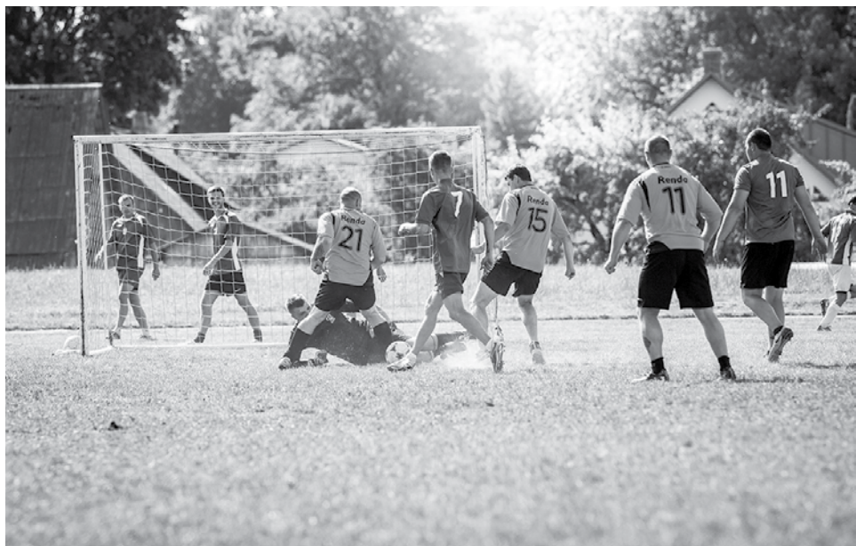
Futbolā šogad bija īpaši daudz komandu. Attēlā sacenšas Padures un Rendas pagasta futbolisti.

Sporta spēles ik gadu rīko Kuldīgas novada pašvaldība sadarbībā ar novada pagastiem. To mērķis ir popularizēt sporta sacensības Kuldīgas novadā un iesaistīt iedzīvotājus aktīvā darbībā savas veselības nostiprināšanā. Pasākums tika rīkots Kuldīgas novada Domes projektā Nr. 9.4.2.4/16/1/095 "Veselības veicināšanas un slimību profilakses pakalpojuma pieejamības uzlabošana Kuldīgas novada iedzīvotājiem".