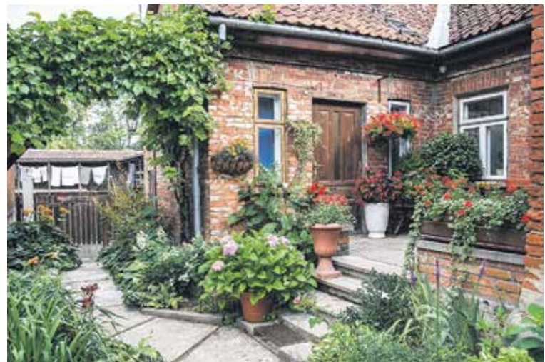
Dilānu ģimenes krāšņais dārzs Kaļķu ielā 10 ir īstena pērle, kurā atspoguļots kādas Itālijas mazpilsētas šarms.