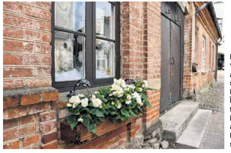
Pie veikala “Zelta apelsīns” šogad zied ledenītes. Īpaši krāšņās tās izskatās koka kastēs ar smalki kaltiem metāla stiprinājumiem.