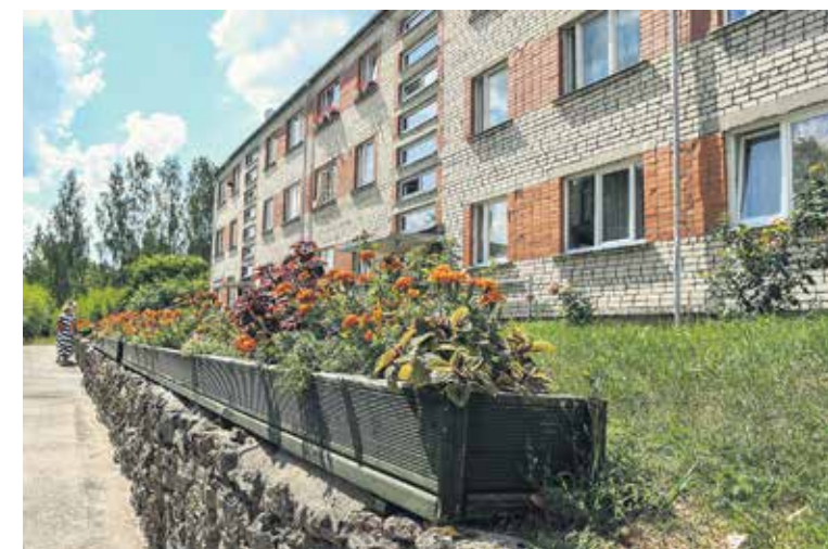
Planīcas ielā 10 pie daudzdzīvokļu mājas novietotas skaistas koka kastes, kurās visu vasaru zied košas samtenes.