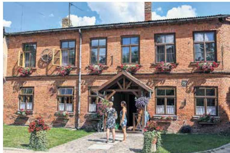
Liepājas ielā 25a sarkano ķieģeļu māju papildina košie gaisa dārzi, piešķirot ēkai īstenu Kuldīgas šīku.