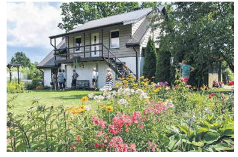
Safonovu ģimenes mājas (Vijoliņu ielā 4) apkārtnē iekārtota, izmantojot pašu idejas un iecerēs. Te valda ziedu daudzveidība un mājīga atmosfēra. Vasaras rītos ģimene rīta kafiju malķo laukā, baudot dabu.

SIGNETA LAPIŅA, sabiedrisko attiecību speciāliste