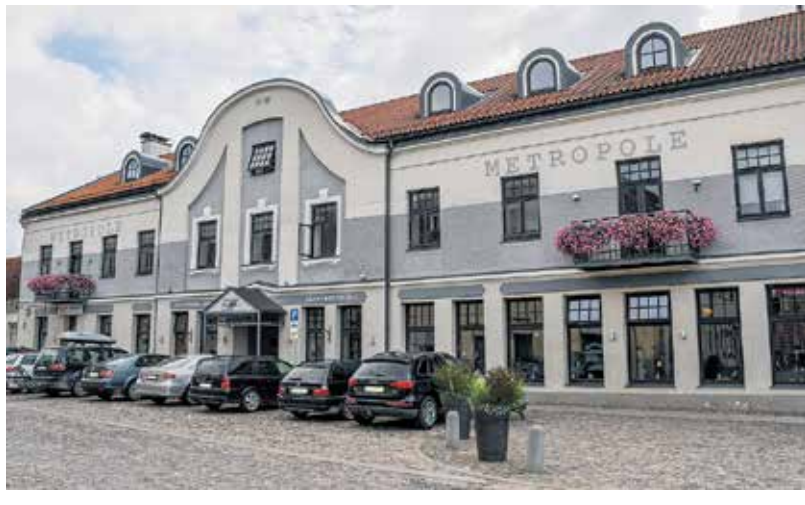
Arī šogad viesnīcas “Metropole” balkoni izdailoti ar bagātīgi ziedošām puķu kastēm.