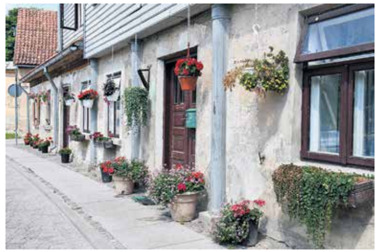
Annas iela 6 ik gadu pārsteidz ar krāšņi ziedošiem gaisa dārziem. Turpat iedzīvotāji izveidojuši arī volejbola laukumu, kur sportiski pavadīt brīvo laiku.