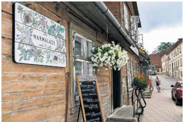
Kafejnīcas “The Marmalade” senatnīgo fasādi papildina smaržīgi gaisa dārzi.