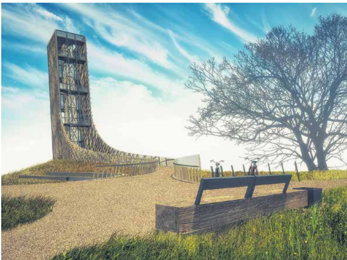
Jaunais skatu tornis Pārventā sniegsies 25 metru augstumā pāri nogāzei un būs nedaudz izliekts, radot sajūtas kā lidojumā.

sadarbības programmas 2014.–2020. gadam projektā Nr. LLI-010 "Dabas tūrisms visiem (UniGreen)".