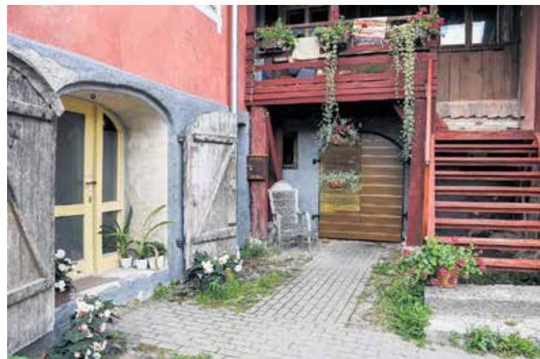
Baznīcas ielas 17 pagalmā ir ieeja uz apartamentiem. Tā izskatās pēc īstas oāzes, turklāt pasargā no vecpilsētas kņadas.

Dalībnieku apbalvošana notiks 6. oktobrī Hercoga Jēkaba gadatirgus laikā. Pirmā vieta katrā kategorijā iegūs atzinības plāksni un naudas balvu 150 EUR, otrā vieta – 100 EUR, bet 3. vieta – 75 EUR.