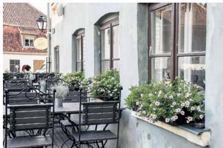
Kafejnīcas “Tilts”, Kalna ielā 27, terasē iekārtotas bagātīgi ziedošas puķu kastes, kas klientu pavadīto laiku te dara vēl jaukāku.