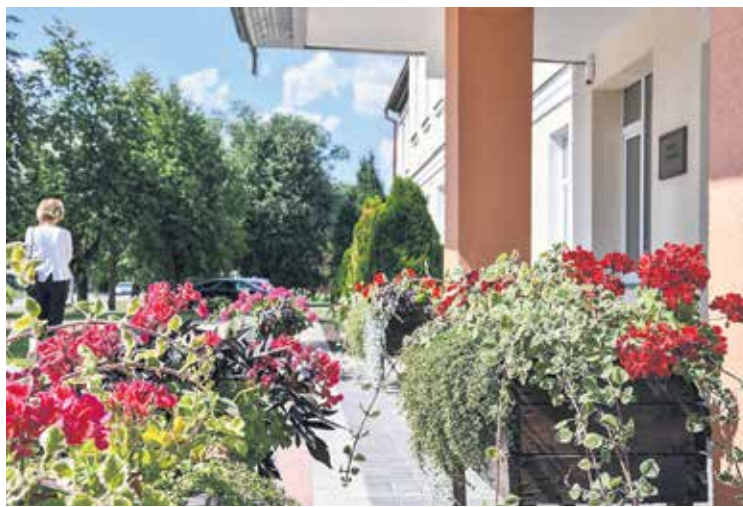
Kuldīgas 2. vidusskolas teritorija iekopta ar skujuņu dobēm un puķu kastēm.