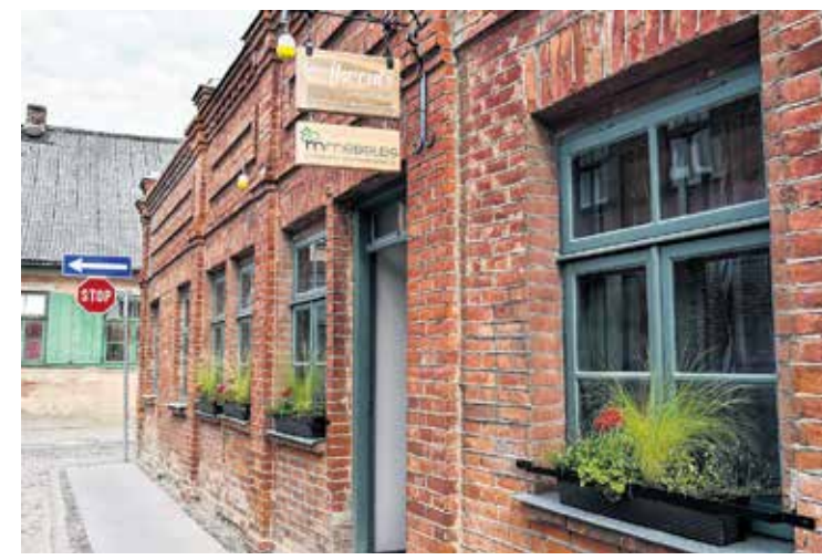
Veikala “Akcents” palodzes papildinātas ar puķu kastēm, kas atdzīvina senatnīgo ēku Tīrgus ielā 2.