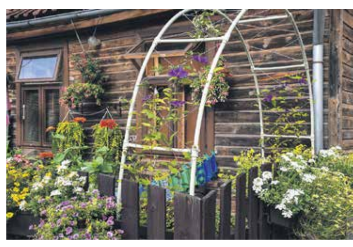
Daudzdzīvokļu mājas Jelgavas ielā 4 iekšpagalmis ir Cimermaņu ģimenes lolojums – te izveidoti pārsteidzoši krāšņi gaisa dārzi un iekārtotas puķu kastes.