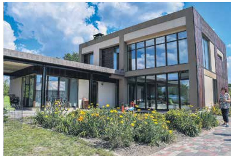
Privātmāja Dzelzceļa ielā 1a Putnudzārzā iekārtota modernā stilā. Tur it visā valda minimālisms un harmonija.