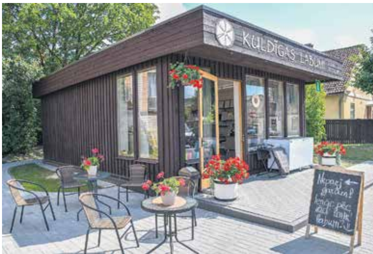
Mājrāzotāju veikaliņš “Kuldīgas labumi” piedāvā iegādāties ne tikai lauku labumus, bet arī nobaudīt kafiju vai saldējumu skaisti iekārtotā āra terasē.