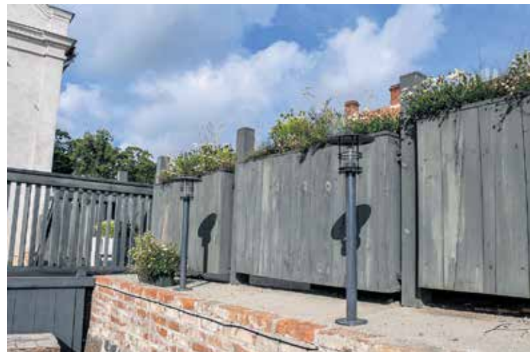
Pirmo gadu Pils ielā 2 durvis vērusi kafejnīca “Rezidence Cafe Venta”, kas apmeklētājus vilina ne tikai ar izcilu atmosfēru, bet arī lakonisku un sakoptu vidi.