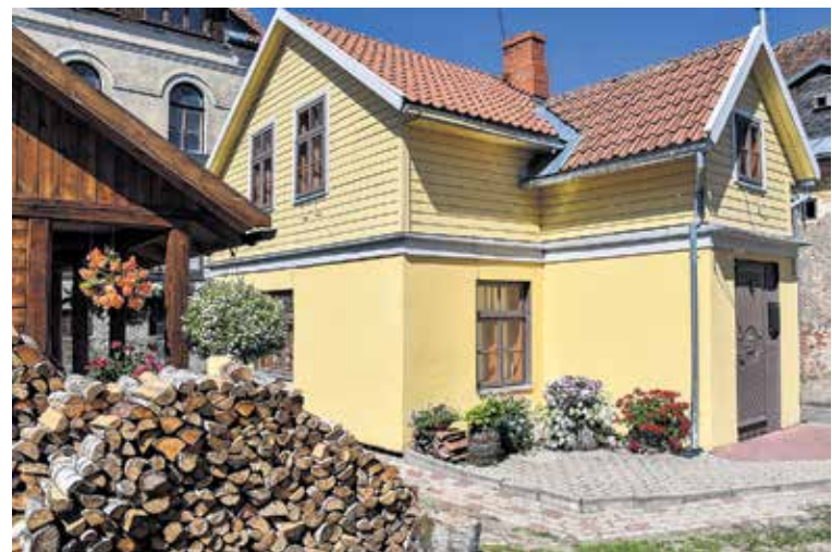
Jelgavas iela 1 atrodas pašā vecpilsētas sirdī. Putniņu ģimenes ziedošie gaisa dārzi ik vasaru priecē ne tikai iedzīvotājus, bet piesaista arī tūristu uzmanību.