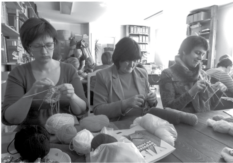
Šogad pasākumā "Satiec savu meistaru" Kuldīgas novada muzejs aicina piedalīties un uzadīt savu cimdū.

Nodarbības notiks Kuldīgas novada muzeja administrācijas ēkā, 2. stāvā, Pils ielā 5.