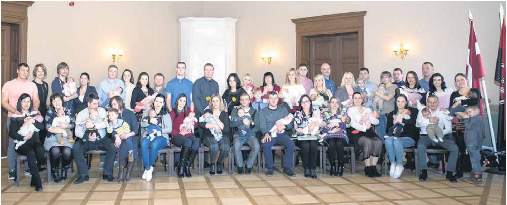
Martā piemiņas dāvanas – sudraba karotītes – saņemšanā piedalījās 25 mazuļi ar ģimenēm.