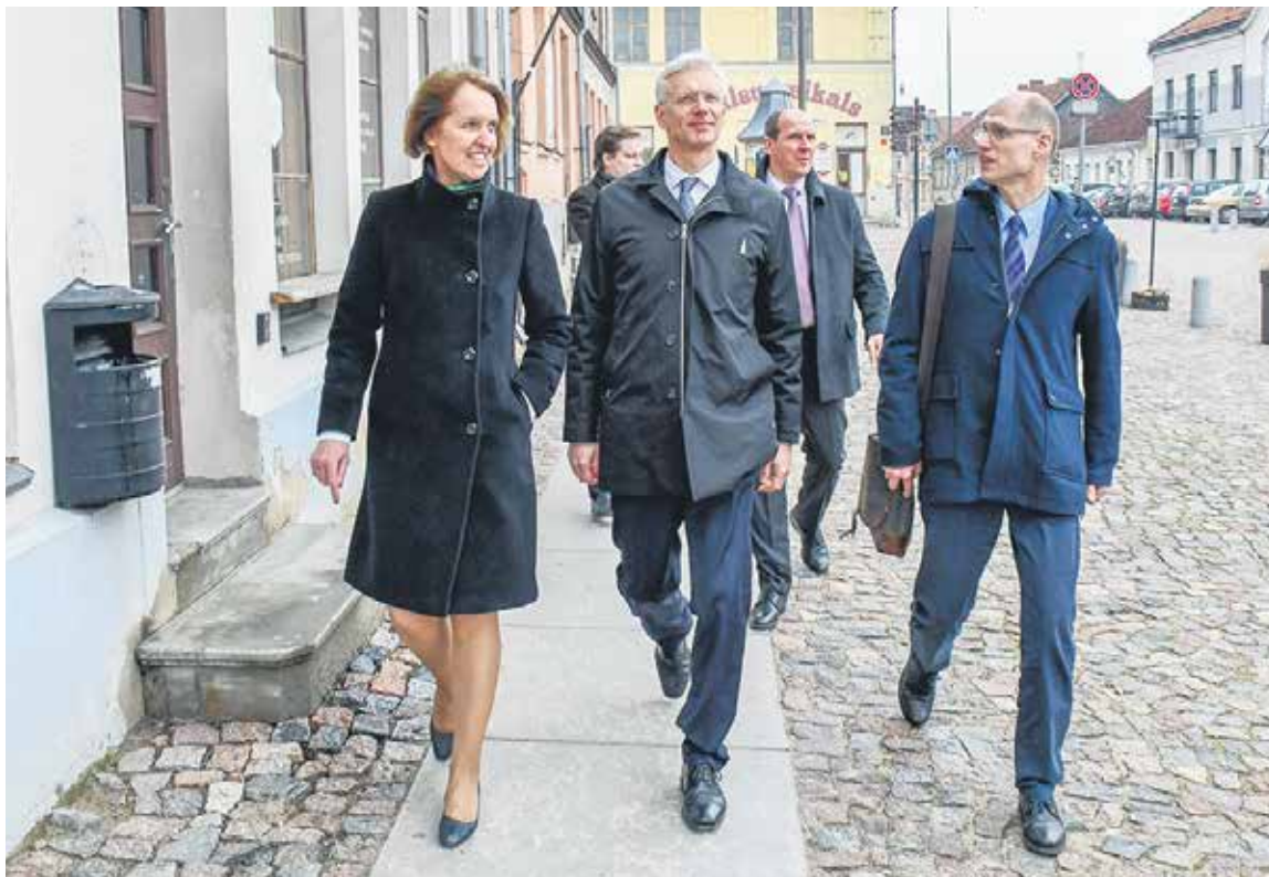
Aizvadītajā nedēļā Kuldīgas novadu apmeklēja Ministru prezidents Krišjānis Kariņš. Viņš atzina, ka vizītes laikā radies liels iespaids par pilsētu un tās attīstību.