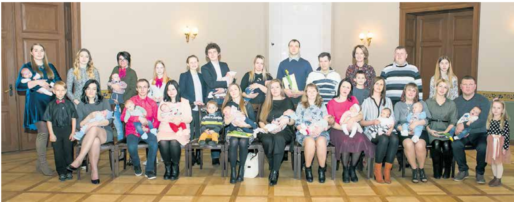
Kuldīgas novada Domē svinīgajā sudraba karotīšu pasniegšanā pulcējušies janvārī un februārī dzimušie bērniņi un viņu vecāki.

12. martā Kuldīgas novada Domē norisinājās svinīgā sudraba karotīšu pasniegšana, uz kuru bija aicināti 35 bērniņi – 15 meitenes un 20 zēni. Šo bērniņu dzimšana reģistrēta no 2019. gada 1. janvāra līdz 28. februārim. 34 mazuliši reģistrēti Kuldīgas novada Dzimtsarakstu nodaļā, bet viens bērniņš – Rīgā.