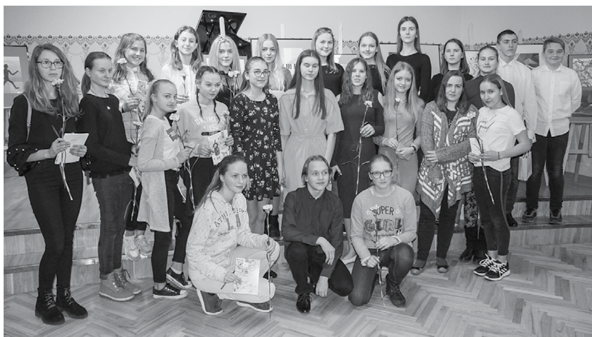
Mūzikas skolas 7. klavieru klašu audzēkņi un mākslas skolas 6. kursa audzēkņi pēc koncerta.