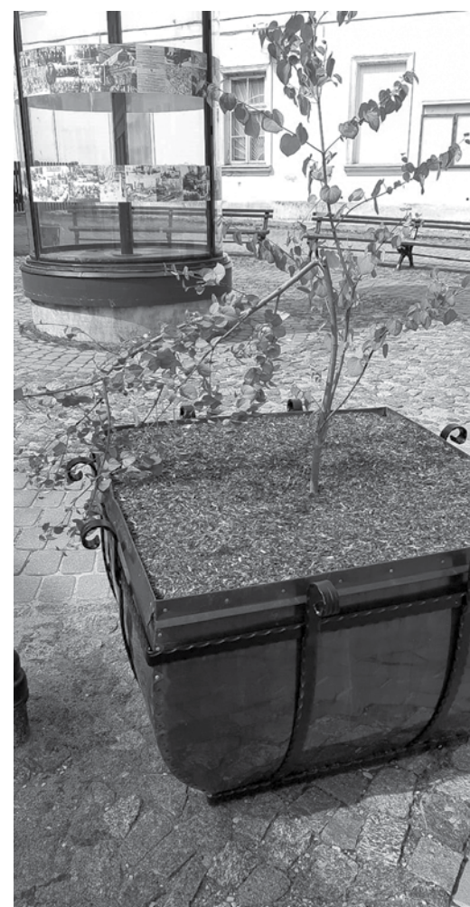
Liepājas ielā pie rūpnīcas “Vulkāns” stenda naktī ļaunprātīgi tika nolauzts tikko iestādīts kociņš. Videonovērošanas sistēmās redzams, ka to izdara jauniešs. Vainīgais ir identificēts un tiks saukts pie atbildības.

KĀRLIS KOMAROVSKIS, sabiedrisko attiecību speciālists