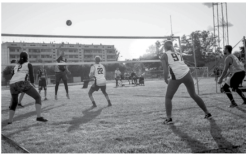
Aizvadīta “Nakts četrčīņa”, kurā 16 komandas mērojās spēkiem četros sporta veidos – strītbolā, florbolā, volejbolā un futbolā.

12. jūlija Viļa Plūdoņa Kuldīgas vidusskolas stadionā aizvadīta “Nakts četrčīņa”, kurā šogad piedalījās 16 komandas. Komandas mērojās spēkiem četros sporta veidos – strītbolā, florbolā, volejbolā un futbolā.