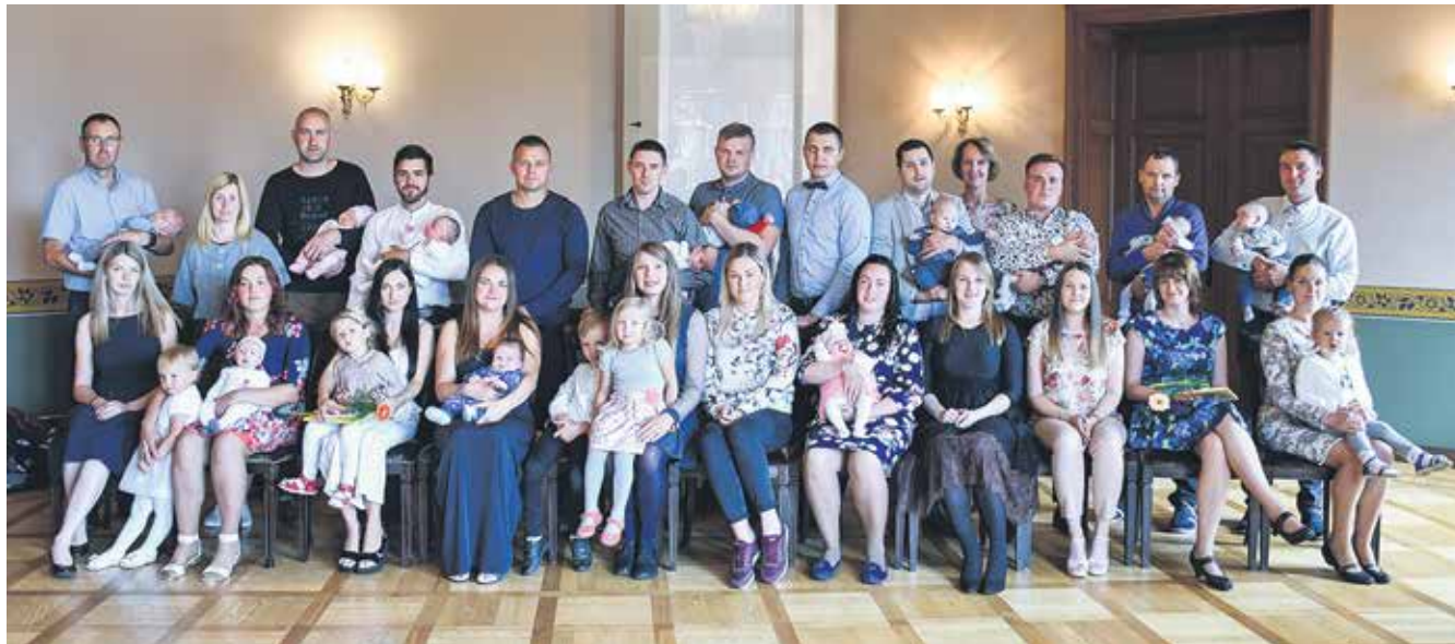
Jūlijā sudraba karotītes par piemiņu no dzimtās vietas saņēma maijā un jūnijā reģistrētie mazulīši.

Kuldīgas novada Dzimsarakstu nodaļas vadītāja