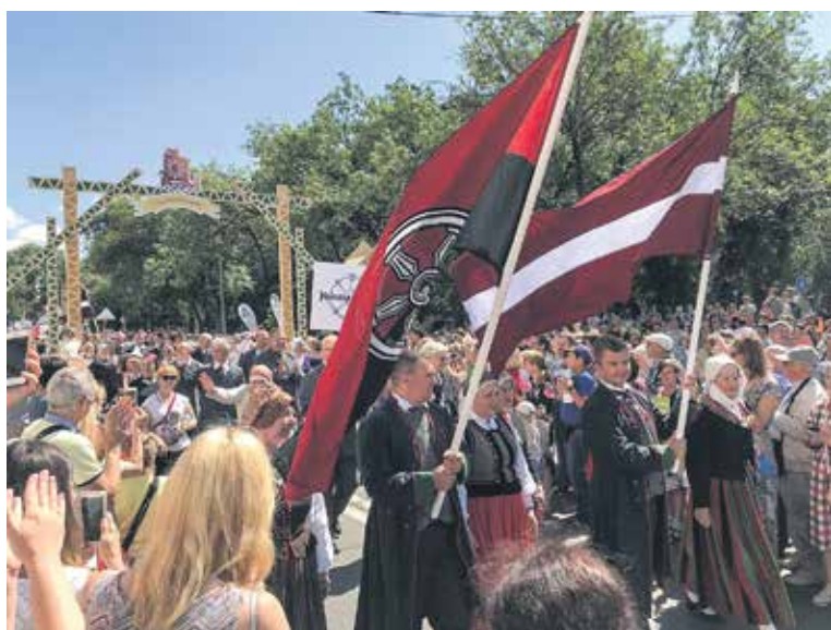
Hanzas dienu noslēguma gājienā 30. jūnijā devās aptuveni 2000 delegātu un kultūras grupu dalībnieku, arī Kuldīgas delegācija.

Kuldīgas pārstāvji piedalījās Hanzas pilsētu delegātu sēdēs un citos oficiālos pasākumos. Delegātu sēdē tika apstiprināta trīs jaunu pilsētu uzņemšana Hanzas pilsētu savienībā, uz trim nākamajiem gadiem tika ievēlēts