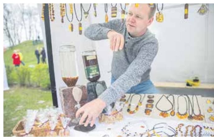
Pavasara gadatirgū piedalījās vairāk nekā 300 tirgotāju.