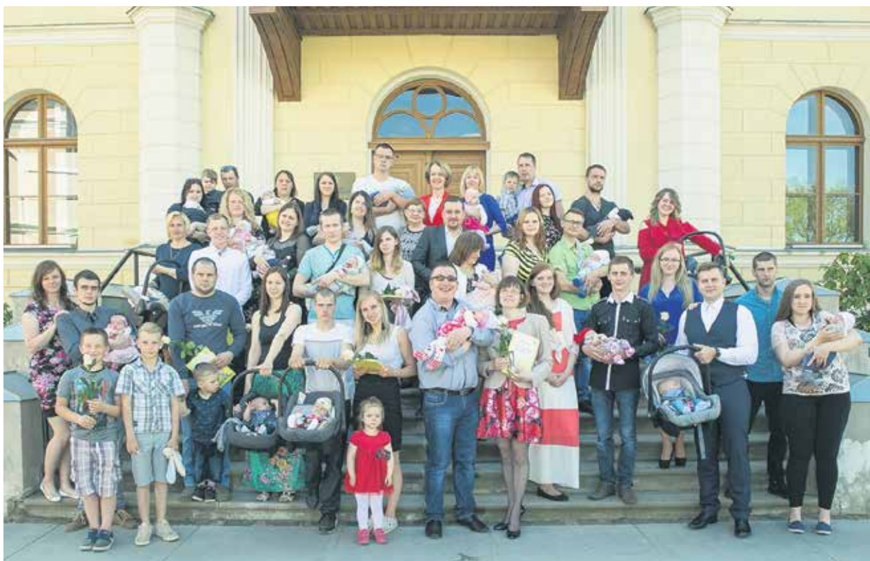
Vecāki un jaundzimušie pēc sudraba karotīšu saņemšanas Kuldīgas novada Domē kopā nofotografējās.

ILONA KĒSTERE, Dzimtsarakstu nodaļas vadītāja