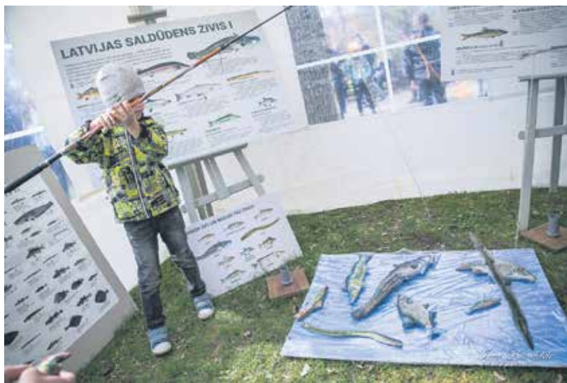
Vides izziņas pietātnē interesenti izpētīja pleznas, knābjus un spalvas, kā arī uzzināja, kāpēc Kuldīgā lido zivis.