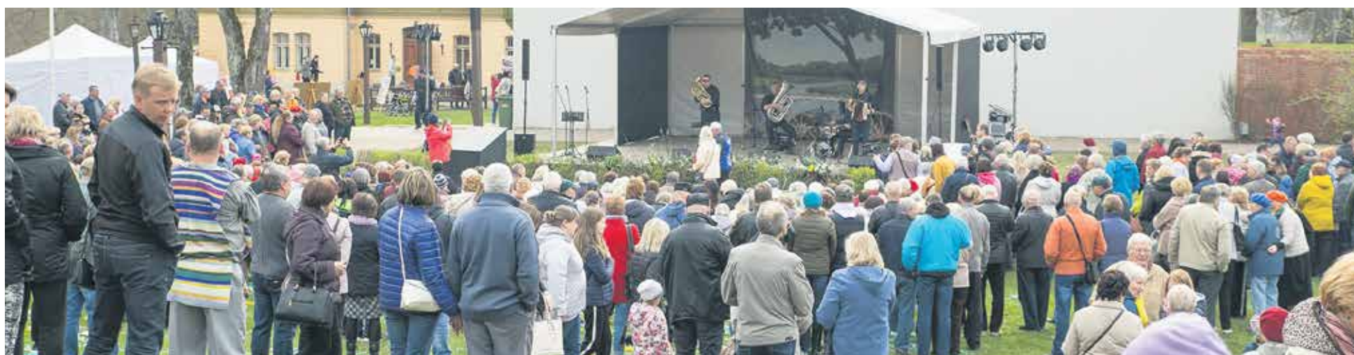
Pasākumā par pozitīvu noskaņu parūpējās pašmāju populārā grupa "Rumbas kvartets".