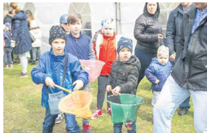
Mazie pasākuma dalībnieki iesaistījās dažādās aktivitātēs un rotaļās.

SIGNETA LAPINA, sabiedrisko attiecību speciāliste