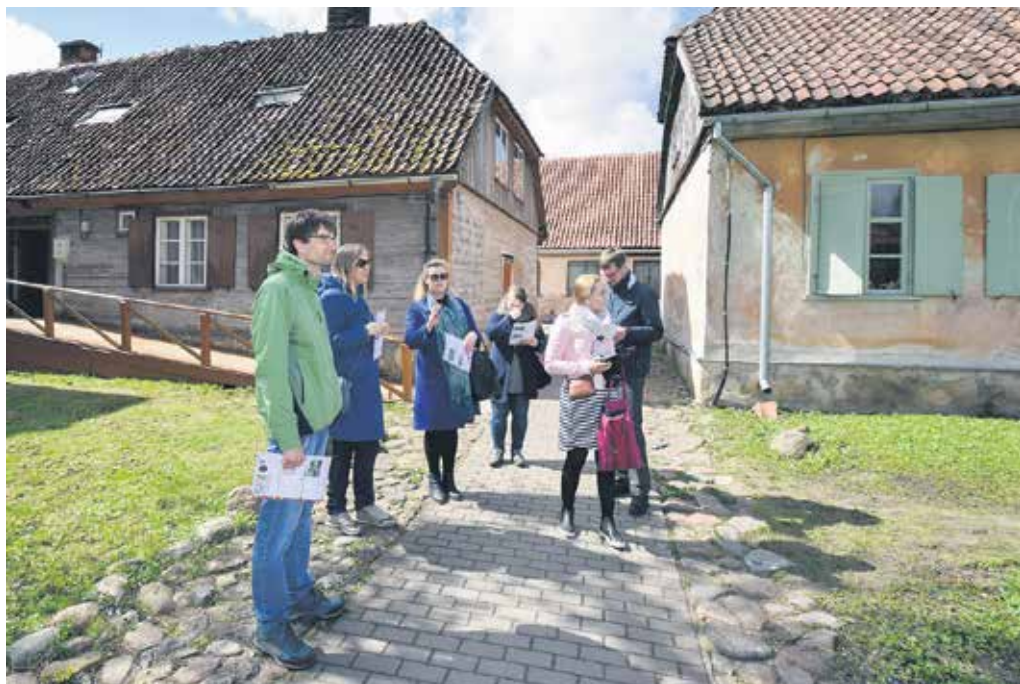
Kultūras mantojuma foruma dalībniekiem bija iespēja pilsētvidē piedalīties dārgumu medību spēlē “Atrodi Vienradzi Kuldīgā”.

rezultātiem var LiviHeri blogā https://liviheri.wordpress.com/ .