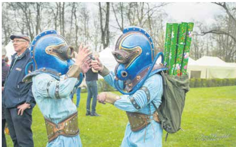
Zivju lidošanas svētkus atklāja franču grupa "Planète Vapeur" ar performanci "Ūdenszāļu pinekļos".

SIGNETA LAPINA, sabiedrisko attiecību speciāliste