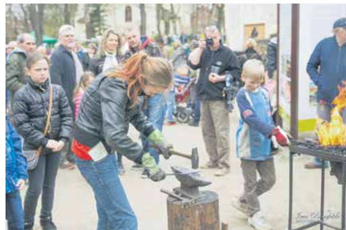
Kalēji aicināja ikvienu iemēģināt roku nagliņu vai krampīšu izkaļšanā.