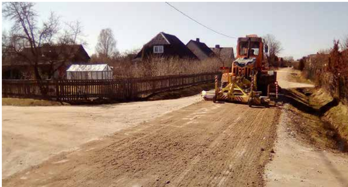
SIA "Kuldīgas komunālie pakalpojumi" uztur kārtībā pilsētas ielas, ceļus un laukumus, kuru kopgarums ir ~79 kilometri. Visvairāk ir grants un melnā seguma ceļi, pēc tam – betona un akmens bruģa.