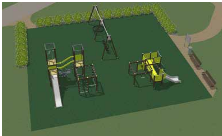
Lai iepriecinātu Priedaines bērnus, šogad pie daudzdzīvokļu mājām "Priedes" taps moderns rotaļu laukums.

Kurmāles pagasta Priedainē šogad plāno vairākus apjomīgus darbus – veikt dubultās virsmas apstrādi Rūpnīcas un Dārzu ceļam, uzstādīt jaunu bērnu rotaļlaukumu, bet SIA "Kuldīgas siltumtīkli" veiks siltumtrases atjaunošanas darbus.