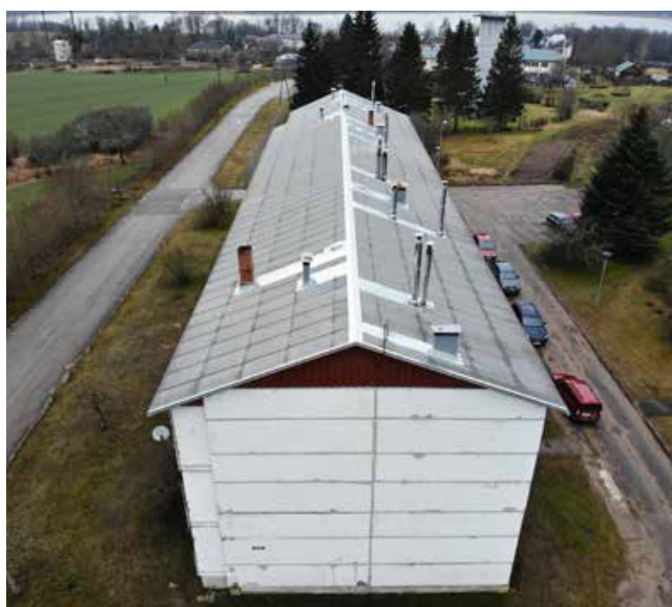
Apsaimniekojamajām daudzdzīvokļu mājām tiek veikti ikdienas uzturēšanas darbi, kā arī apjomīgi remontdarbi – jumtu nomaiņa, fasāžu atjaunošana, skursteņu pārbūve, pagalmu labiekārtošana u.c.