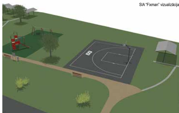
SIA "Fixman" vizualizācija