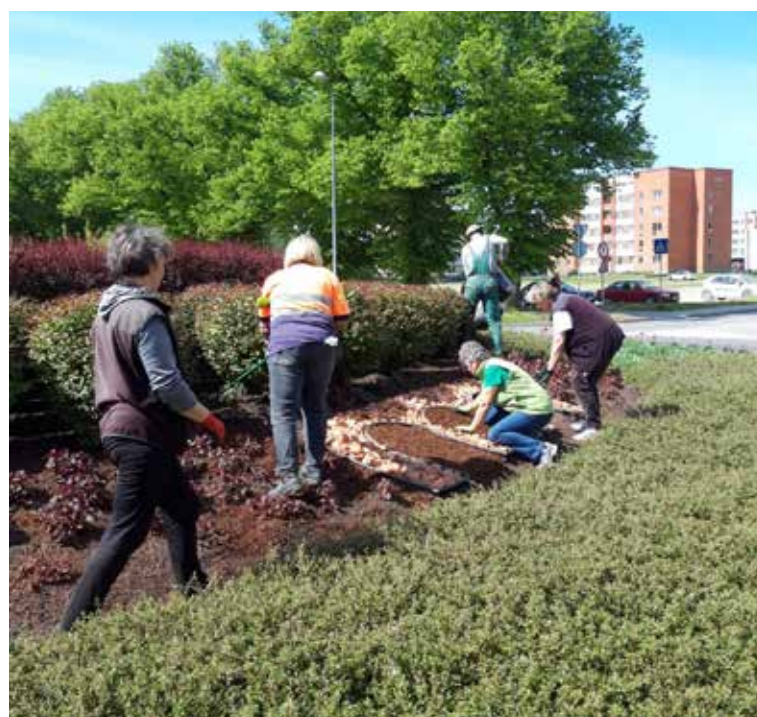
Kuldīga var lepoties arī ar skaistajiem apstādījumiem satiksmes organizācijas apļos. Augi sarkanīgos toņos rotā Mucenieku, Sūru un Aizputes ielas rotācijas apli.