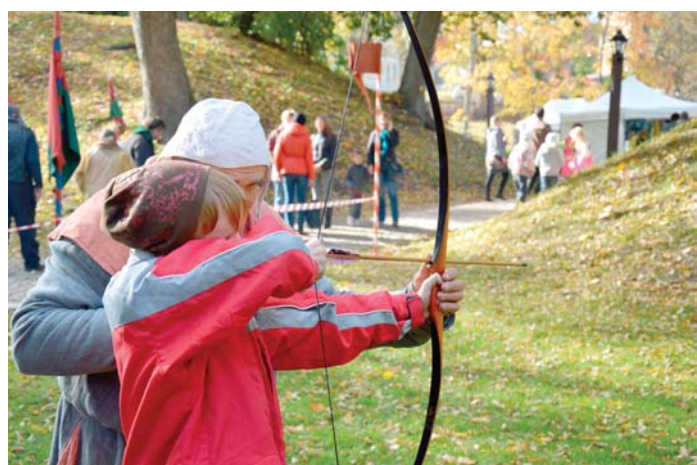
Seno spēļu pagalmā viduslaiku tēlā iejusties un iemēģināt roku loku šaušanā varēja ikviens.