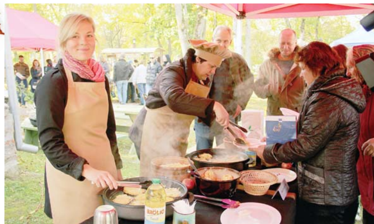
Hercoga Jēkaba tirdziņā Kuldīgas novada pašvaldība par ziedojumiem pircējiem piedāvāja tikko ceptas kartupeļu pankūkas un siltu ābolu sulu.