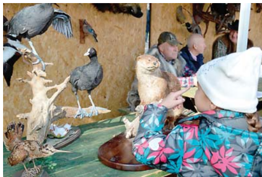
Mednieki dižojās ar trofejām, stāstīja mednieku stāstus un interesentus cienāja ar uzkodām.