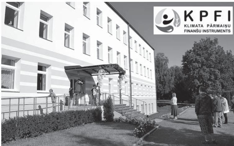
Pelču speciālajā internātskolā-attīstības centrā beigušies vērienīgi būvdarbi, kuru rezultātā nosiltināta ēka, uzstādīta ventilācijas sistēma ar rekuperāciju un nomainīts apgaismojums.

Fasāžu vienkāršotās renovācijas apliecinājuma karti un inženiertīklu vienkāršotās rekonstrukcijas teh-