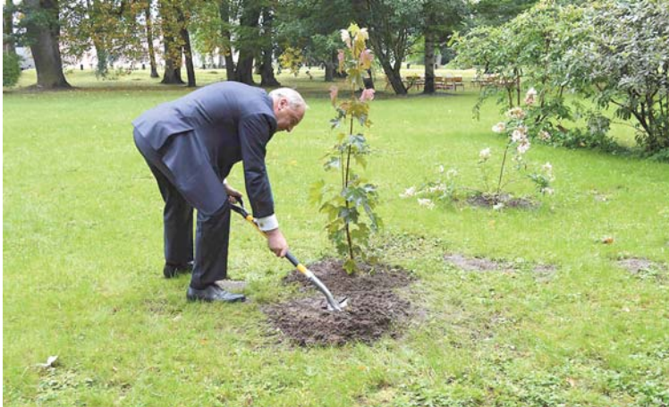
Viesojoties Padurē, Valsts prezidents Andris Bērziņš pie skolas iestādīja kalnu kļavu – kā piemiņu par vizīti.

Skola ir lepna par to, ka prezidents apciemoja tieši viņus. Kuldīgas Alternatīvās sākumskolas Padures filiāles direktora vietniece