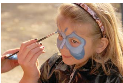
Mazākos gadatirgus dalībniekus priecēja radošās darbnīcas mākslinieki, kuri ar krāsām ļāva tiem iejusties kādā citā tēlā.