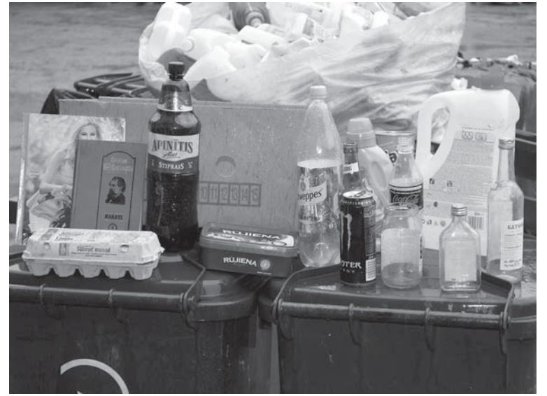
Šķirojamo atkritumu grupā ietilpst plastmasas pudeles, kanniņas, stikla tara, makulatūra, kartons, plēves un visa veida metāls.

SIGNETA REIMANE, sabiedrisko attiecību speciāliste