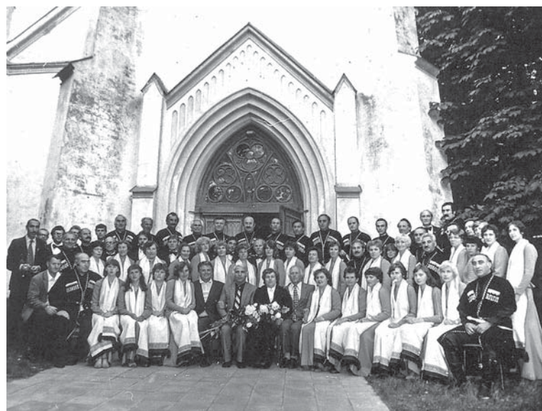
Sadraudzības sākumā 1984. gada 18. jūnijā – jauktais koris „Ventava” kopā ar vīru kori no Mchetas.

Šogad apirt 30 gadu, kopš Kuldīgu un seno Gruzijas galvaspilsētu Mchetu vieno cieša un sirsnīga draudzība, kas aizsākās 1983. gada jūlijā.