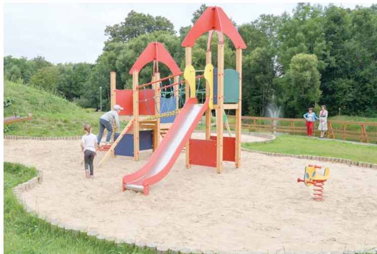
Mazie vārmenieki priecējas un ikdienā aktīvi izmanto mūsdienīgi iekārtoto rotaļu laukumu.

Vārmes pagastā ir aktīva sporta dzīve, nesen nodibināts iecienītākā sporta veida – florbola klubs „Vārme”, un 26. oktobrī būs pirmā mājas spēle. L. Ose pastāstīja: „Florbola klubs ir ļoti aktīvs, cenšamies atbalstīt, cik ir mūsu spēkos, bet ir nepieciešami sponsori.” Treniņi un