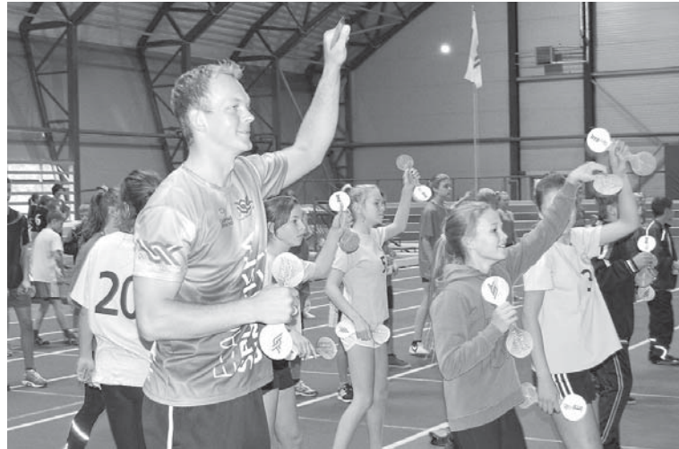
Olimpiskās dienas rīta vingrošanā izcilais volejbolists Jānis Šmēdiņš vingroja kopā ar 400 Kuldīgas novada skolēniem.

Vieglatlētikas manēžā vienkopu rīta vingrošanai pulcējās 400 Kuldīgas novada skolēnu, savukārt stafetēs piedalījās 240 skolēnu no 5. līdz 8. klasei. Stafetes sagatavoja Kuldīgas sporta skolas vieglatlētikas treneri, un tajās piedalījās Kuldīgas Centra vidusskolas, Kuldīgas pamatskolas, Kuldīgas 2. vidusskolas, Pelču speciālās internātskolas-attīstības centra, Kuldīgas Mākslas un humanitāro zinību vidusskolas, Vilgāles, Vārmes, Z.A.Meierovica Kabiles un Laidu pamatskolas audzēkņi.