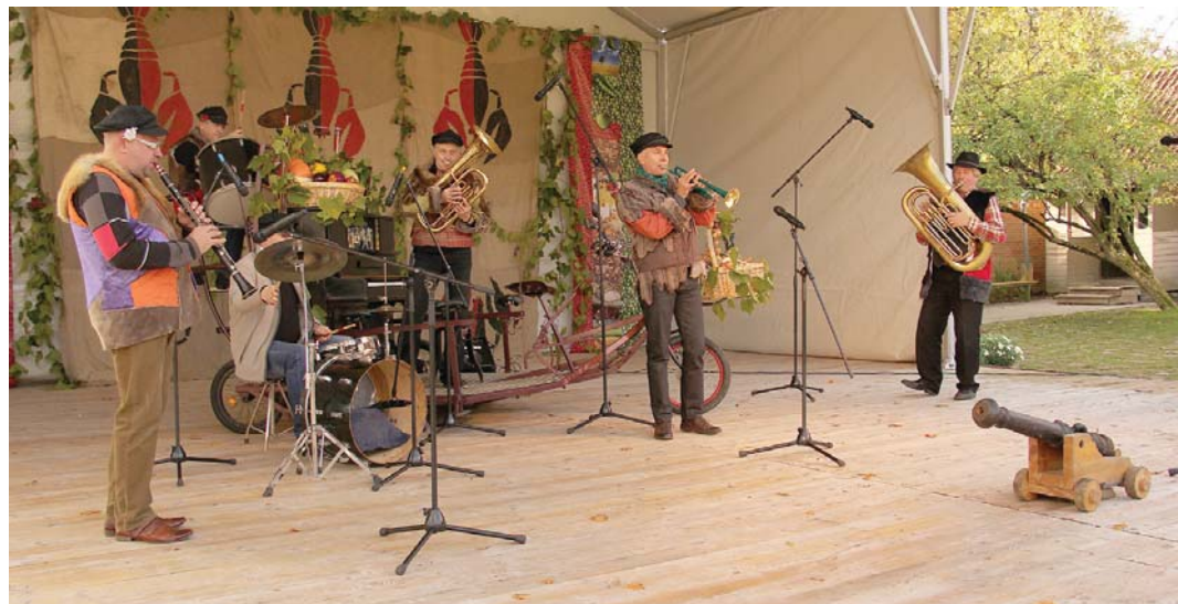
Hercoga Jēkaba gadatirgus atklāšanā spēlēja kapela „Saimniekdēli”.