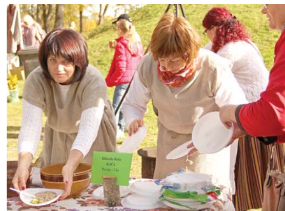
Padures pagasts gadatirgū gatavoja un galdā cēla klētņnieka Kriša koču jeb kūķi, kas ir sen aizmirsts latviešu tradicionālais ziemas ēdiens.