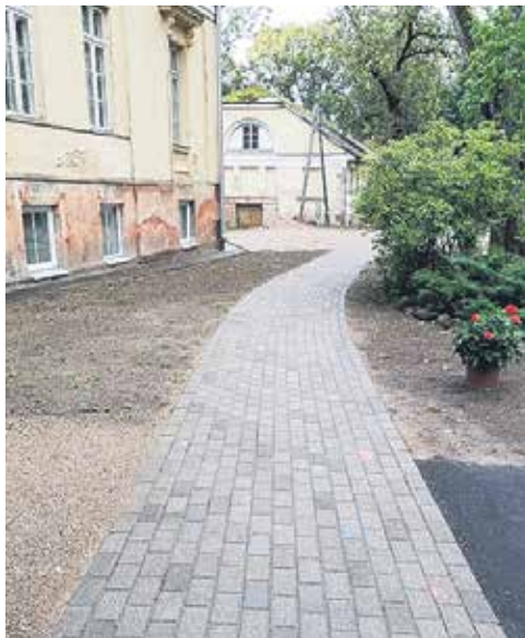
Izmantojot Jelgavas ielas remonta laikā iegūto bruģakmeni, Snēpelē atjaunoti celiņi pie muižas.

Augustā muižas ēkā iekārtotas divas atmiņu klases, kas veltītas Snēpeles skolai. Savukārt ēkas pirmajā stāvā iekārtota baroneses zāļu istaba, baroneses meitas istaba un