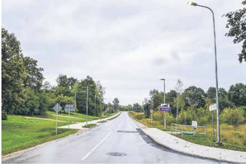
Ventas ciemā Saldus ceļa posmā un Rudupes ielā ierīkots apgaismojums.

Būvdarbus saskaņā ar iepirkuma rezultātiem veica būvfirma SIA "KCE". Kopējās projekta izmaksas, kas ietvēra arī gājēju celiņa izbūvi Saldus ceļa posmā no Stendes ielas līdz Valciņu ielai, ir 66 tūkstoši eiro.