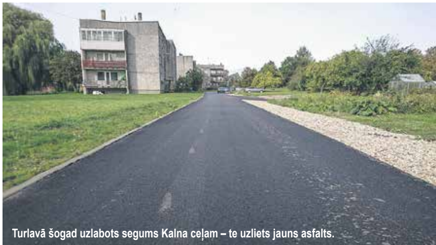
Turlavā šogad uzlabots segums Kalna ceļam – te uzliets jauns asfalts.

KĀRLIS KOMAROVSKIS, sabiedrisko attiecību speciālists