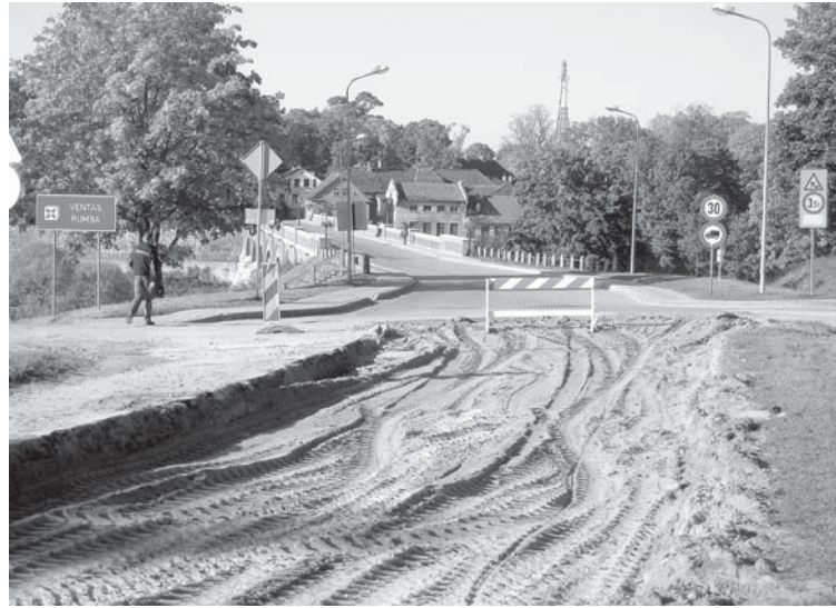
Ūdenssaimniecības rekonstrukcija norisināsies visā Pārventā. Attēlā – būvniecība uzsākta Stendes ielā.

„Redzot, kādas lietusgāzes pie mums ir pēdējos divus gadus, esam pamatoti