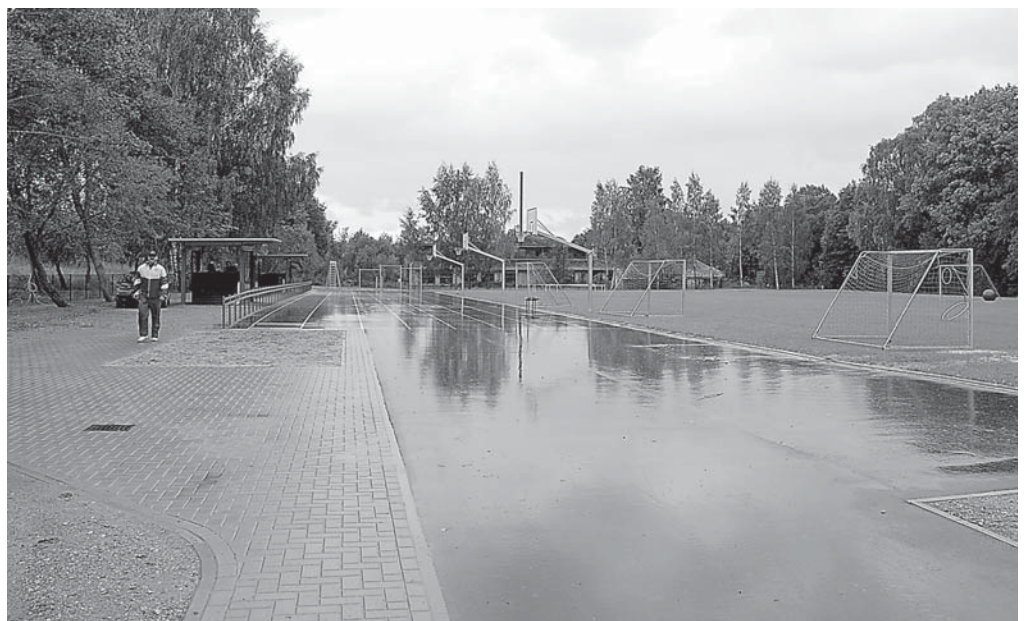
Labiekārtotā teritorija un rekonstruētais stadions nodrošinās Vilgāles pamatskolas skolēniem pilnvērtīgas sporta nodarbības un dažādos aktīvās atpūtas iespējas, kā arī veicinās iedzīvotāju pievēršanos veselīgam dzīvesveidam.

ELFLA EIROPAS LAUKSAIMNIECĪBAS FONDS LAUKU ATTĪSTĪBAI: EIROPA INVESTĒ LAUKU APVIDOS