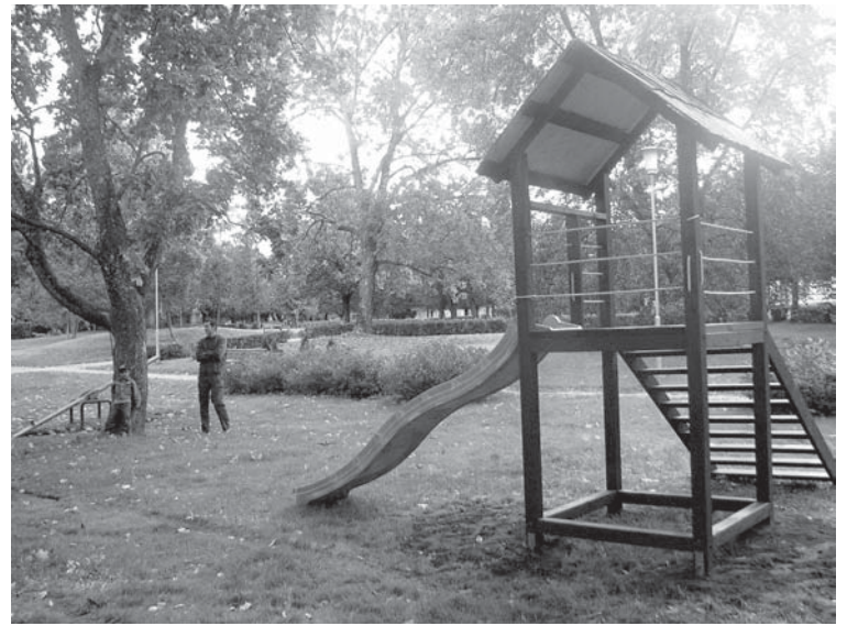
Biedrība „K.P.C.J.” par projektā „Darīsim paši” iegūto finansējumu izveidojusi slidkalniņu bērniem 1905. gada parkā Kuldīgā.