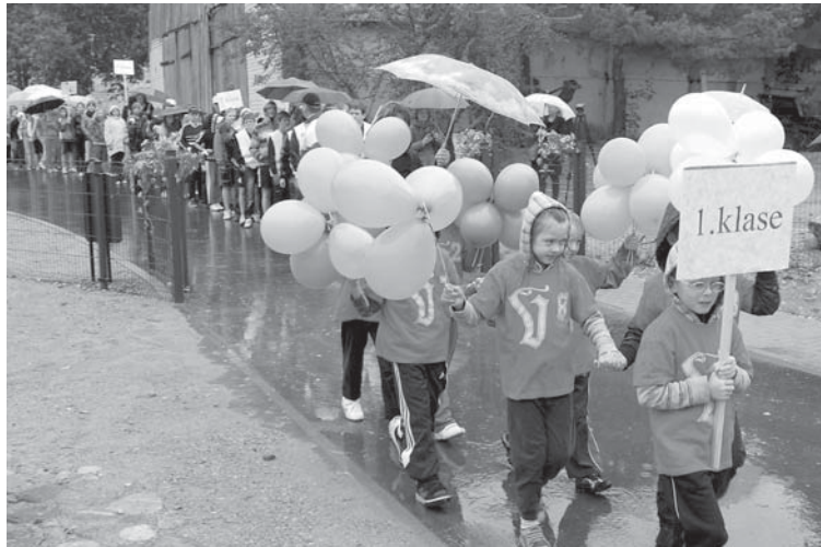
Vilgāles stadiona atklāšanas parādē priecīgi satraukti devās Vilgāles pamatskolas skolēni un skolotāji.