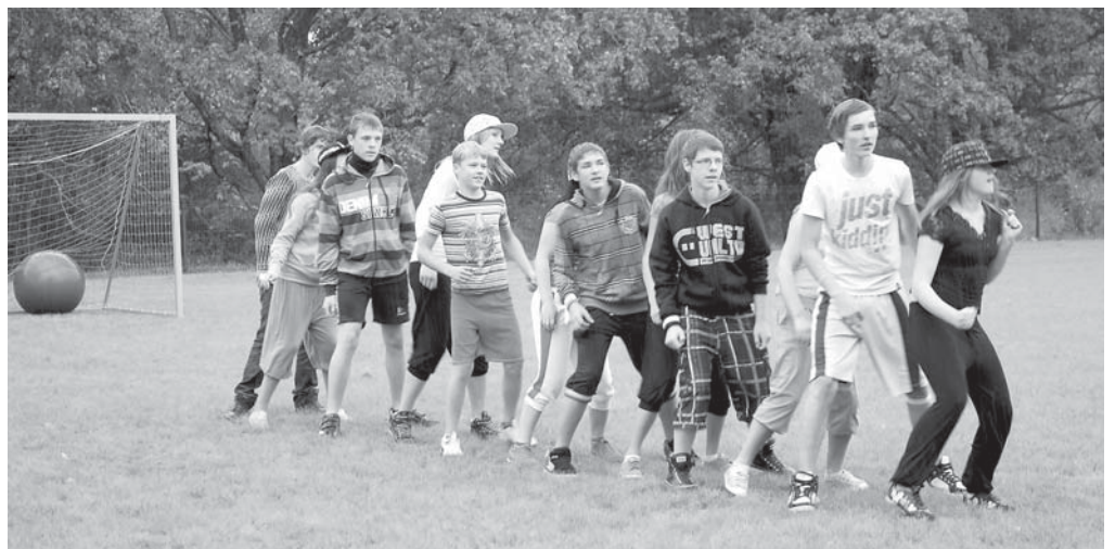
Vecāko klašu skolēni klātesošajiem, spītējot lietum un aukstumam, sniedza atraktīvu priekšnesumu.

Nākamgad šajā stadionā notiks Kuldīgas novada vasaras sporta spēles.