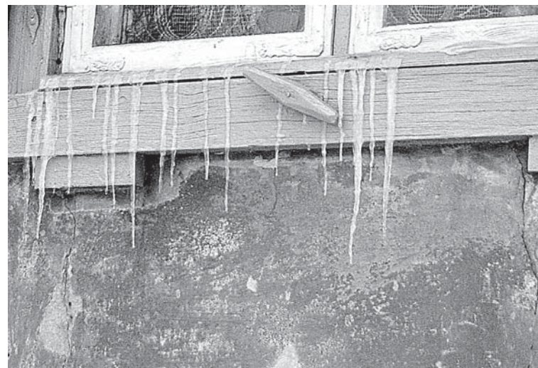
Attēlā redzams sadzīves režīms vēsturiskā ēkā, kas radījis mājai problēmas. Par tām liecina lāstekas pie logiem un mitrā fasāde zem tiem.

Lai uzlabotu telpu siltumnoturību, Kuldīgas vecpilsētā ēkām jau vēsturiski veidoti dubultlogi, kā arī logi ar atsevišķi ieliekamām iekšējā loga vērtņēm. Sākot ēku apsildīt, jāizvērtē ziemas vērtņu stāvoklis, jo šī ir loga daļa, kurai jābūt hermētiski visblīvāk noslēgtai. Iekšējā loga vērtne būtu jāblīvē, jo tad tā nodrošinātu gan siltuma noturību telpās, gan to, ka sil-