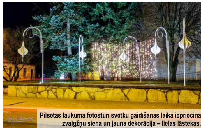
Pilsētas laukuma fotostūrī svētku gaidīšanas laikā iepriecina zvaigžņu siena un jauna dekorācija – lielas lāstekas.

Kuldīgā tradicionāli ir divas svētku egles – viena no tām tiek izrotāta Kuldīgas vecpilsētas sirdī – Rātslaukumā, bet otra – Pilsētas laukumā. Abas svētku egles rotātas, izmantojot gan agrākos gados sarūpētus, gan jaunus dekorus.