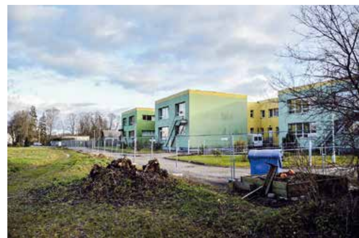
Pie bērnudārza "Bitīte" būvē automašīnu stāvvietu, kur varēs novietot 27 automašīnas.

Tāpat paredzēts izbūvēt divus papildus vārtus nokļūšanai izglītības iestādes teritorijā. Būvdarbus veiks būvfirma SIA "AB būvniecība".