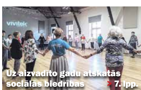
Uz aizvadīto gadu atskatās sociālās biedrības ▶ 7. lpp.