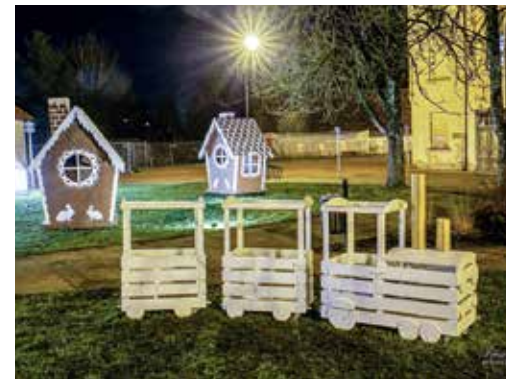
Skvērā pie Kuldīgas kultūras centra izvietotas piparkūku mājiņas, laternas un dekoratīvs vilcieniņš.

Parkos izgaismoti un ar lampiņām apvīti koki. 1905. gada parkā svētku noskaņu rada milzu dāvanas. Dekorācijas, kā ierasts, atrodas arī abos rotācijas apļos. Skvērā pie Kuldīgas kultūras centra izvietotas piparkūku mājiņas, laternas un dekoratīvs vilcieniņš, bet pie Svētās Katrīnas baznīcas – Betlēmes ainiņa. Pirmoreiz ar lieliem vainīgiem svētkiem ir saposts vecais tilts. Jauns akcents – gaismas koks – atrodas pie Kuldīgas peldbaseina.