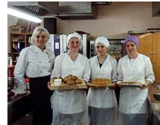
Pieaugušo personu maiznieku profesijas diplomandi pirms kvalifikācijas eksāmena 2020. gadā.