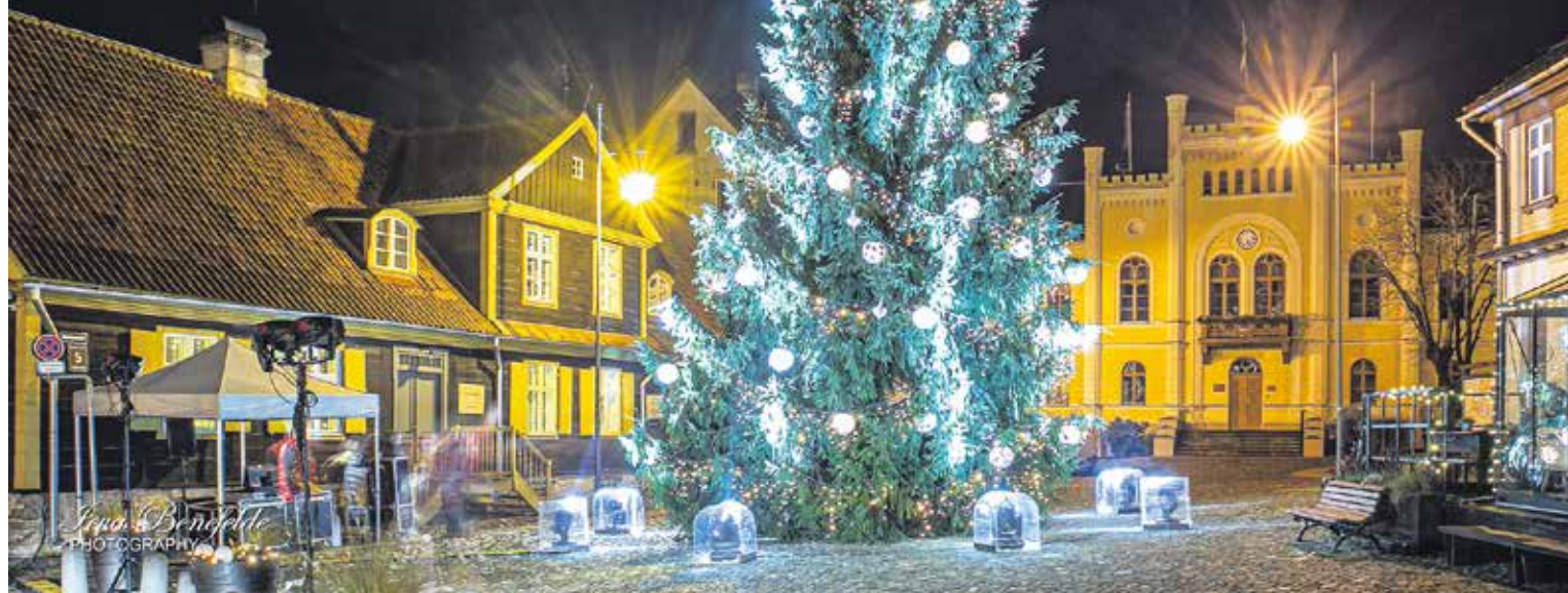
Rātslaukumu šogad rotā 16 metrus augsta egle, ko Kuldīga saņēma dāvinājumā no AS "Latvijas valsts meži". Egle izrotāta gaišā, vieglā tonalitātē, izmantojot pērn izgatavotās egļu bumbas, gaišas lampiņu virtenes, ko papildina jauni dekorī "lāstekas".

Kuldīga ir iemirdzējusies Ziemassvētku gaismās. Svētku rotājumi izvietoti gan jau ierastajās, gan jaunās vietās.