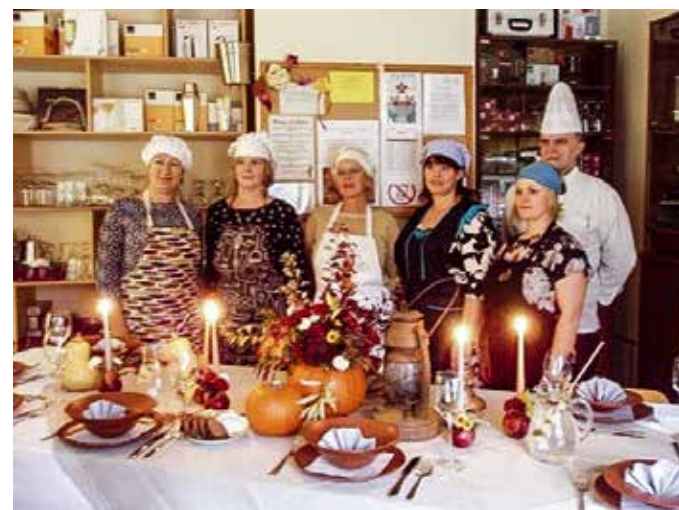
Nodarbināto personu 40 stundu vakara kursu "Latvisko ēdienu gatavošanas tradīciju saglabāšana" noslēgums Rojas grupai 2019. gada rudenī.

hāniķis" un "Spēkratu atslēdznieks", dodot iespēju specializēties militāro spēkratu vai kravas auto remonta un diagnostikas apguvē.