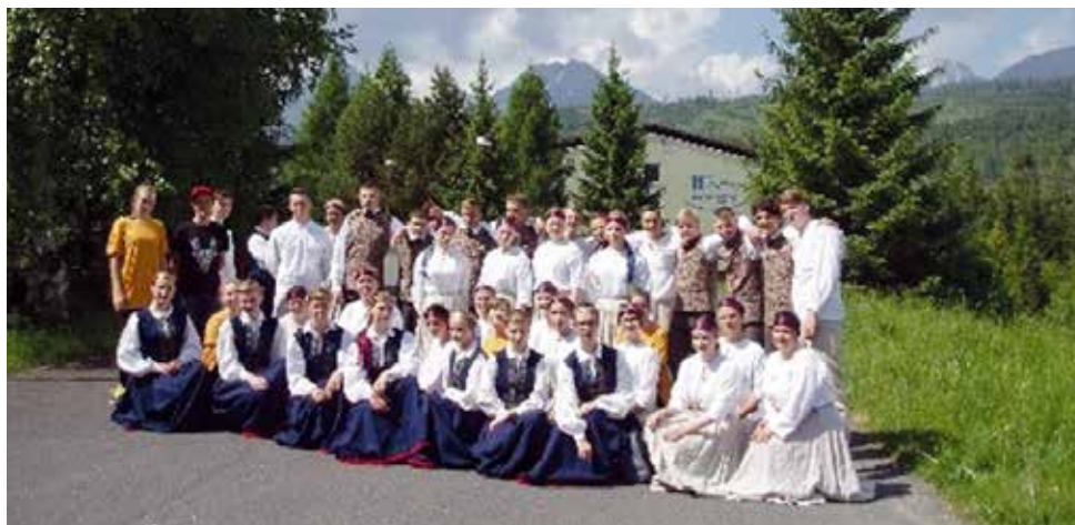
Tehnikuma deju kolektīvi un koris vieskoncertos Augstajos Tatros Slovākijā 2019. gadā.

Sadarbībā ar Latvijas Zemesardzes 4. Kurzemes brigādi un SIA "Volvo Truck Latvija" 2020. gadā izveidota Latvijā jauna izglītības programma profesijās "Spēkratu me-