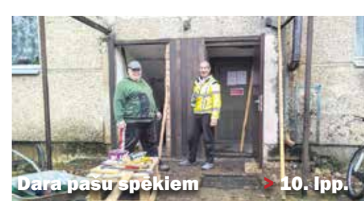
Dara pasu spēkiem ▶ 10. lpp.