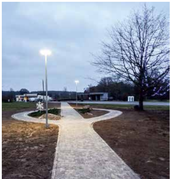
Rendenieku ērtībai centrā tapis jauns celiņš.