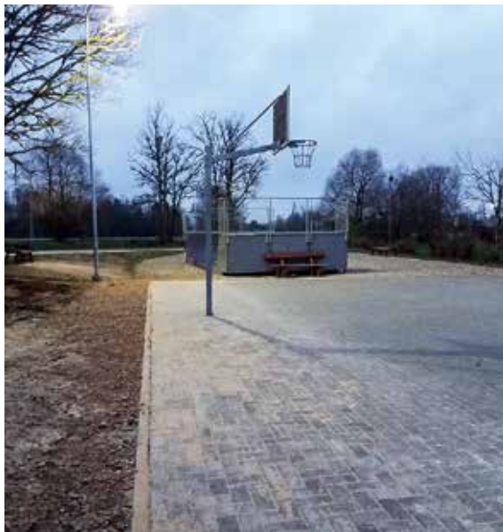
Rendā nedaudz pagarināts basketbola laukums un pie tā uzstādīta laterna, lai jaunieši vakaros varētu spēlēt.

Novembra izskaņā Rendas pagasta pārvalde iepriecinājusi iedzīvotājus ar centrā izbūvētu gājēju celiņu un diviem jauniem gaismekļiem.