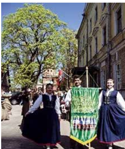
Deju kolektīvs "Sintēze" 2019. gadā.