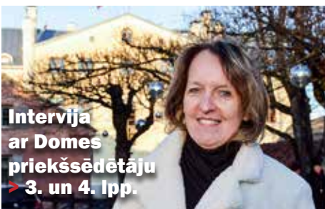
Intervija ar Domes priekšsēdētāju ▶ 3. un 4. lpp.