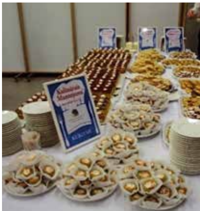
Tehnikuma audzēkņu darbu prezentācija kulinārā mantojuma tīklā starptautiskajā izstādē Rīgas Tehniskajā universitātē 2019. gadā.