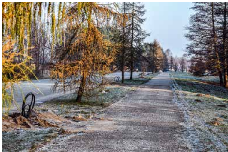
Uzklusot iedzīvotāju ieteikumus un lūgumus, Lapegļu ielā no Piltenes līdz pat Ēdoles ielai, kā arī Skuju ielā pie garāžu kooperatīva "Venta" ierīko apgaismojumu, lai izgaismotu gājēju ietvi un uzlabotu pārvietošanās apstākļus.

Kopumā šeit ierīkos 25 apgaismojuma balstus – 21 Lapegļu ielas posmā, bet četrus – Skuju ielā. Šonedēļ noslēgsies zemes darbi, bet pēc tam pakāpeniski uzstādīs apgaismojuma