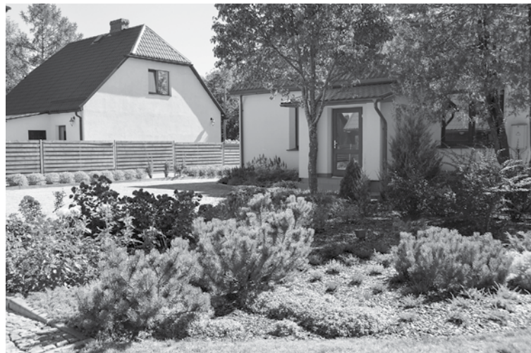
Pagājušajā gadā nominācijā „Ģimeņu māju teritorija Kuldīgas pilsētā” 1. vietu ieguva Janušu ģimenes īpašums.

Nominācijās „Skaistākais Kuldīgas dārzs”, „Sakoptākais daudzdzīvokļu māju pagalmis” un „Sakoptākais uzņēmums Kuldīgas pilsētā” uzvarētāji saņems naudas balvas un atzinības rakstus: 1. vieta – EUR 150 un atzinības zīmi „Skaistākais