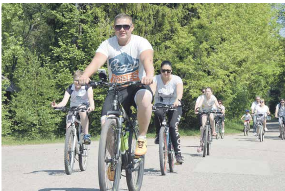
Dienas velobraucienā šogad piedalījās 1500 dalībnieku, veicot kādu no trīs maršrutiem un pildot uzdevumus īpašajās pieturās.

Dižbalvu – „Kenzel Cruiser” velosipēdu, kuru dāvāja veloAtlai-