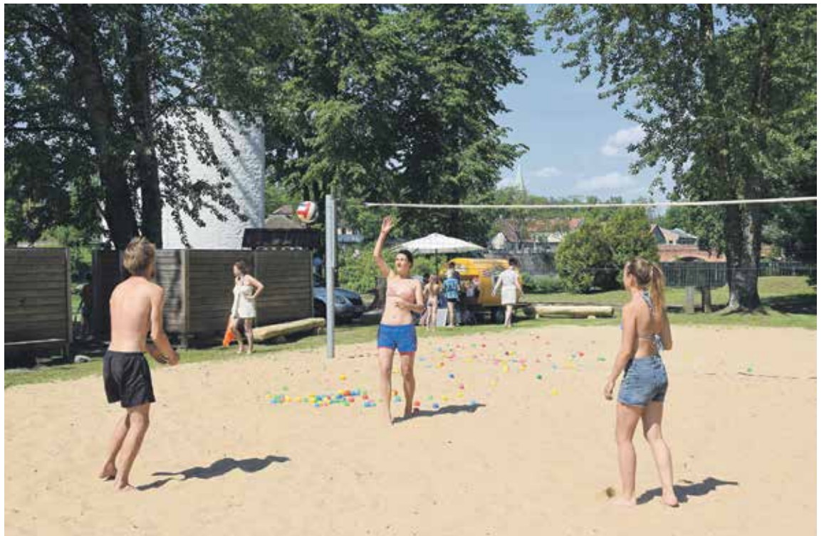
▲ Mārtiņšalas peldētavā ir izveidots volejbola laukums.

Par godu Starptautiskajai bērnu aizsardzības dienai, Valsts policija bija sagatavojusi izziņošanas un radošas nodarbes. Bērni varēja apgūt satiksmes noteikumus un drošību uz ceļa, ietvēm un krustojumos, apskatīt un pasēdēt uz policijas dienesta motocikla. Apbalvoja arī zīmējumu konkursa „Mana drošā vasara” labākos autorus. Kinologs demonstrēja dienesta suņa paklausību komandām, savukārt Valsts ugunsdzēsības un glābšanas dienests – aprīkojumu, pareizu cietušā glābšanas tehniku uz ūdens, stāstīja, kas jādara, kad cilvēks izvilkts no ūdens. Valsts ugunsdzēsības un glābšanas dienesta Skrundas