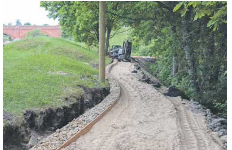
Šobrīd notiek taciņas un apgaismojuma izbūve uz peldētavu, lai tā būtu ērti pieejama ikvienam.

Starptautiskajā bērnu aizsardzības dienā, 1. jūnijā, sakoptajā Mārtiņšalas peldvietā, skatot bērnu smiekliem, čalām, dziesmām un dejām, jau septīto gadu pacēla Zilo karogu, vienlaikus oficiāli atklājot peldēšanas sezonu.