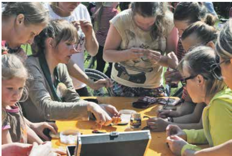
Bērnu un jauniešu centra nodrošinātajā pieturā Mežvaldē interesenti veidoja latviskas rokassprādes.

Kuldīgas velofestivāls, kas ir lielākais nekomerciālais velofestivāls Latvijā, notika 28. maijā un vienkopus pulcēja daudz pozitīvi noskaņotu riteņbraucēju entuziastus.