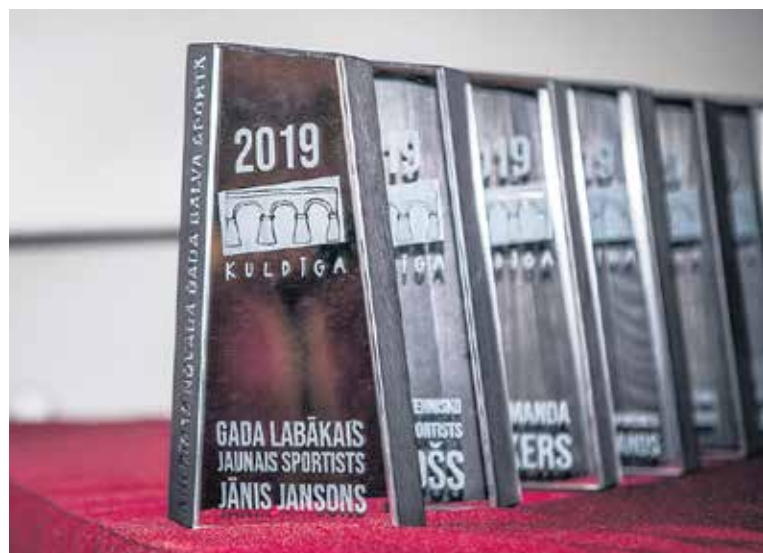
28. decembrī Kuldīgas kultūras centrā norisinājās svinīgais pasākums "Gada balva sportā 2019", kurā balvas tika sadalītas 11 dažādās nominācijās.