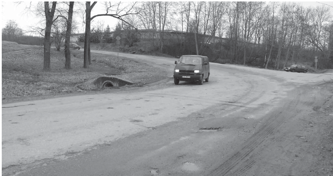
Jau gada beigās Lapegļu un Virkas ielas trīszaru krustojums ar gājēju ietvēm būs drošāks un patīkamāks visiem satiksmes dalībniekiem.