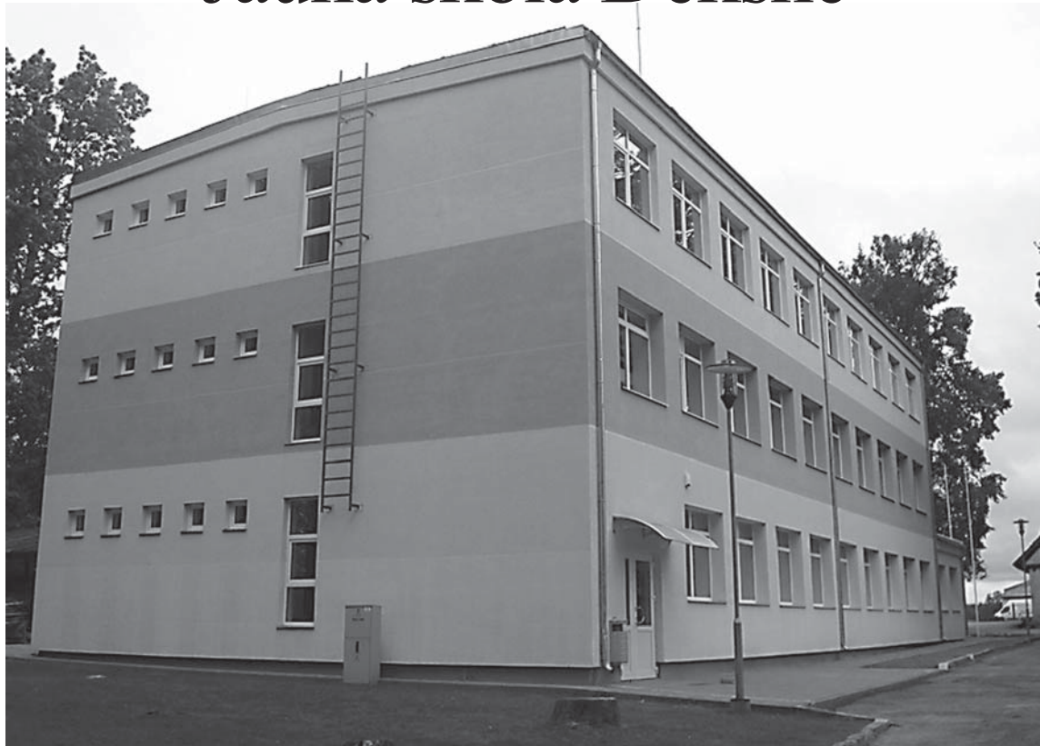
Tira un saposta savus audzēkņus gaida Kuldīgas Alternatīvās sākumskolas Padures filiāle.

Sākot ar 2012. gada 1. septembri, Kuldīgas Alternatīvās sākumskolas Padures filiāle strādās Padures pagasta Deksnē, „Pagastmājā”.