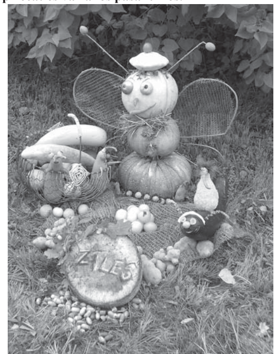
Foto no izstādes pagājušogad.