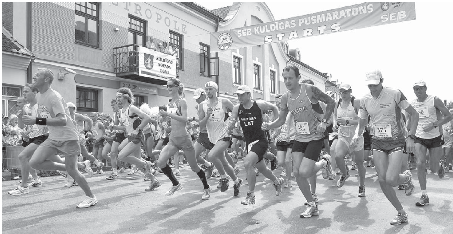
Paldies visiem skrējējiem, kas piedalījās 5. SEB Kuldīgas pusmaratonā! Paldies visām iesaistītajām personām un organizācijām, kas palīdzēja noorganizēt skrīšanas svētkus Kuldīgā!