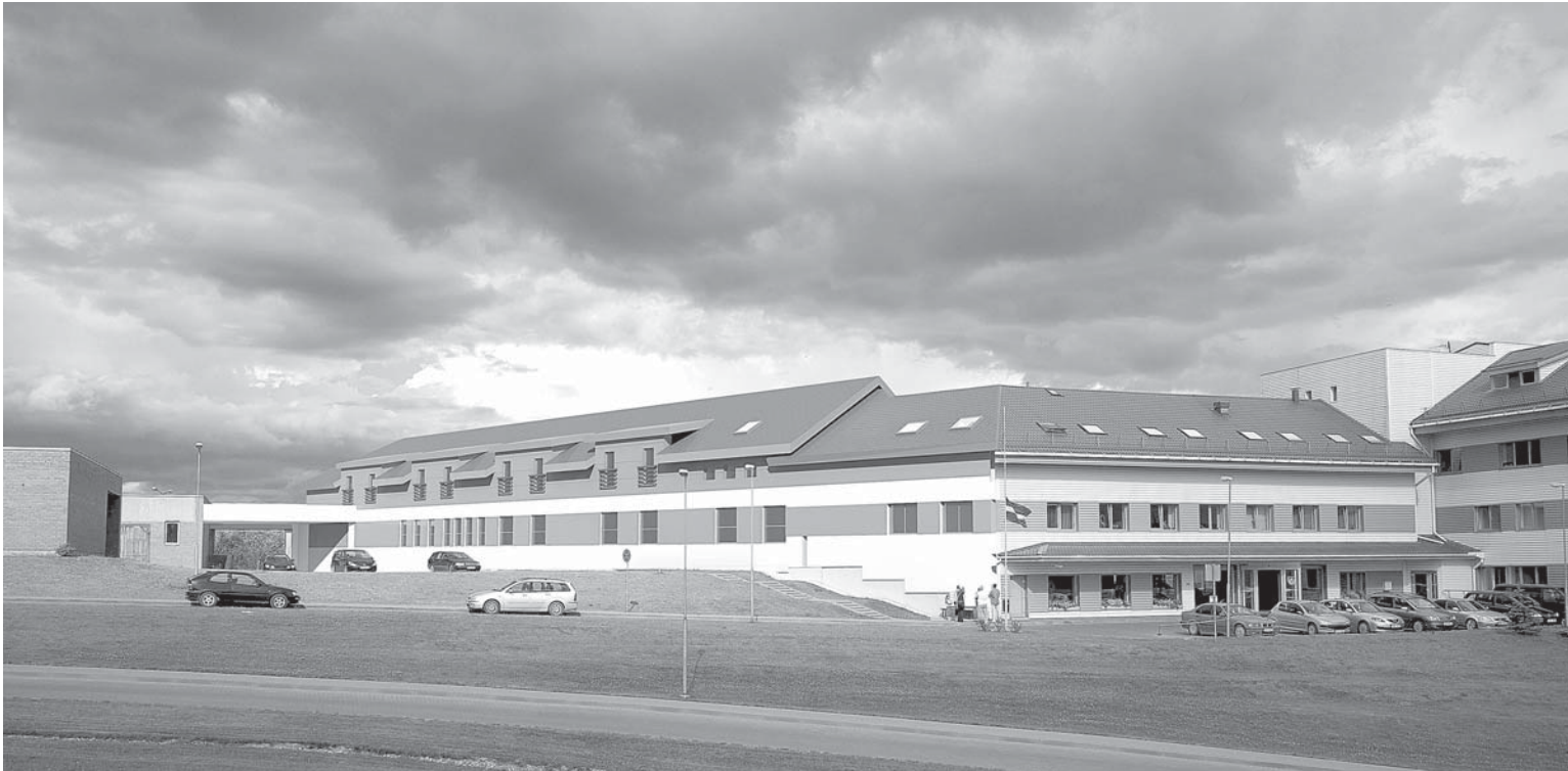
Vizualizācija. Jaunā rehabilitācijas nodaļa Kuldīgas slimnīcā, Aizputes ielā 22, būs izvietota divos stāvos un atradīsies esošā saimniecības korpusa vietā.

Rehabilitācijas nodaļā būs 20 gultas vietas, šajā nodaļā ikvienam iedzīvotājam būs pieejami ambulatorie pakalpojumi. Tur tiks izvietotas telpas fizioterapeitam – kabinetam, vingrošanas zāle, kurā atradīsies zemūdens masāžas vanna, hidromasāžas baseins un vingrošanas baseins, telpas ergo-