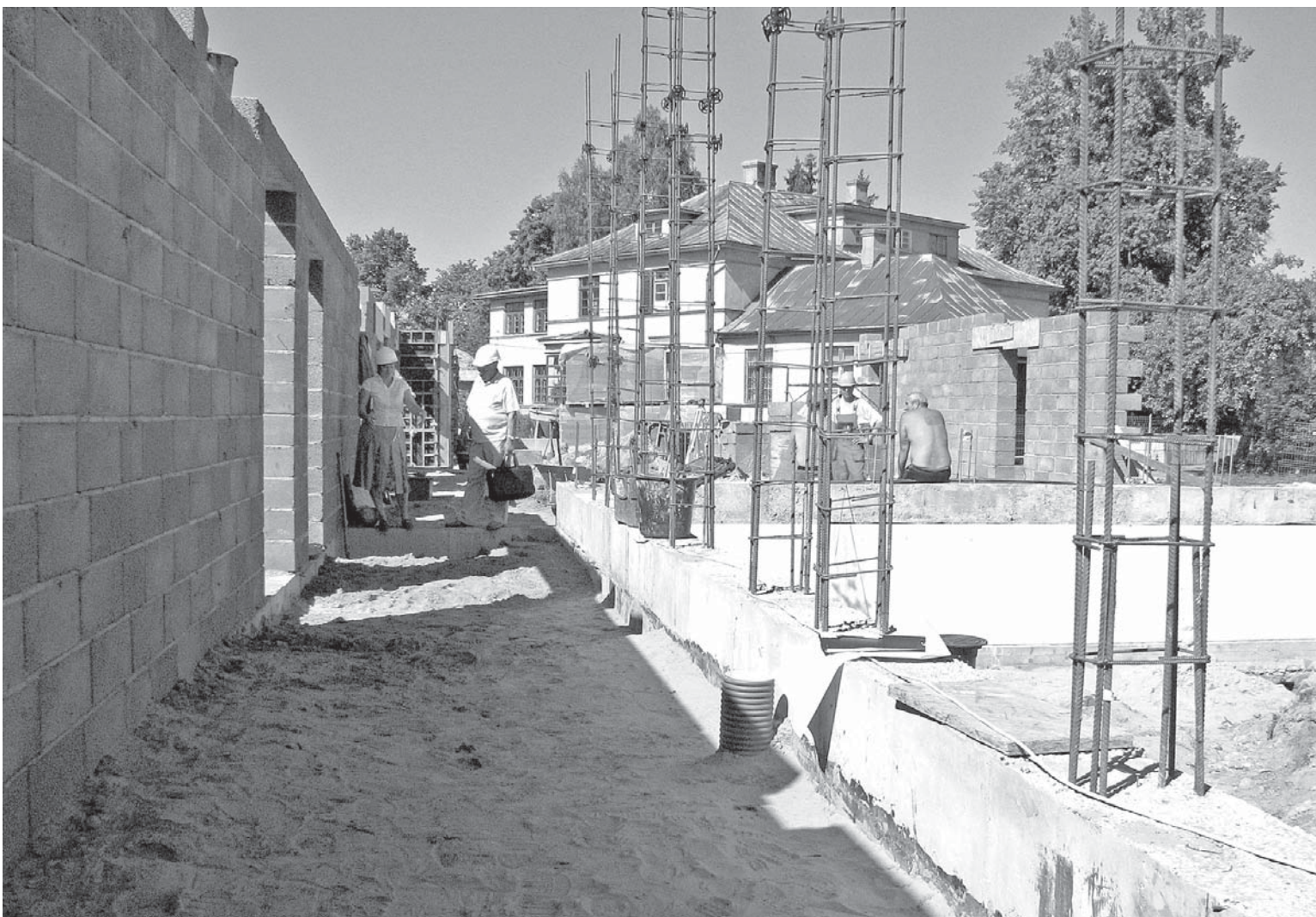
Lai pabeigtu „Ābelītes” būvniecību līdz 15. decembrim, pašvaldība regulāri kontrolē būvniecības gaitu. Tiek darīts viss iespējams, lai pirmsskolas izglītības iestāde līdz šim laikam tiktu pabeigta.

Piecus un sešus gadus vecie bērni, kopā trīs grupiņas, apmeklē