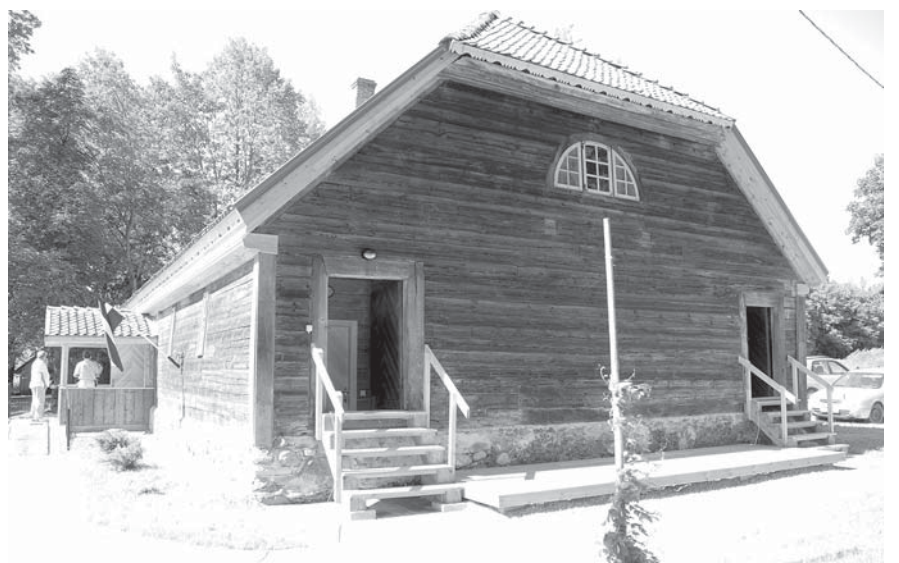
Skaisti atjaunotajā ēkā viena ieeja no gala ved uz saimnieciskajām telpām (pa kreisi), otra – uz muzeju (pa labi).