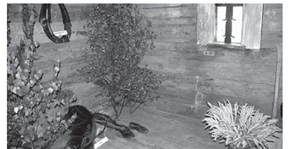
Interesenti muzejā var apskatīt vēsturiskas zirglietas.