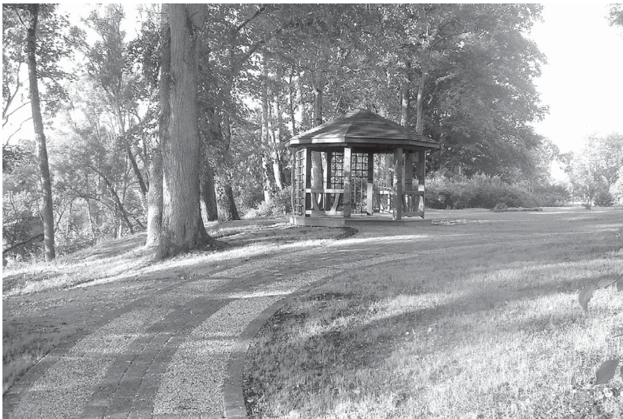
Projekta ietvaros izveidota lapene, nobruģēti gājēju celiņi, braucamā daļa un stāvlaukumi, ierīkoti 15 soliņi parkā, apgaismes ķermeņi, atkritumu tvertnes, iekārtota ugunsкура vieta, kā arī atjaunots zāliens. Savukārt apstādījumos iestādītas hortenzijas, klinšrozītes un klājeniskās rozes – baltas un sarkanas.