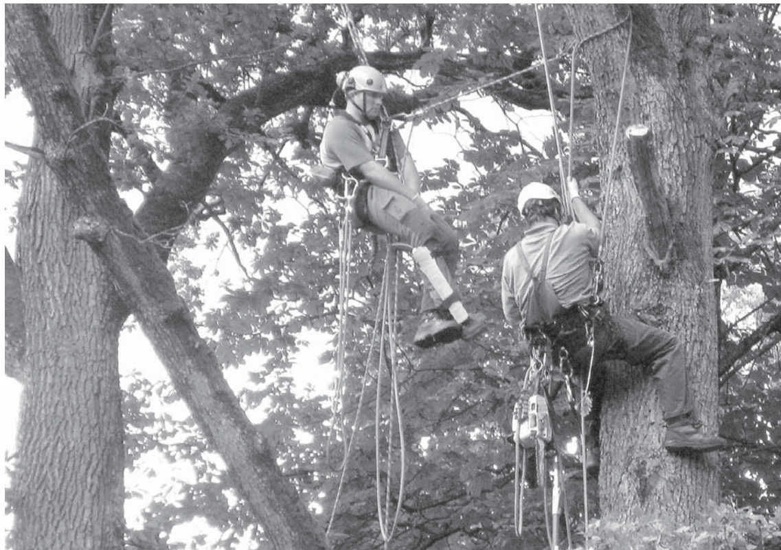
Arboristi Pils dārzā kokiem izzāgē sauos zarus.

parkā apskata un lem par katru bīstamu koku. Izzāgējot atsevišķus bīstamus zarus, riskantos kokus iespējams saglabāt vairākus gadus, kamēr tos būs nomainījuši jaunāki koki.