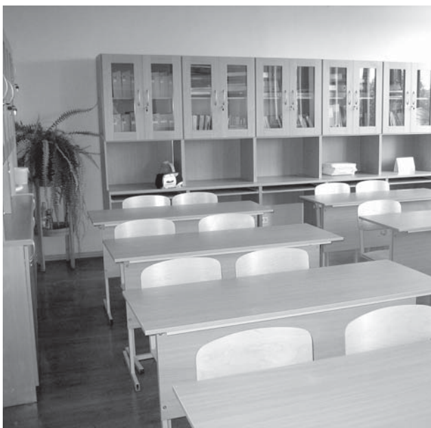
Kuldīgas Centra vidusskolā audzēkņu un pedagogu rīcībā no 1. septembra būs mūsdienīgi aprīkoti dabaszinību kabineti.

Kuldīgas novada pašvaldības izveidota komisija no 16. līdz 25. augustam apmeklēt novada izglītības iestādes un vērtēt to gatavību uzņemt audzēkņus jaunajā mācību gadā.