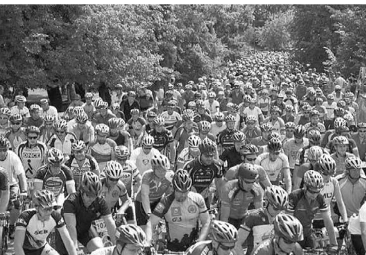
Kuldīgā norisināsies SEB MTB maratona 5. posms, kas brauciena dalībniekus trasē pārsteigs ar reljefu, grants segumu, ūdens šķērslī un šaurajām taciņām.

Pēc neilga pārtraukuma Latvijas lielākais kalnu riteņbraukšanas sacensību seriāls – SEB MTB maratons – atgriezies Ventas krastos, 27. jūlijā šeit notiks piektais no septiņiem posmiem.