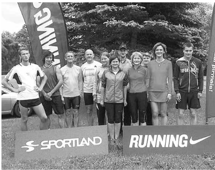
Skrējēji ik ceturtdienu tiekas, lai kopīgi gatavotos 9. Kuldīgas pusmaratonam.

Ikviens skriešanas entuziasts aicināts pievienoties koptreniņiem, lai labāk sagatavotos Kuldīgas pusmaratonam 9. augustā.