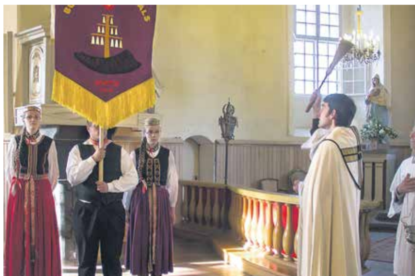
Alsungas baznīcā tika iesvētīts Burdona festivāla karogs. Tas ir roku darbs, kurā āžrags un tridekšnis simboliski veido laivu, kas saved kopā ļaudis.