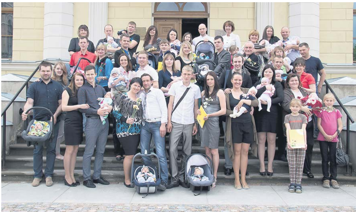
Martā un aprīlī novadā dzimušie mazuļi ar vecākiem, brālīšiem, māsiņām un draugiem tika aicināti uz svinīgu pasākumu Kuldīgas novada Domē, lai saņemtu sudraba karotītes ar iegravētu novada ģerboni.