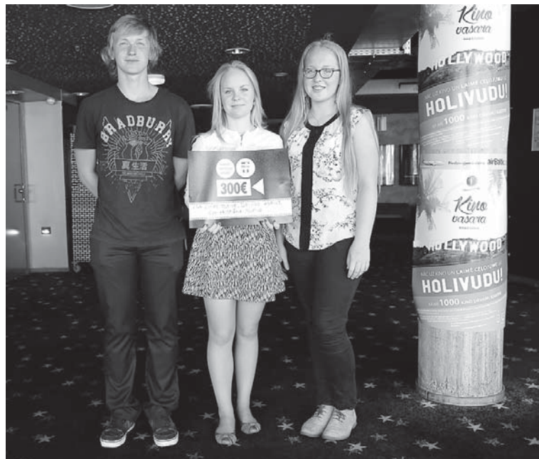
V.Plūdoņa Kuldīgas ģimnāzijas 10. klases skolēni, radot atraktīvu un provokatīvu video sižetu, guva uzvaru CSDD reklāmas konkursā „Dusmīgs, toties dzīvs”.

Uzvarētāji saņēma naudas balvu, kā arī iespēju īstenot savu reklāmas ideju kopā ar profesionālu reklāmas aģentūru. Uzvarējušais klips piedzīvoja pirmizrādi uz „Forum Cinemas” lielā ekrāna un apskatāms arī internetā: youtube.com/user/CSDDLatvia, kurā redzami arī pārējie konkursam