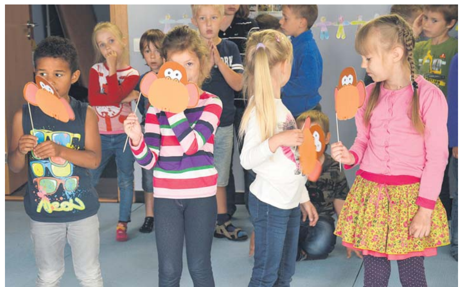
Nometnes dalībnieki angļu valodu apgūst darbojoties radoši – dziedot, zīmējot, dejojot un spēlējot teātri.