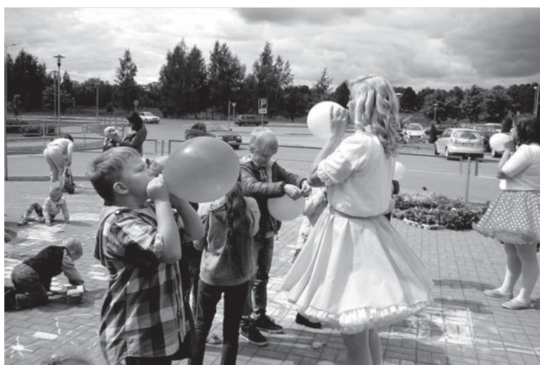
Kooperatīvs „Kuldīgas labumi” maija nogalē aicināja ģimenes piedalīties Bērnu dienas pasākumā – izklaidēties kopā ar kļauņu un nobaudīt vietējo mājražotāju lauku labumus.