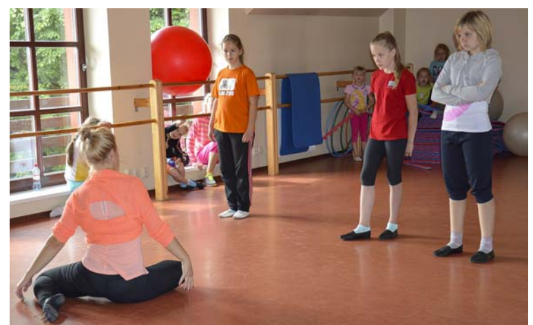
Nometnes „Ielecām vasarā” dalībniekiem deju stundas pasniedza profesionāli pasniedzēji, turklāt bērniem bija iespēja apgūt astoņus deju veidus un citas fiziskas aktivitātes.

das deju veidus – zumbu, klasiku, ritmiku, moderno baletu, capoeira, hip-hop, „break dance”, „show dance”, kā arī ķermeņa nostādīšanu, aktiermeistarību, improvizāciju. Nometnes dalībnieki bija no dažādām izglītības iestādēm. Bērnu apmācīja vairāki pedagogi