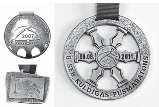
Tiek kaldināta medaļa, kuru Kuldīgas pusmaratonā tradicionāli piešķir katram dalībniekam, kurš noskrien 21 km garo distanci.

Jāpiebilst, ka ir vairāki desmiti cilvēku, kuri piedalījušies visos Kuldīgas