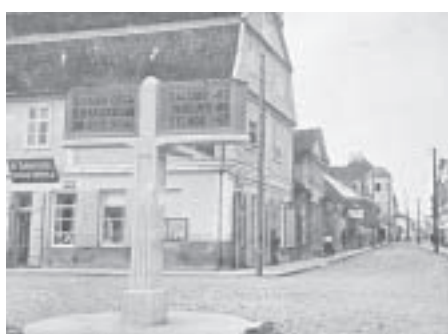
POPULARIZĒS VECPILSĒTU 2. LPP.