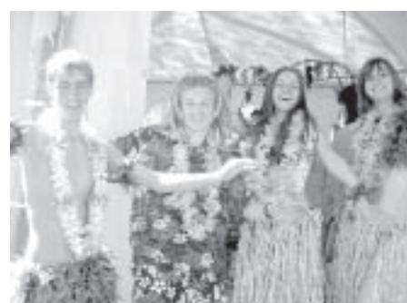
SVĒTKI "DZĪRES KULDĪGĀ" 4. LPP.