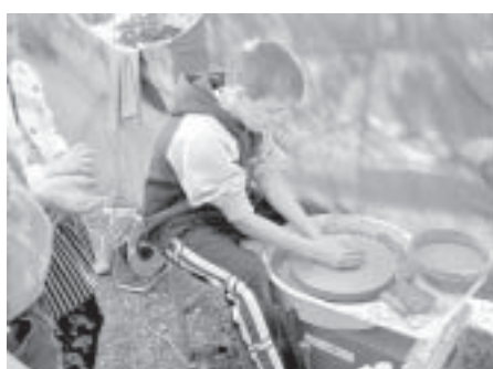
"TU VARI TO!" 2. LPP.