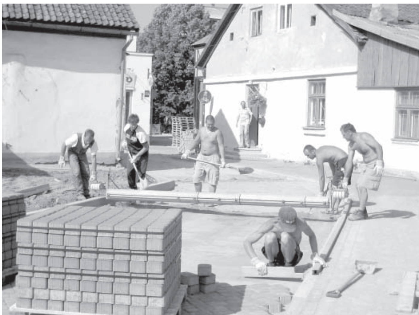
Šovasar rekonstruētie divi Šaurās ielas posmi ļaus kuldīdzniekiem un pilsētas viesiem ērtāk piekļūt transportam slēgtajai gājēju ielai – Liepājas ielai. Darbus pēc pašvaldības SIA "Kuldīgas Komunālie pakalpojumi" pasūtījuma veic vietējās firmas "AVA" strādnieki.