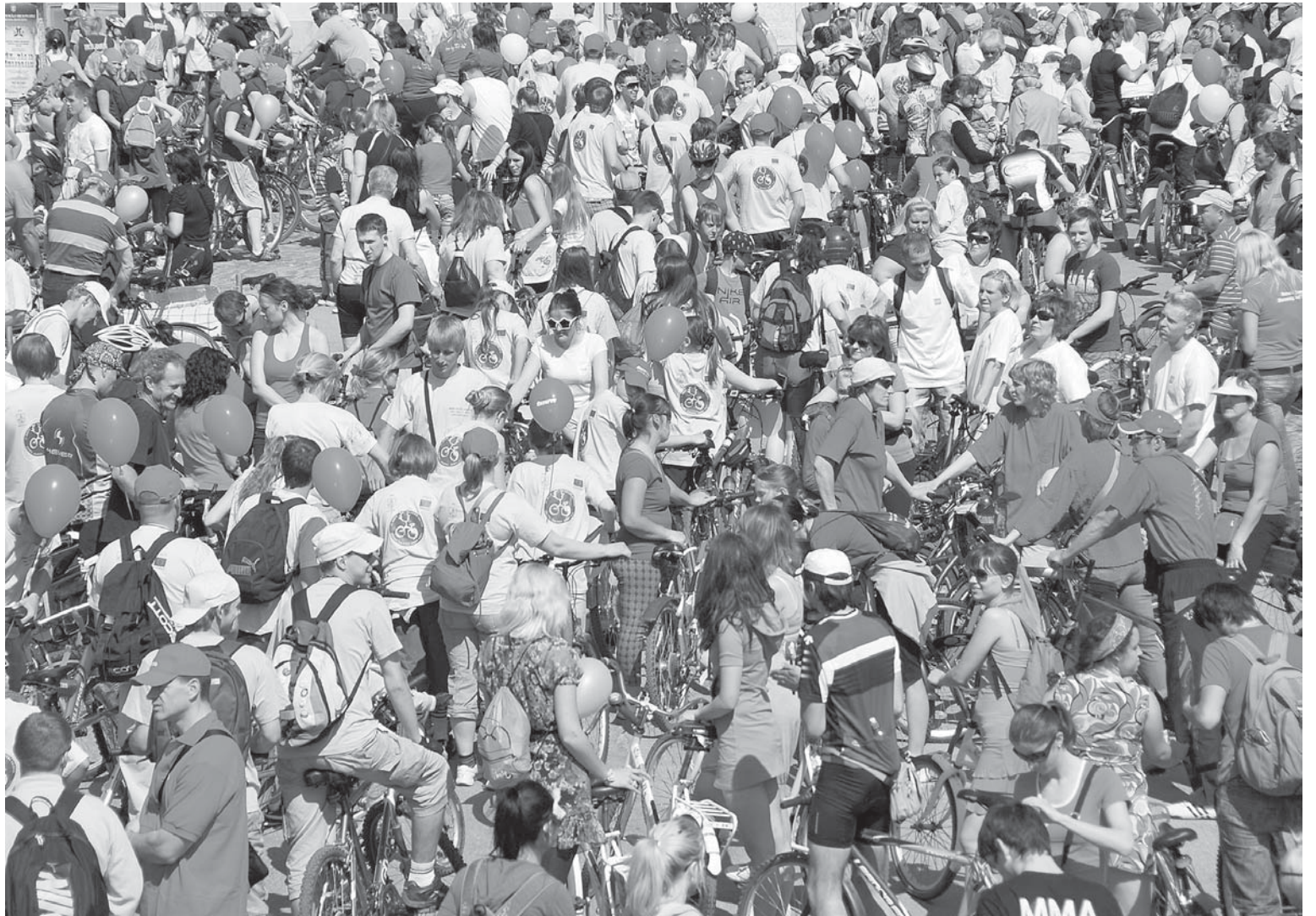
Dalībnieki pulcējušies velobrauciena startam un veloparādei Liepājas ielā.