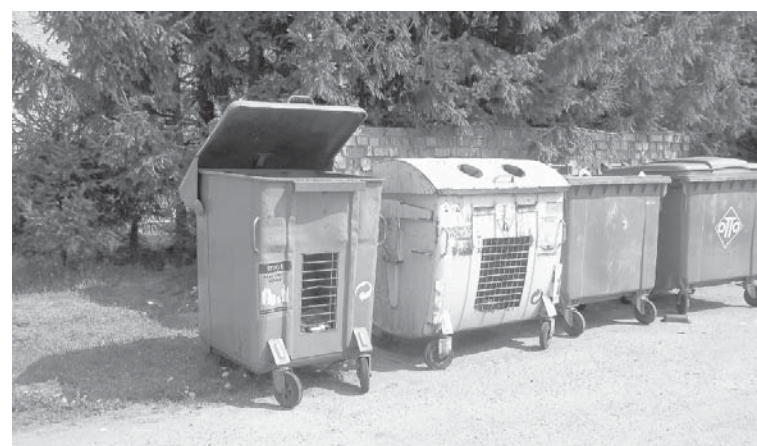
Kuldīgas komunālie pakalpojumi daudzviet pilsētā (arī pie Virkas ielas 22. nama) ir novietojuši dažādus konteinerus, lai iedzīvotāji varētu šķirot atkritumus.

Kuldīgā pirmā izloze notiks 1. jūnijā. Nākamās izlozes – 1. jūlijā, 1. augustā un 1. septembrī.