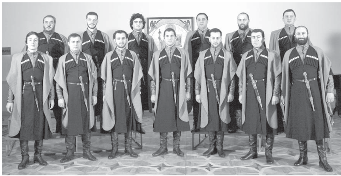
Gruzīnu vokālais ansamblis ar varenajām balsīm šovasar kuplinās Kuldīgas pilsētas svētkus.