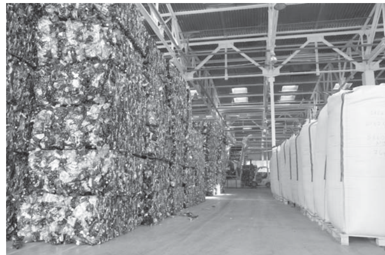
Kīpas ar PET pudelēm, kuras pārstrādā Ziemeļeiropā modernākā rūpnīca „PET Baltija”, kas atrodas Jelgavā, ir vislabākā motivācija tam, kāpēc jāšķiro PET pudeles – tās pārstrādā tepat, Latvijā.