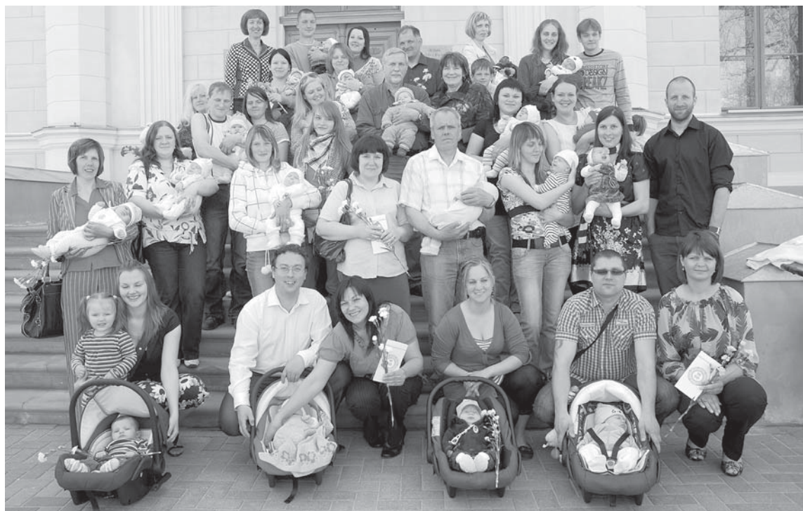
Maijā sudraba karotīšu saņēmēju pulks bija krietni kuplāks nekā parasti.