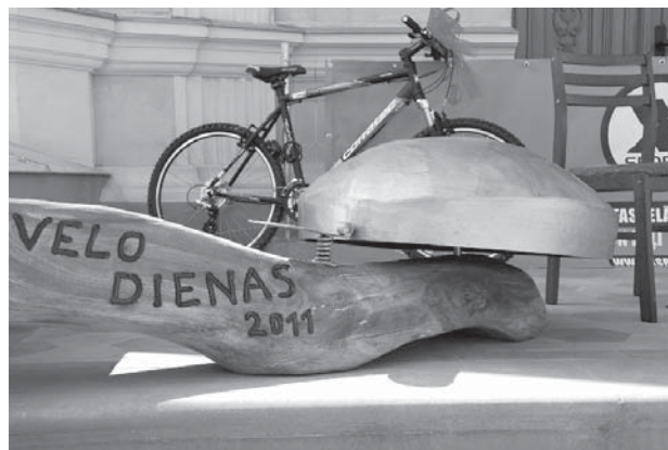
Rātslaukumā tika iezvanīts milzu velozvans.