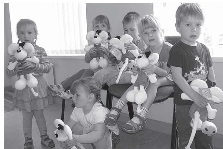
Pil „Cīrulītis” bērniem vācu draugu dāvinātās mīkstās rotaļlietas ļoti patīk.