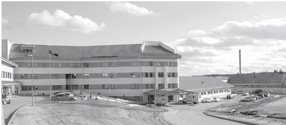
Kuldīgas slimnīca arī turpmāk sniegs kvalitatīvus pakalpojumus iedzīvotājiem.

„Svarīgākā ziņa visiem Latvijas iedzīvotājiem, ko vēlamies sniegt – medicīniskā palīdzība visur, kur tā bija pieejama līdz šim, būs arī