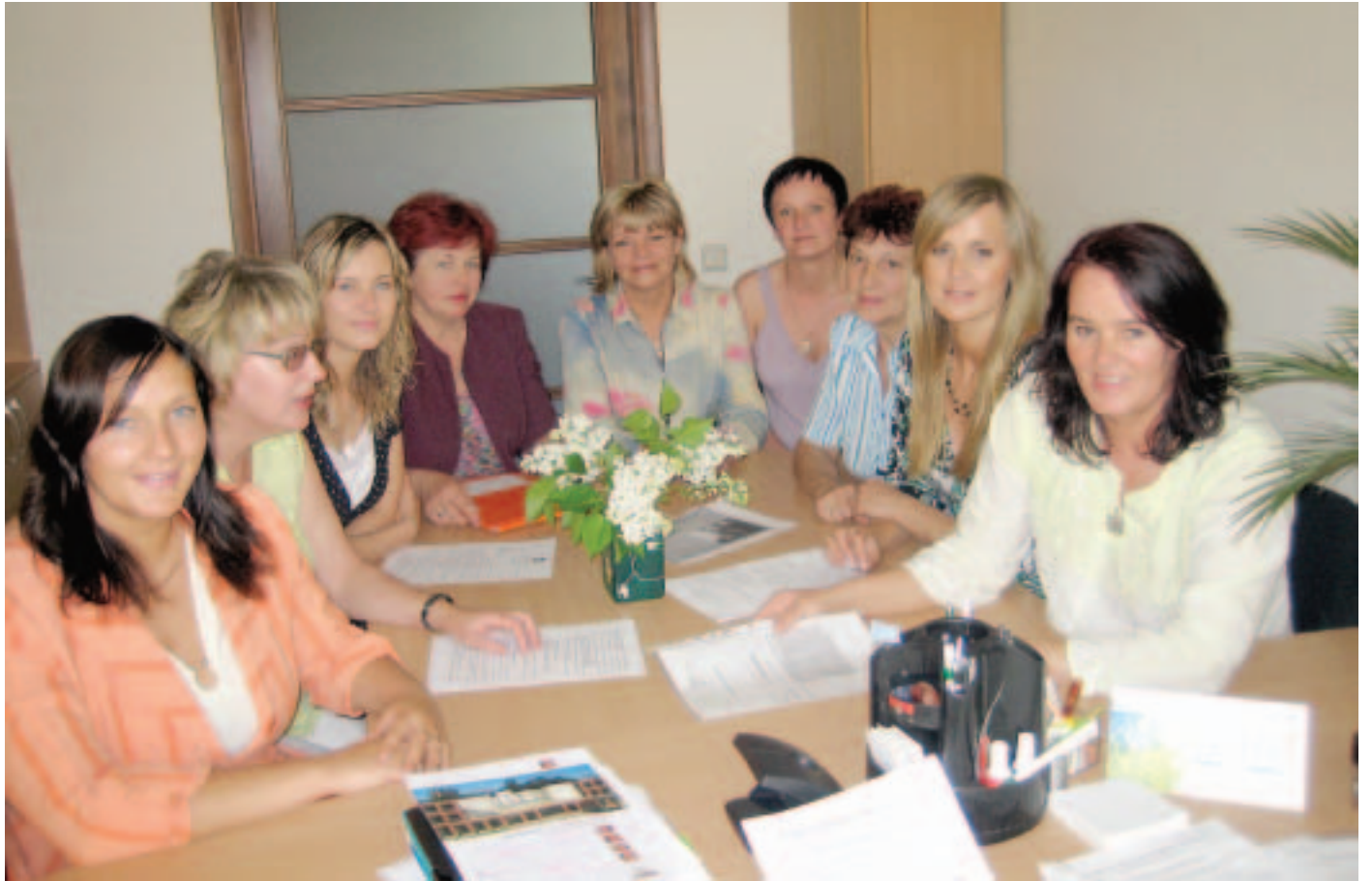
Kuldīgas pašvaldības aģentūra "Sociālais dienests" ir komanda, kas gādā, lai maznodrošinātajiem netrūktu līdzekļu pamatvajadzību – ēdiena, apģērba, mājokļa, veselības aprūpes, obligātās izglītības – nodrošināšanai.

Kuldīgas pašvaldības aģentūra "Sociālais dienests" 15.maijā svinēja 15 gadadienu.