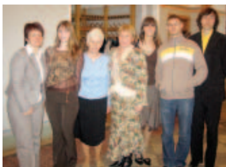
SVĒTKI SKOLU SAIMEI