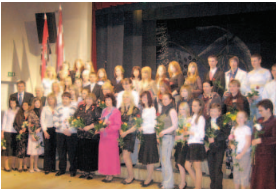
Kopīgs foto pilsētas 64 labāko skolēnu un pedagogu svinīgajā pieņemšanā pie Kuldīgas Domes priekšsēdētāja Edgara Zalāna.

2.maijā Kuldīgas Domes priekšsēdētājs Edgars Zalāns rīkoja pilsētas 64 labāko skolēnu un pedagogu svinīgo pieņemšanu.