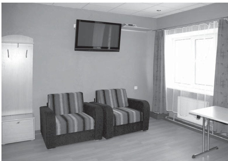
Vidusskolēniem no pagastiem un citām pilsētām dzīvošanai tiek piedāvāta Kuldīgas novada sporta skolas dienesta viesnīca Virkas ielā 15 ar mājīgi iekārtotām istabīgām.

Lai palīdzētu topošajiem un esošajiem vidusskolēniem no pagastiem un citām pilsētām risināt sadzīviskas problēmas ar dzīvošanu Kuldīgā un piesaistītu Kuldīgas novada vidusskolām skolēnus, Kuldīgas novada Dome īpašu uzmanību velta dienesta viesnīcas Virkas ielā 15