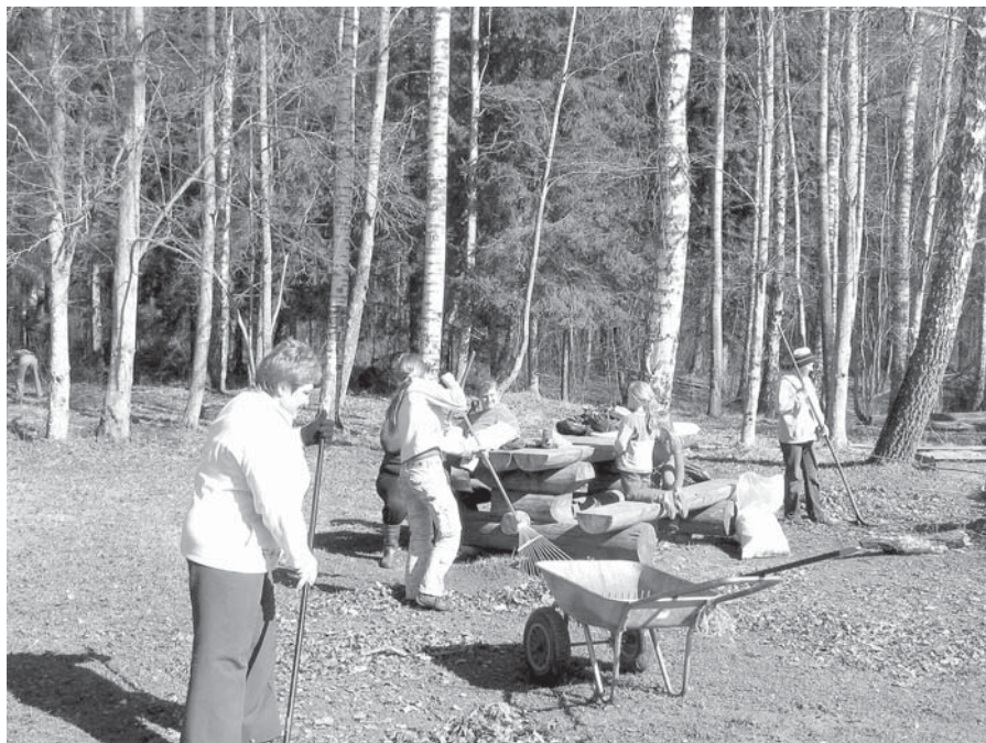
Rumbas pagasta Mežvaldē talcinieki sakopj atpūtas vietu Riežupes dabas parkā.

17. aprīlī Kuldīgas novadā notika Lielā talka, kurā aktīvi iesaistījās kā lauku, tā pilsētas iedzīvotāji. Prieks par pagastu laudim, kuri sestdien čakli rosījās apkārtnes sakopšanā. Viņiem atkritumu savākšanai tika piešķirti 5000 maisu (70 l katrs).