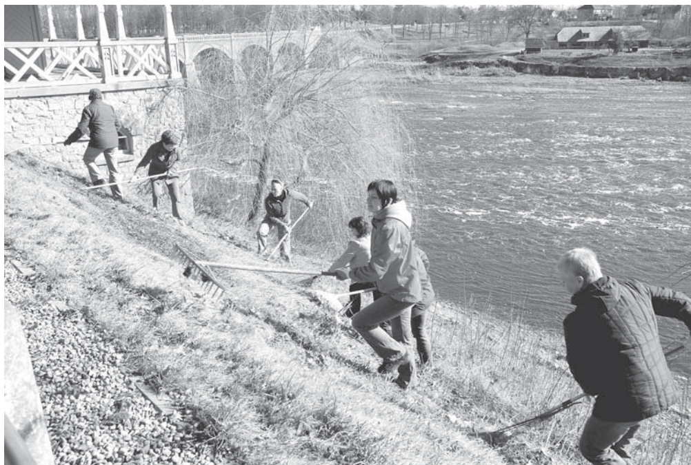
Ventmalā bija sapulcējušies ap 50 lielu un mazu talcinieku, kuri sakopa abus Ventas krastus no rumbas līdz pilskalnam.