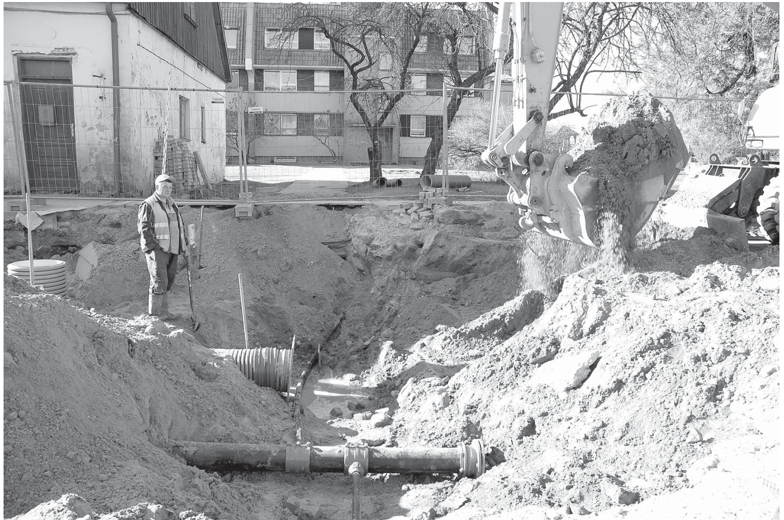
Šobrīd ūdensvada un kanalizācijas caurules tiek ieguldītas Liepājas ielas posmā, sākot no Piltenes ielas krustojuma līdz Parka ielai.