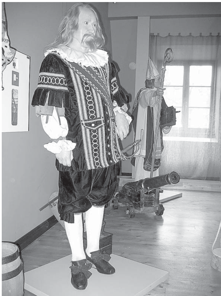
Hercoga Jēkaba vaska figūra Minhauzena muzejā Duntē.

kultūrvēsturiskajām vērtībām. Ja mēs neko par to nezinām vai zinām ļoti maz, tad, iespējams, mums šī personība šķiet tāla, vāciska un vienaldzīga.