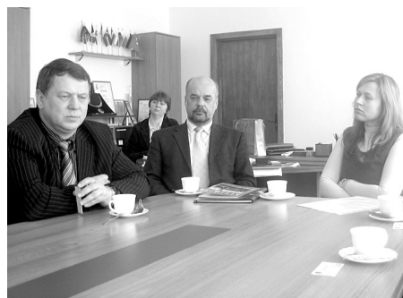
SADARBOSIES AR LIETUVIEŠIEM