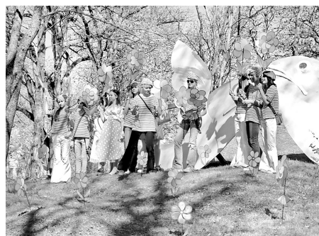
LIDO ZIVIS KULDĪGĀ