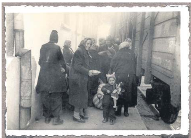
Bērnu un jauniešu centrā apskatāma izstāde par bērniem holokaustā – lelles, rotaļlietas un mīļlietas, kas kļuva par svarīgu viņu dzīves sastāvdaļu kara laikā.

Kuldīgas novada Bērnu un jauniešu centrā, 1905. gada ielā 10, no 17. marta līdz 3. aprīlim apskatāma izstāde par bērniem holokaustā „Vairāk nekā bērnu spēles”.