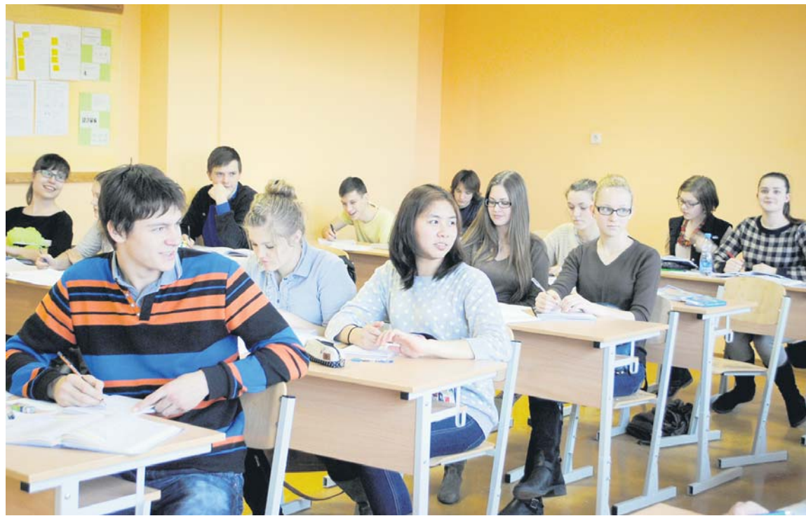
Apmaiņas programmas skolniece no Taizemes Papanuna Ruamsapa mācās Kuldīgas Centra vidusskolas 10.m klasē un priecājas par draudzīgo un izpalīdzīgo klases kolektīvu.

Jaunā taizemiete ir pieredzei atvērts cilvēks, motivēta smelties iespaidus un zināšanas. Viņa ne-