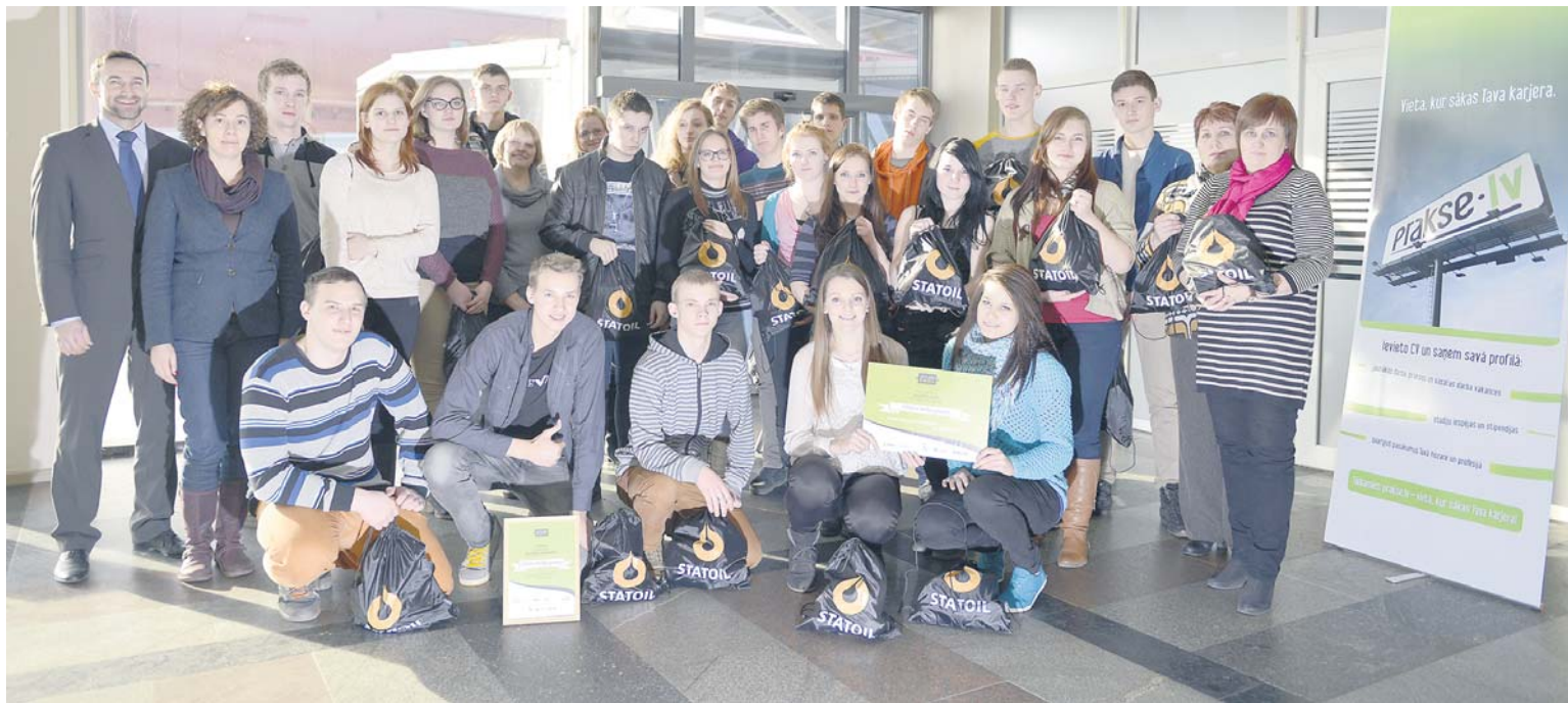
V.Plūdoņa Kuldīgas ģimnāzijas 11. klase starp 490 Latvijas skolām ieguva zinošākās skolas titulu spēlē „Virtuālā prakse”.

EVIJA SPROĢE, V.Plūdoņa Kuldīgas ģimnāzijas informācijas tehnoloģiju uzturētāja Publicitātes foto