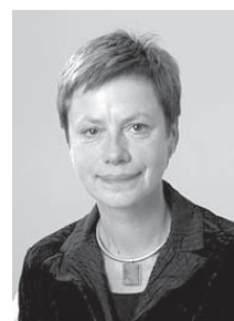
SARMĪTE ĒLERTE, UNESCO Latvijas Nacionālās komisijas prezidente, kultūras ministre

Latvijas, gan pasaules sabiedrībai darīt zināmus nozīmīgākos kultūras un dabas mantojuma objektus, pievērst uzmanību to saglabāšanai un potenciālam dzīves un vides kvalitātes attīstībā.