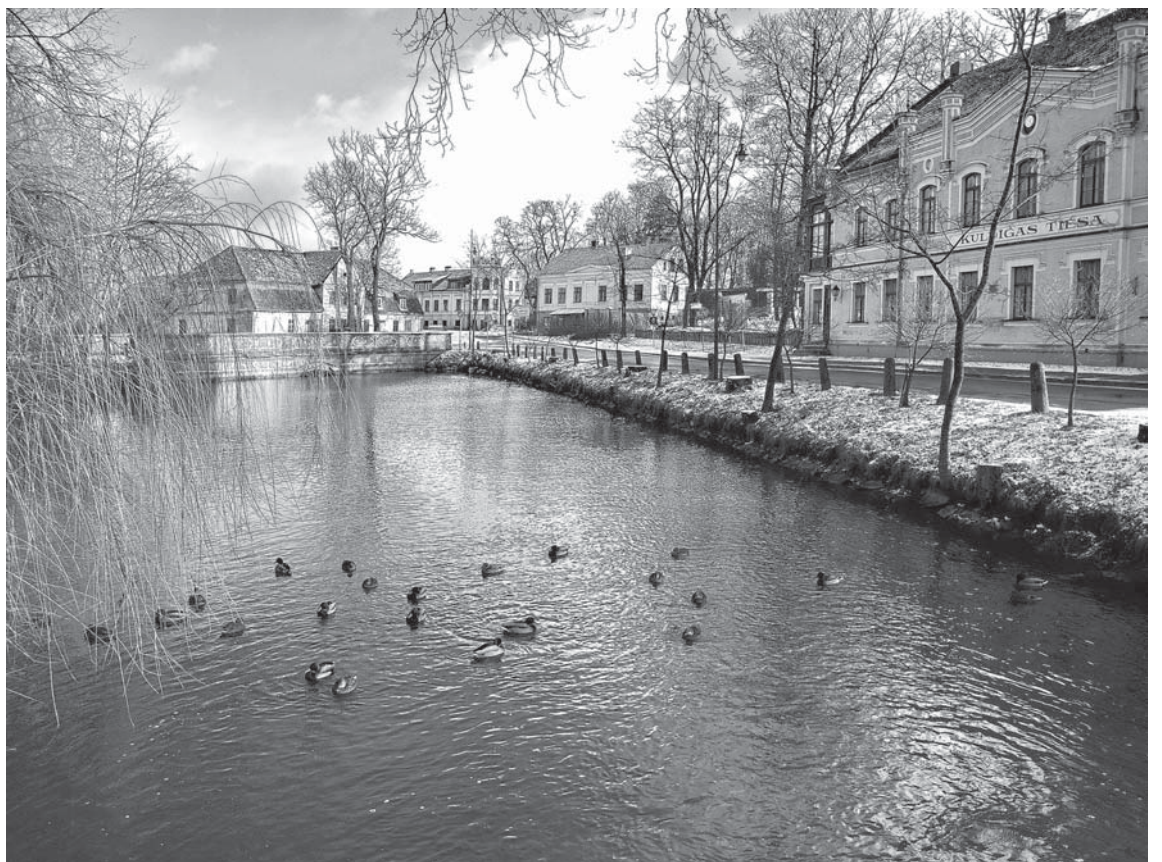
Nacionālais saraksts ir platforma, kurā varam izcelt savas nacionālās vērtības, kas mūs raksturo pasaules kontekstā. Iekļaušana šajā sarakstā nozīmē, ka Kuldīgas vecpilsēta Ventas senlejā ir ne tikai Kuldīgas, bet arī visas Latvijas un pasaules sabiedrības unikāla vērtība un mantojums.

Kuldīgas vecpilsēta Ventas senlejā tika vērtēta no vairākiem aspektiem: mākslas vai tehniskā vērtība, unikālitate, mantojuma autentiskums un, kas ir ļoti nozīmīgi, identitātes vērtība, kas bieži saistīta ar emocionālo pieķeršanos kādai vietai vai