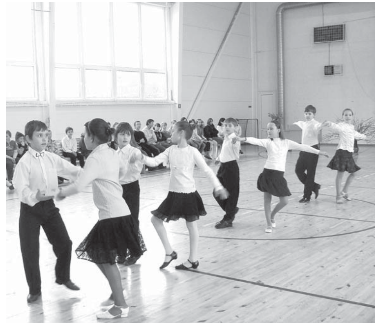
Deju konkurss „Vilgāles pavasaris 2009”, deju 3. – 5. klašu grupa.

dartus. Skolēni ar prieku apmeklē sporta stundas, skolas organizētās sacensības, sporta dienas,” pastāstīja A. Štorha.