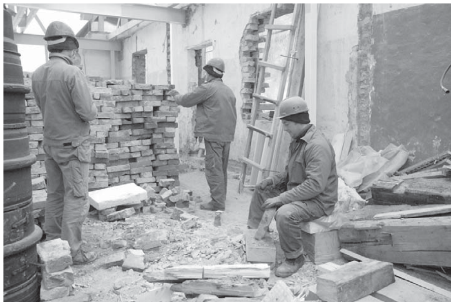
Depo ēkā izveidota pagaidu nojume (nams apvilts ar plēvi), kas pastāvīgi tiek apkurināta, lai varētu arī aukstajā laikā turpināt būvniecības darbus.