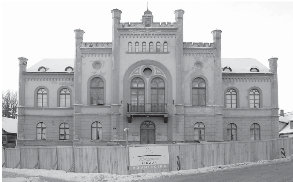
SIA „Kurzemes ligzda” plāno objektu pabeigt līdz novembrim, bet galveno ēku iecerēts nodot līdz Kuldīgas pilsētas svētkiem jūlijā.