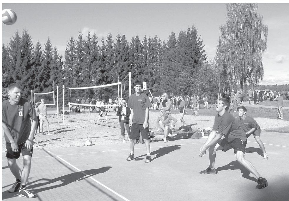
Pērn 19. septembrī Vārmē norisinājās 1. Kuldīgas novada sporta spēles, kurās Vārmes pagasta pārvalde kopvērtējumā ieguva 3. vietu. Attēlā – Vārmes volejbola komanda.

Vārmenieki lepojas ar jauno, ilgi loloto sporta halli un atjaunoto stadionu.