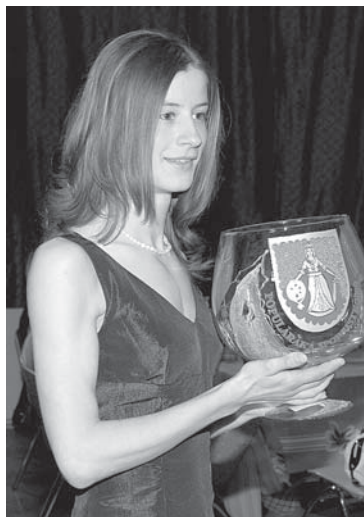
Anete Midrijāne – 2009. gada populārākā sportiste.