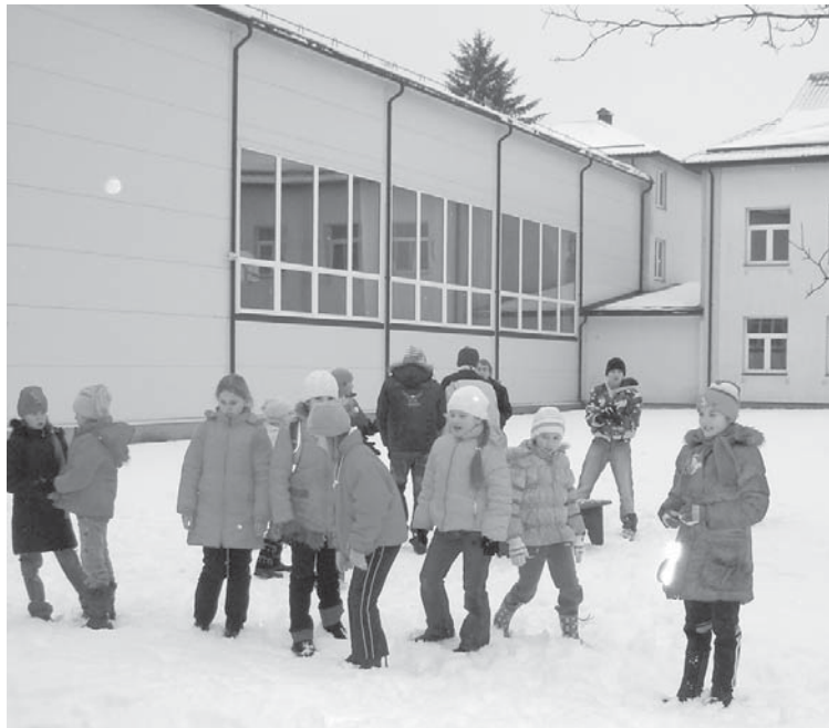
Bērni priecājas par sniegu Vilgāles pamatskolas sporta zāles iekšpagalmā.

„Sportojot skolēni nostiprina veselību, apgūst pareizu stāju, attīstās fiziski un emocionāli. Vilgāles pamatskolas skolēniem ir dota iespēja apgūt sporta spēļu pamatprasmes un noteikumus, prasmi darboties komandā un ievērot godīgas spēles principus. Izmantojot sporta zāles plašumu, daudzveidīgo sporta inventāru, pedagoģiskās darba metodes un paņēmienus, Vilgāles pamatskolas skolēni var labi apgūt pamatizglītības stan-