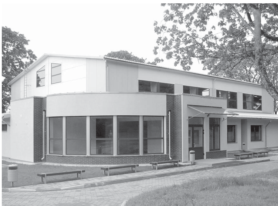
Vārmenieki kopš pagājušā gada oktobra var sportot mūsdienīgā sporta hallē.