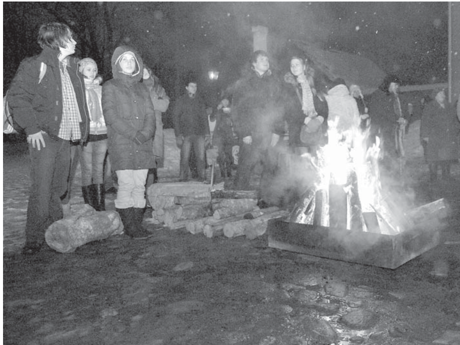
Sanākušie iedzīvotāji pie Kuldīgas novada muzeja atcerējās barikāžu dienu notikumus, kas šodien raisa tikpat skaudras emocijas kā pirms 20 gadiem.

22. janvāra vakarā Kuldīgas novada muzeja pagalmā pulcējās daudz ļaužu, lai pie ugunsroka, tējas un zupas atcerētos barikāžu 20. gadskārtu. Pasākumā bija ieradušies barikāžu dalībnieki, skolēni un citi interesenti no Kuldīgas, Kabiles, Laidiem, Snēpeles, Pelčiem u.c.