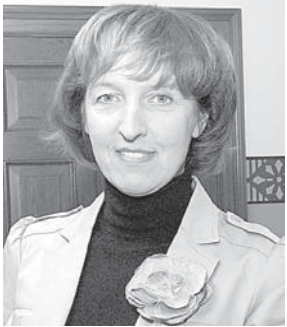
INGA BĒRZIŅA, Kuldīgas novada Domes priekšsēdētāja

2011. gada budžets, līdzīgi kā iepriekšējā gadā, Kuldīgas novada pašvaldībai ir izdzīvošanas budžets. Pēc Latvijas Pašvaldību savienības informācijas valsts kopbudžeta izdevumi, sākot no 2008. gada, ir samazinājušies par 200 000 miljoniem latu, bet pašvaldību kopējie izdevumi par 500 000 miljoniem. Tas nozīmē, ka krīzi uz saviem pleciem ir iznesušas pašvaldības.