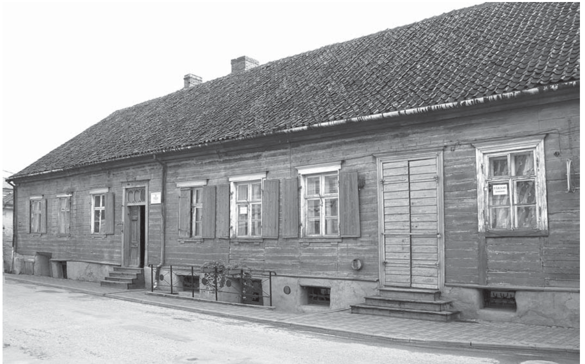
Stafenhāgena namā atjaunos plašo koplietošanas koridoru – vestibilu, kurā atrodas unikālā „zviedru lāde”.

Precīzs tagadējās ēkas būvniecības laiks nav zināms, spriežot pēc ēkas inventarizācijas materiāliem, tā būvēta 18. gs. 60. – 70. gados. Sākotnēji ēkai ir vienstāva, plānā taisnstūra apjoms uz augsta cokola ar divslīpju jumtu, novietots gar ielu, vēlāk ēkas pagalma pusē dienvidu galā uzbūvē vienstāva mūra piebūvi. 19. gs. 2. ceturksnī ēkā notiek ievērojami remonta darbi – nomaina daļu āršien