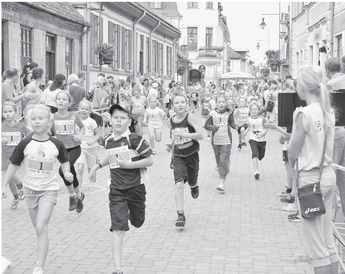
Kuldīgas pusmaratonā katru gadu tiek rīkots skrējieni arī bērniem, kas ir ļoti kupli apmeklēti.

Viesmīlīgā Kuldīga šogad iedzīvotājus aicinās uz vairākiem plašu popularitāti ieguvušiem pasākumiem.