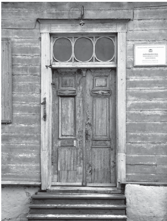
Ēka lepojas arī ar autentiskām vēsturiskām durvīm.