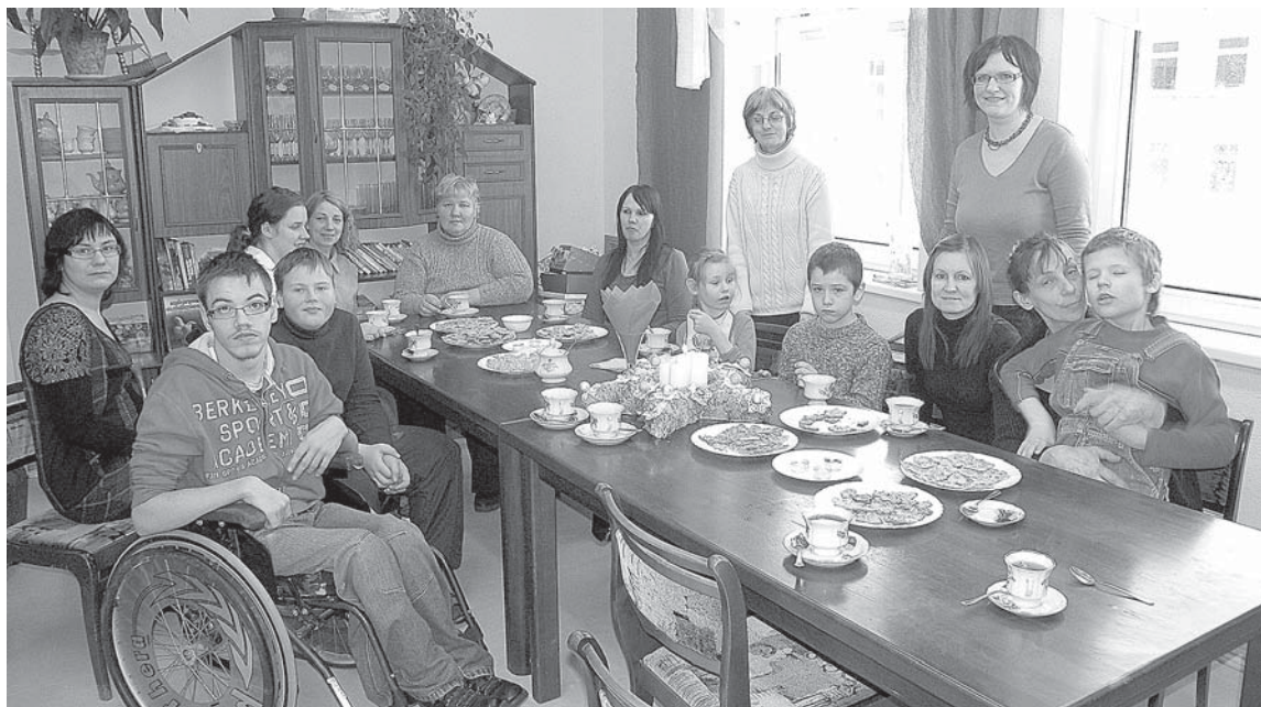
Atbalsta grupa "C" klašu bērnu vecākiem palīdz psiholoģiski un morāli, un tas ir arī interesanti un lietderīgi kopā pavadīts laiks.

Februārī kopā sanākt tiek aicināti visi tie „C” klašu bērnu vecāki, kuriem ir vēlme radoši darboties pašu rokām, darinot nelielas lietišķas sev vai tuvam cilvēkam. Savā